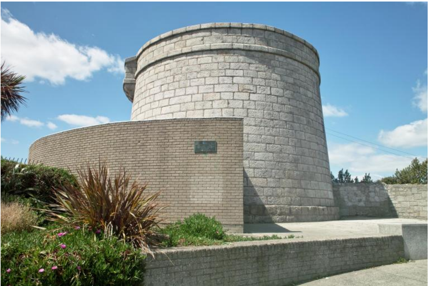
Stephen, bardo in miseria (5 agosto)

Veniamo all'altro termine, "empatia". Il dizionario Zanichelli lo dà come voce dotta, dal greco empàtheia ("passione"), derivata da pathos ("affetto"). Dunque posso riformulare la frase scritta sul muro così: il consumo uccide o soffoca qualcosa per cui abbiamo affetto o una passione o un amore. Di cosa si tratta? Si può dire subito che le cose per cui abbiamo affetto sono generalmente quelle che hanno fatto parte della nostra vita, oppure l'ambiente in cui siamo cresciuti. Ma questo affetto può anche essere qualcosa che si sviluppa in me lavorando o imparando una pratica che non sapevo e che è diventata per me importante. Questo è il caso dell' Ulisse di Joyce: non c'è niente che io mi aspetti dal lavoro di traduzione che sto facendo; non guadagnerò abbastanza soldi per mantenermi neanche un terzo degli anni di lavoro previsti; ma non sento di essere defraudato, perché quello che sto facendo è come una mania o come un amore o come uno di quei sacrifici a cui si dedicavano i santi d'un tempo. E questa mi sembra l'unica conclusione a cui riesco ad arrivare. Il resto è oscuro. Ne parlerò un'altra volta.