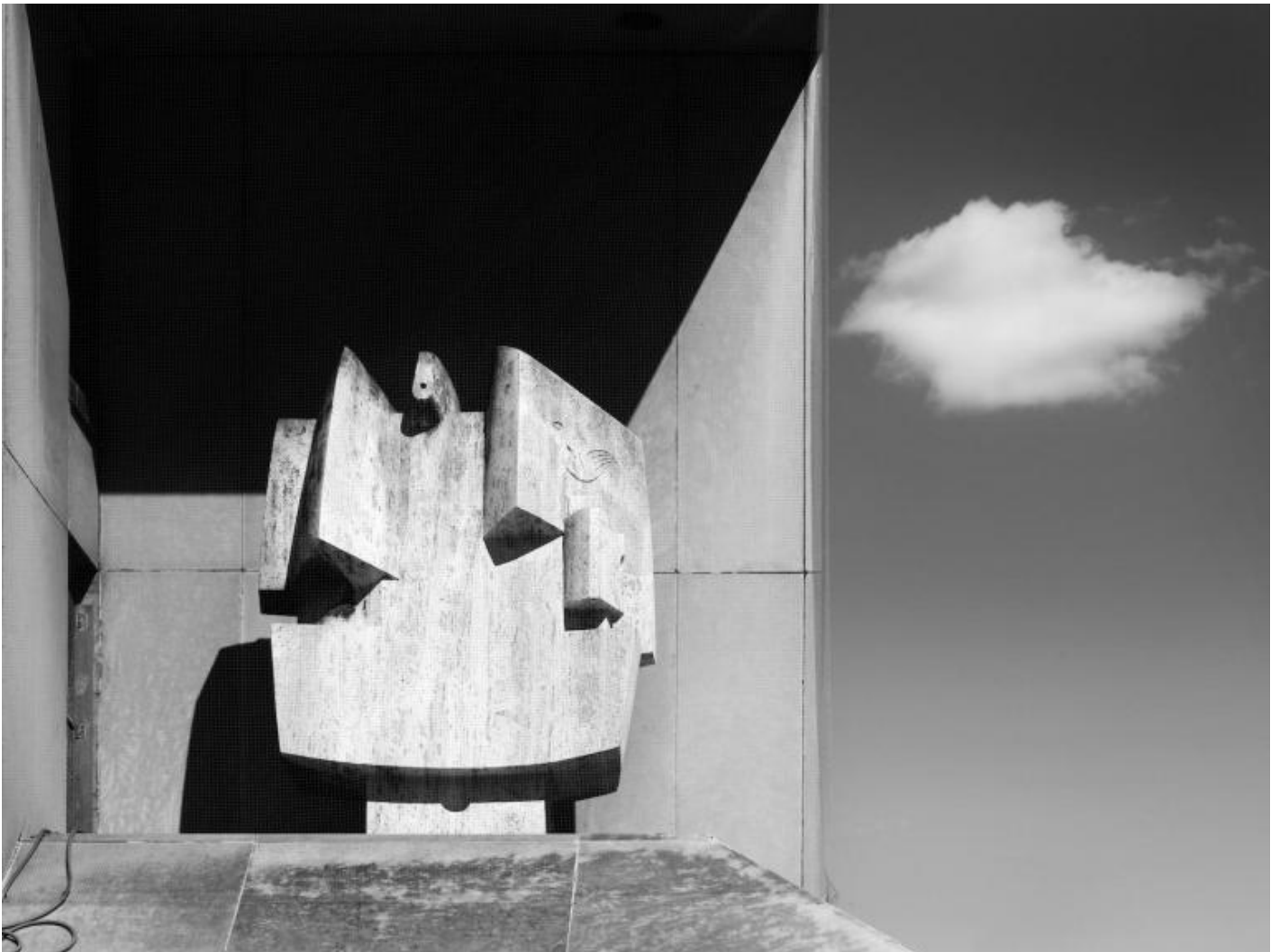
TINO, Nivola in America "The Family" (a mother and child) Bronx Family-Criminal Courthouse, Bronx, NY

Nella forma, come nel contenuto, opera come un grande, visivo trait d'union tra il palazzo della compagnia di assicurazioni e gli abitanti della città. Dal punto di vista tecnico ed emotivo, notevoli sono il senso di tenerezza e di delicatezza che Nivola riesce a comunicare anche in queste opere di gigantesche dimensioni. L'intero rilievo è perfettamente leggibile anche se accennato; la transizione tra un piano e l'altro è così morbida da non imprigionare mai la luce nel chiuso di ombre scure. Al contrario, la luce rimane sempre diffusa, penetra ovunque, crea un'illuminazione che rende brillante l'intera composizione. L'artista riesce a fondere l'insostanzialità della pittura nella durata della scultura. È il primo, nella nostra epoca, a riportare il bassorilievo al suo originario potere espressivo, a restituirgli quell'elevato rango spirituale già posseduto".