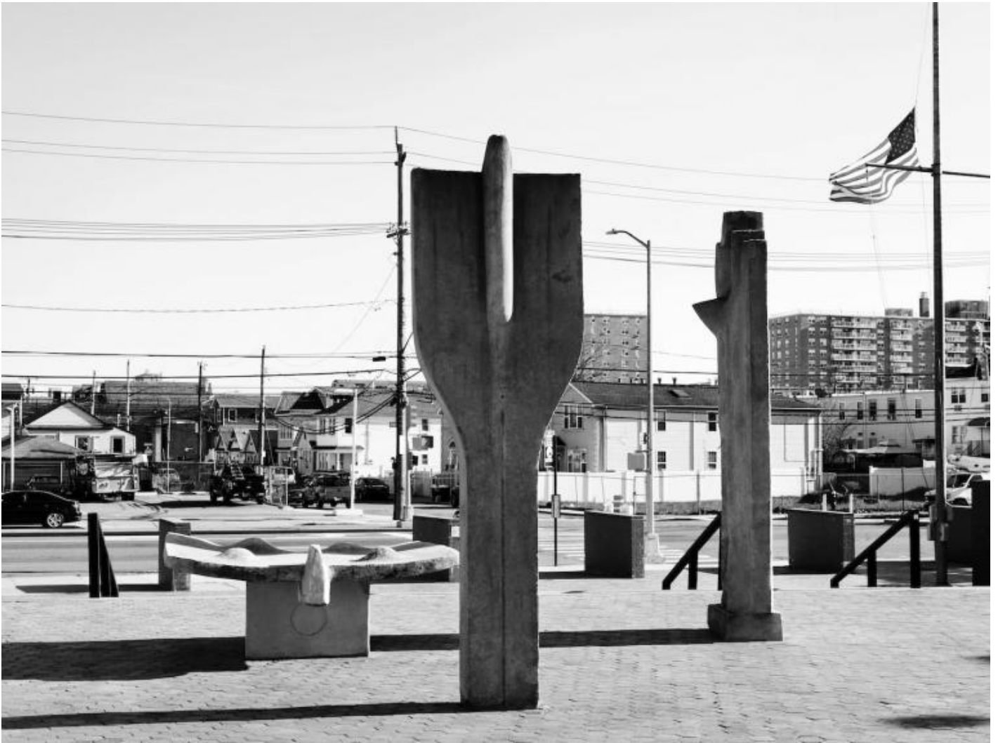
TINO, Nivola in America "The Family" Beach Channel High School, Rockaway Park, NY

Ma, ovviamente, non bisogna dimenticare l'episodio fondativo dell'attività artistica pubblica di Nivola. Il ritorno, nel 1958, a Orani per l'intervento nella facciata della Chiesa di Sa Itria e per la mostra, nelle strade del paese, delle sue sculture. Il reportage fotografico di Carlo Bavagnoli, strepitoso, restituisce tutto il senso di quella operazione e di quella esposizione che lo stesso Nivola non esitava a dichiarare come la più importante della sua vita. Infitte su semplici aste di metallo e tenute da un altrettanto semplice piedistallo, le sculture di Nivola sono dei meteoriti, strutture plastiche piovute da un altro pianeta, dalla Luna, in un paese che, per l'architettura spontanea e lo stato di generale arretratezza, è saldamente ancorato al suo passato. E invece il miracolo dell'arte si compie. "Benide a biere sos tribaglios de Titinu Nivola oye crasa e pusticrasa in sas garrelas de sos vichinados de Gusei, de sa Itria e de su Rosariu" (Venite a vedere i lavori di Titinu Nivola oggi domani e dopodomani per le strade dei rioni di Gusei, di sa Itria e del Rosario), recitava l'invito del 1958.