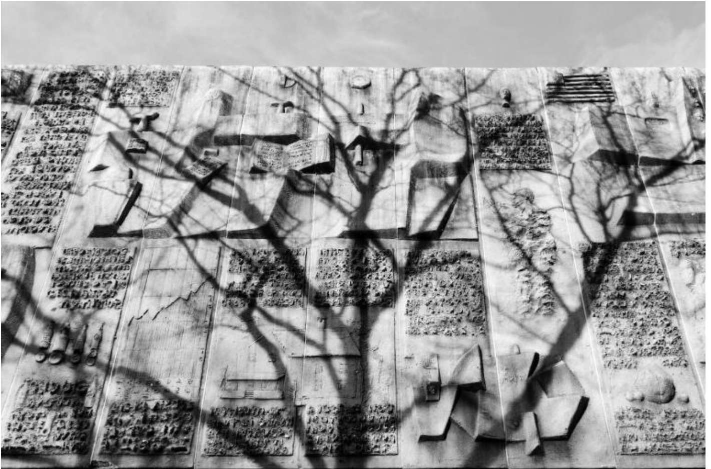
TINO, Nivola in America “Untitled” Bridgeport Post Building, Bridgeport, CT