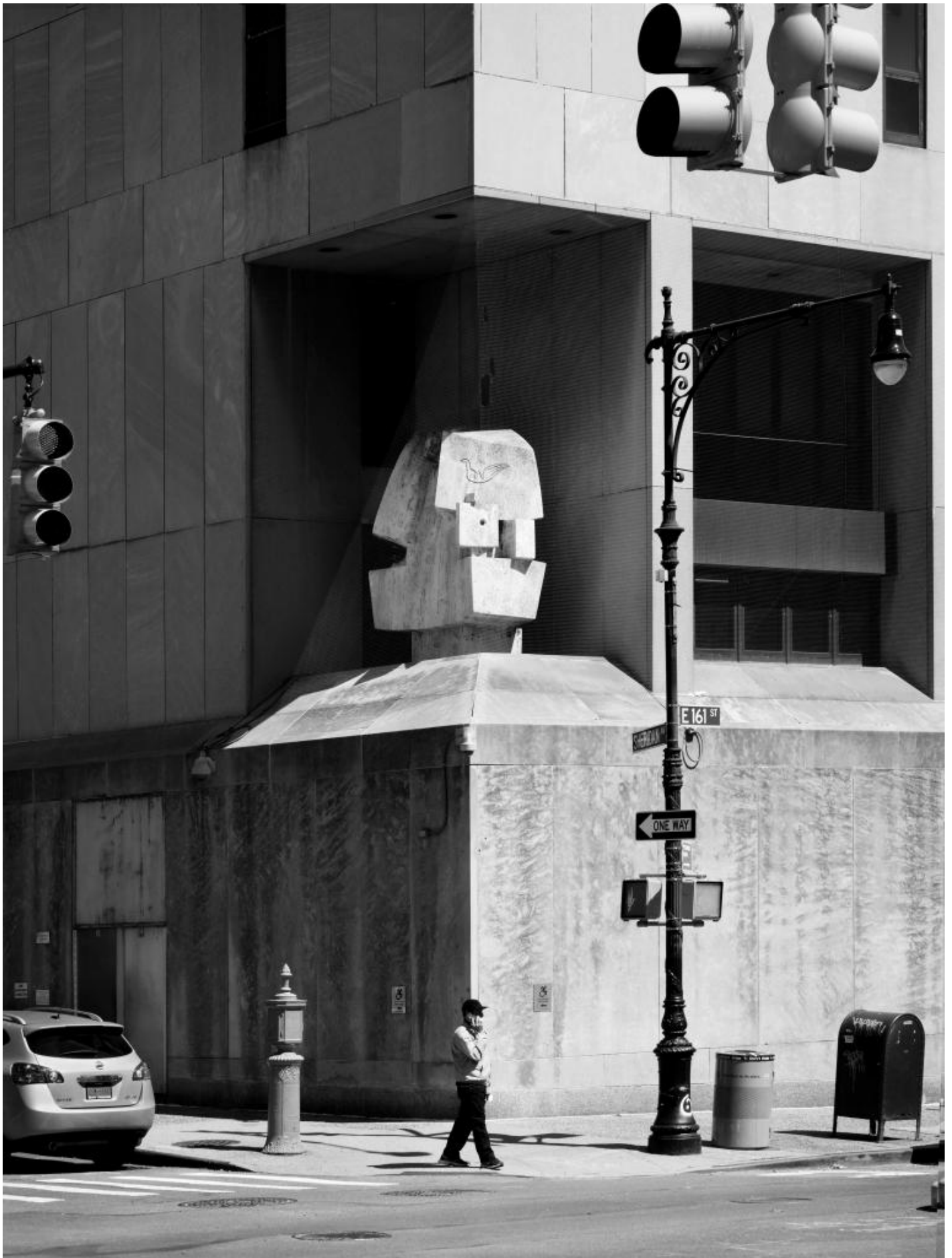
TINO, Nivola in America "The Family" (a mother and child) Bronx Family-Criminal Courthouse, Bronx, NY