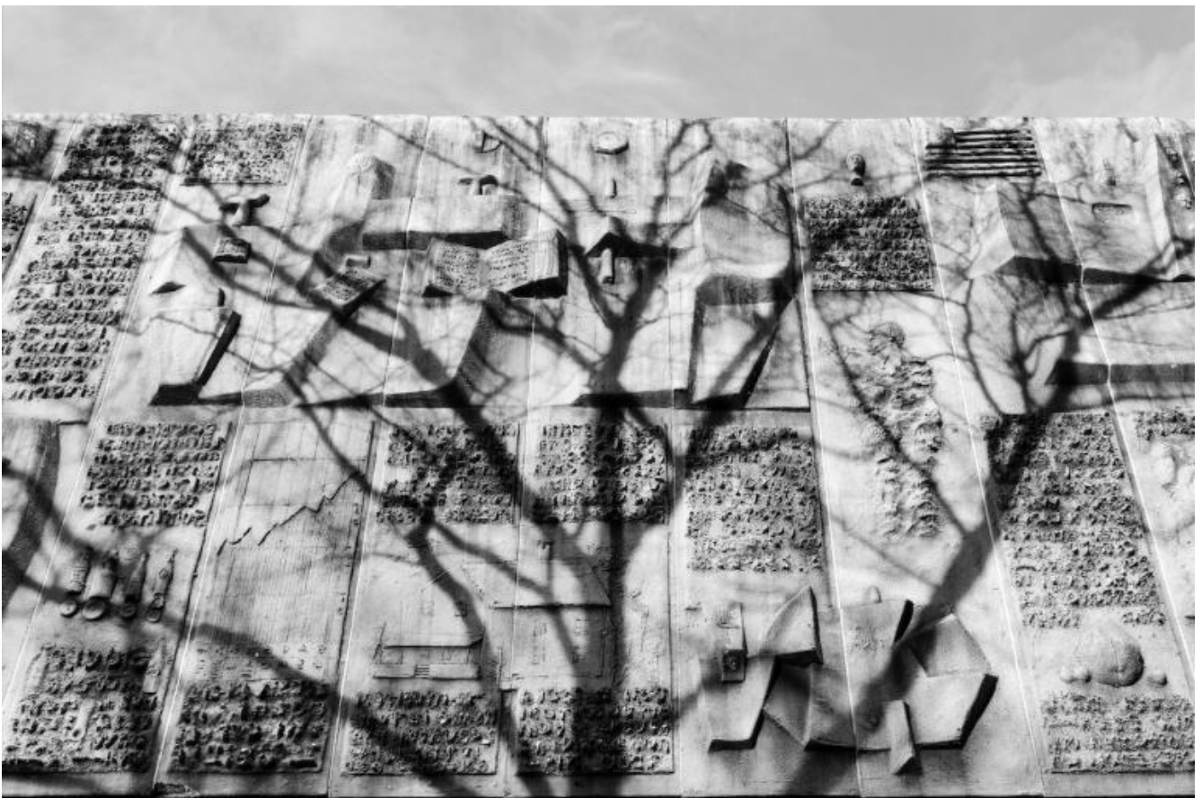
TINO, Nivola in America "Untitled" Bridgeport Post Building, Bridgeport, CT