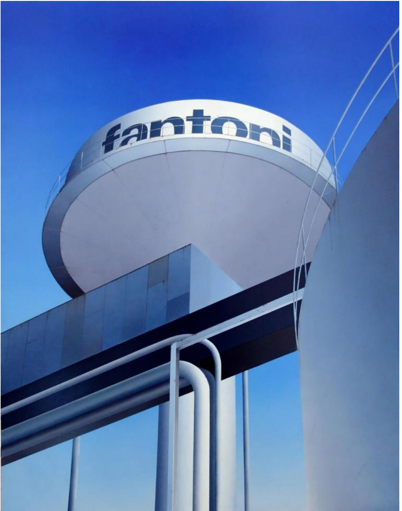
Opera di Angelo Davoli

Avevo parlato dell'azzurro anche domenica pomeriggio, con mia moglie. Stava correggendo i compiti dei suoi alunni di seconda elementare. Aveva dato degli