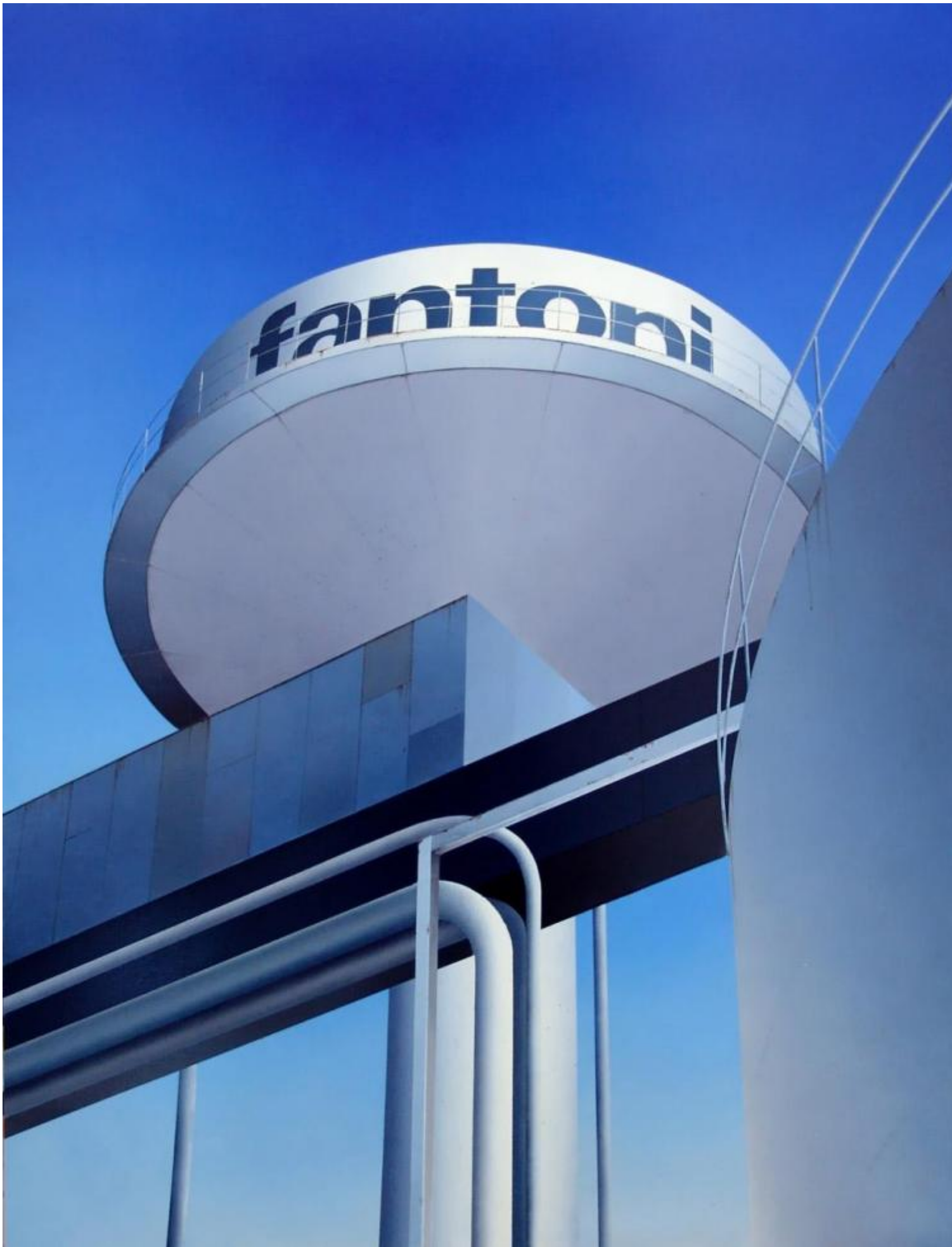
Opera di Angelo Davoli