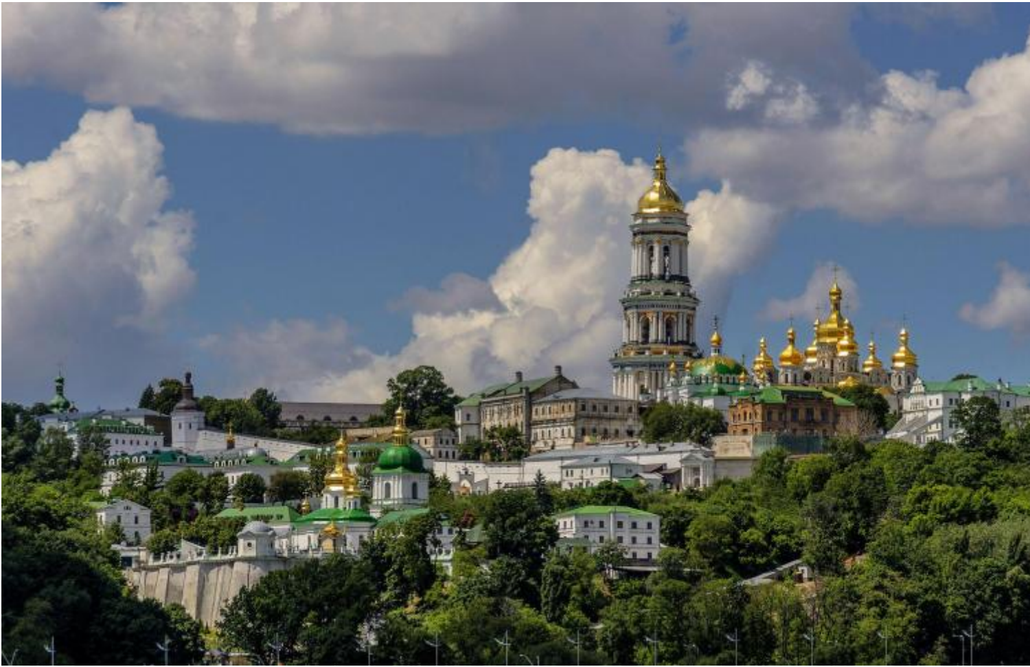
Kyivo-Pechers'ka Lavra a Kiev (con vista sul Dniepr)

Il vero conflitto tra i due paesi cominciò nel 2014, quando Putin decise di anettere la Crimea alla Russia. Prima a Kiev si alternavano partiti e leader pro-europei (quando un ucraino dice “Europa” intende Europa occidentale, escludendo quindi ipso facto l’Ucraina dall’“Europa”) e pro-russi, ma con la vittoria del filo-europeo Petro Poroshenko, Putin pensò che l’Ucraina fosse ormai “perduta”, e che quindi la cosa migliore fosse annettere le zone francamente filo-russe del paese – oltre alla Crimea, il Donbass. In realtà, separare la popolazione russa da quella ucraina è come voler separare il latte e il caffè da un cappuccino.