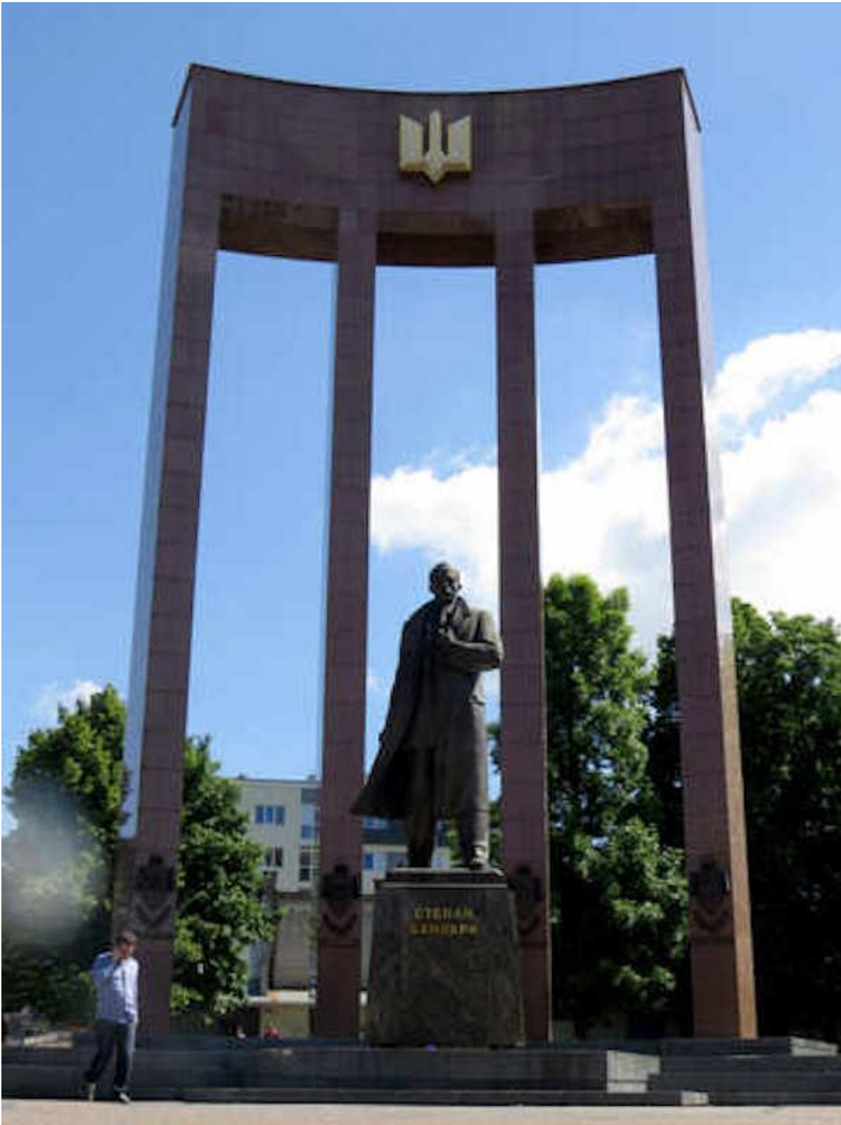
Monumento a Bandera a L'viv

D'altro canto gli ucraini detestano sempre più i russi e il loro governo. Diciamo che sempre più per i russi gli ucraini sono "fascisti", sempre più per gli ucraini i russi sono "comunisti sovietici", anche se entrambi non sono di fatto né l'uno né l'altro.