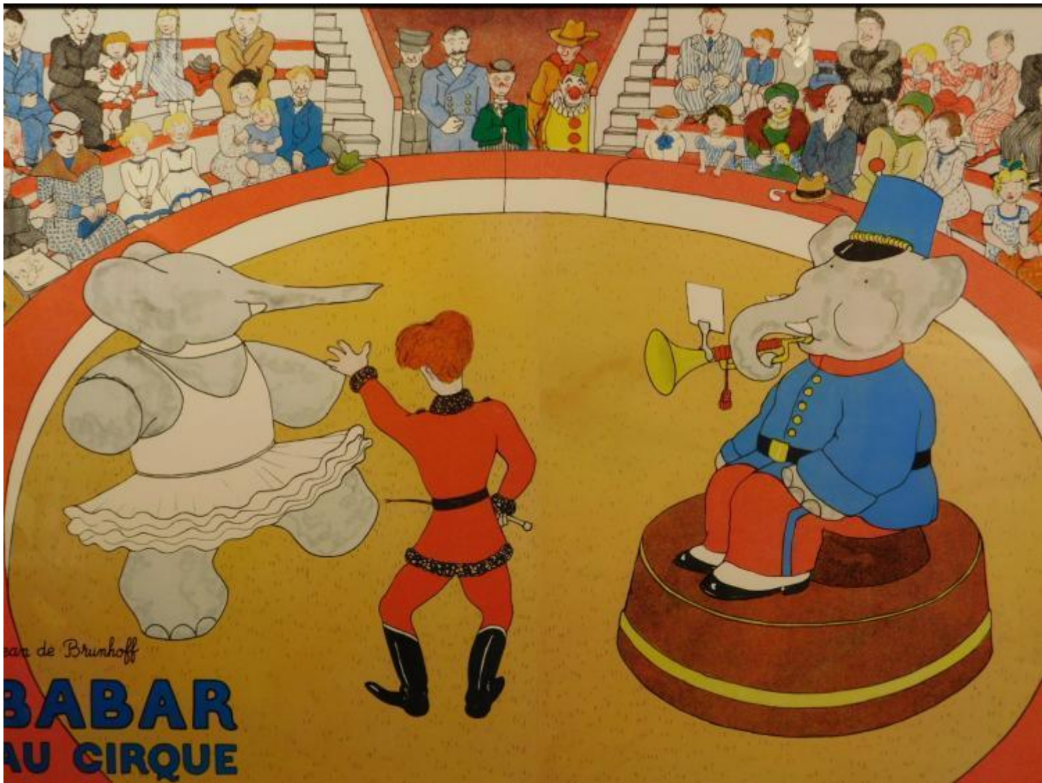
Illustrazione di Jean de Brunhoff per Babar Au Cirque, 1952.