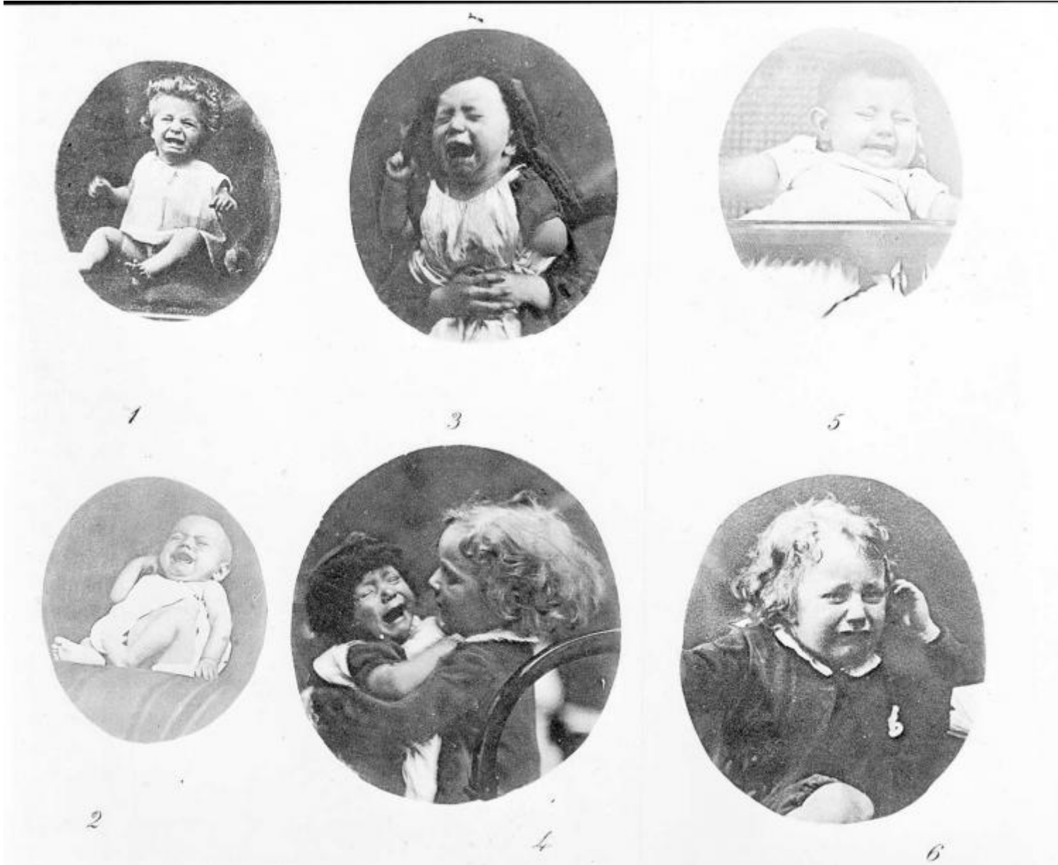
Tavola 1 per The Expression of Emotions in Man and Animals, Charles Darwin, Londra, 1872.

I bambini, suggerisce, questa letteratura, sono esseri umani nuovi di zecca e al tempo stesso antichissimi: radicalmente diverso da quello degli adulti è il loro concetto di tempo e il modo che hanno di percepirlo; il loro sentimento di appartenenza al tutto, più che al gruppo; il loro rapporto con la natura; la loro vicinanza con il mistero della nascita e quindi con quello della morte; la loro capacità di presenza, la loro familiarità con la dimensione dell'essere e, per contrasto, del non essere, così estranea e minacciosa per l'adulto; la loro prossimità con l'incandescente vita delle emozioni e del pensiero,