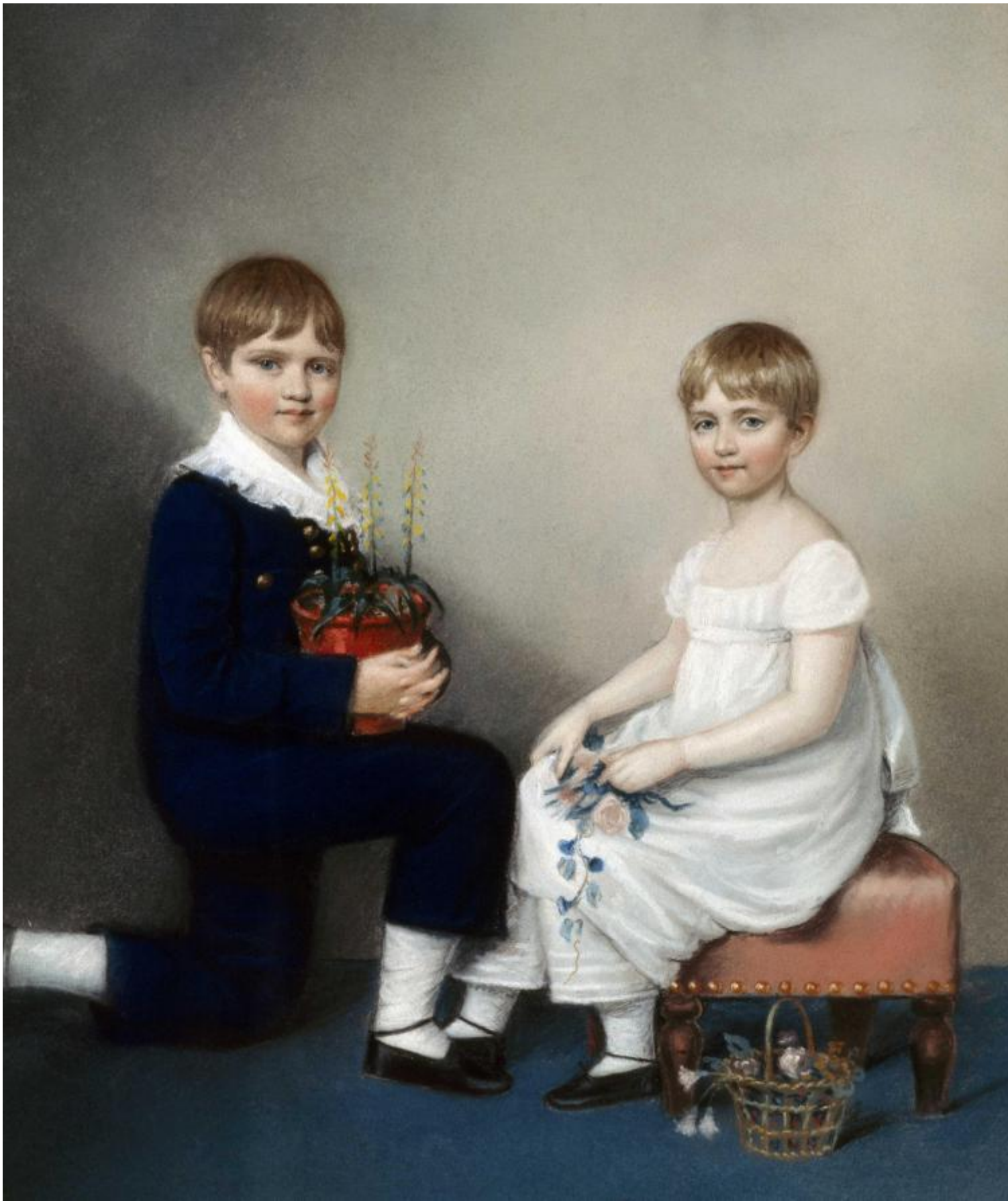
Ellen Sharples, ritratto di Charles Darwin all'età di sei anni con la sorella Catherine, 1816.