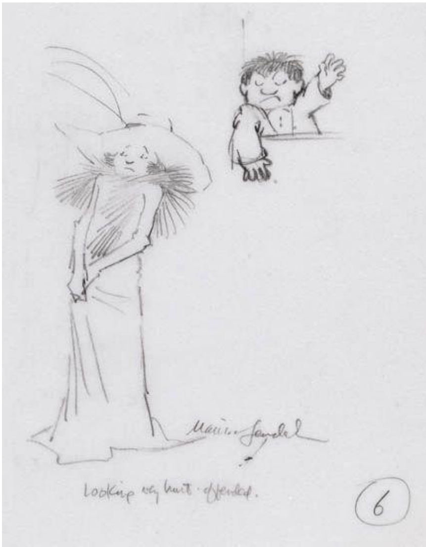
Maurice Sendak, schizzo per le animazioni dello speciale televisivo Really Rosie, 1975.