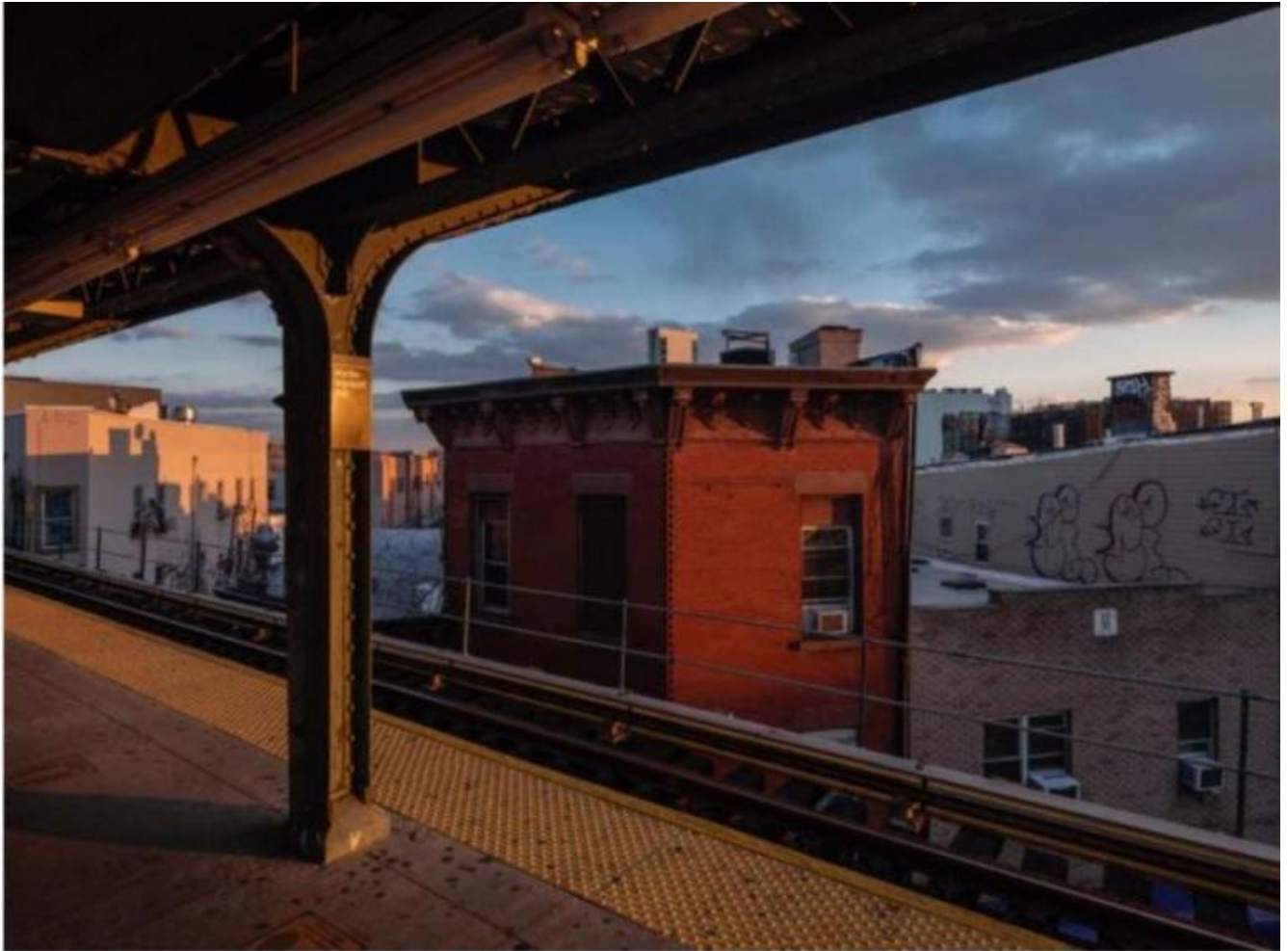
Red house, Lynn Saville, courtesy of the artist and Alessia Paladini Gallery.

il senso di vuoto, come se volessero «testimoniare luoghi di vacante autosufficienza senza disturbarli o intromettersi» - come scrive Geoff Dyer.