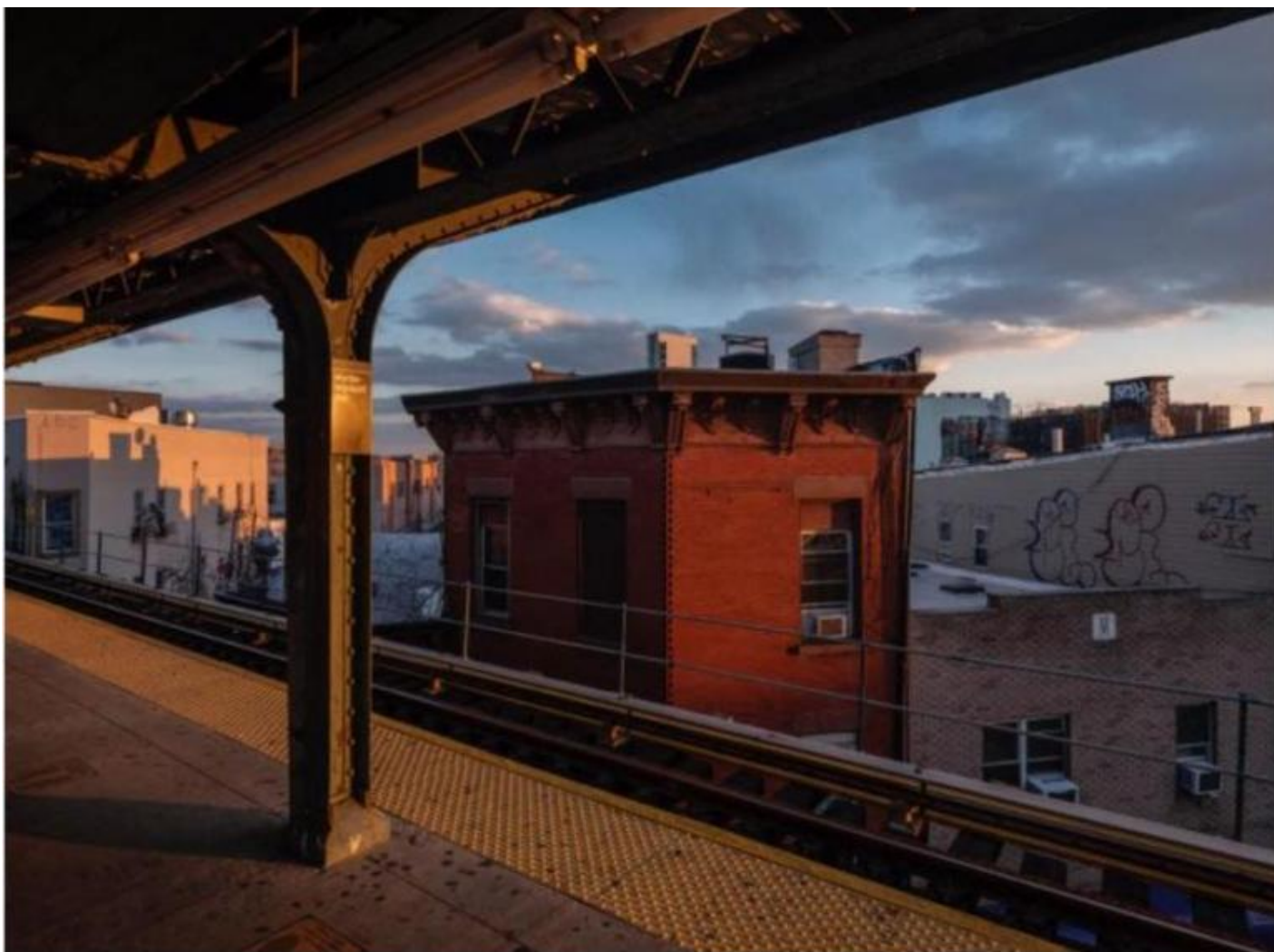
Red house, Lynn Saville, courtesy of the artist and Alessia Paladini Gallery.

Si è detto spesso che la fotografia tradizionale – e quella di Saville per certi versi lo è – ha cercato di rassicurare le coscienze dando l'illusione che la realtà fosse concretamente raffigurabile nelle immagini fotografiche. Solo l'incompletezza, l'apertura allusiva, la forza evocativa e un approccio non documentario – secondo questo modo di intendere le fotografie – può conferire un valore aggiunto alle immagini, aprirle all'immaginazione del fruitore. Ebbene, è come se le immagini di Saville dimostrassero che è vero anche il contrario: infatti, indagando con la massima precisione la realtà visibile ciò che emerge è qualcosa di invisibile. Un invisibile da intendersi però – almeno nel suo caso – in un doppio senso. Da una parte la realtà, tradotta in immagine, s'impone con un'alterità enigmatica e rinvia a un che di straniante, di inafferrabile.