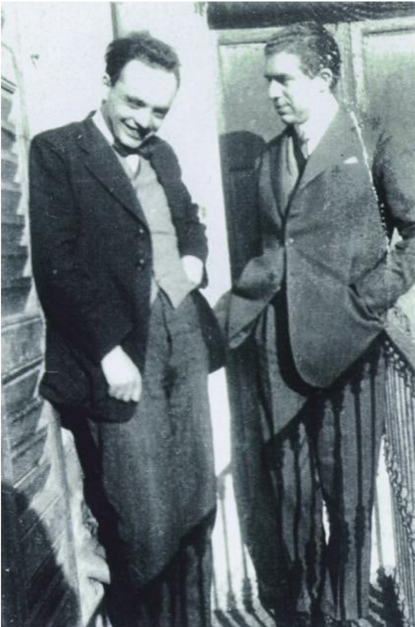
Sergio Solmi (a sinistra) e Eugenio Montale (a destra), 7 febbraio 1925, Milano.

Solmi lo informa: “Sto scrivendo, più per farmi la mano che per altro, appunti critici su poeti e scrittori moderni”. A fine anno Montale commenta: “Ho perso da molto tempo ogni fiducia nella filosofia e posso informarti del mio ben definitivo distacco da ogni forma di hegelismo di gentilismo ecc. (estetica crociana compresa)”. Nelle loro lettere, e resterà un’abitudine, commentano l’attualità letteraria. Non sono avanguardisti ma sono perplessi dal rappel à l’ordre promosso dalla ‘Ronda’. Secondo Solmi, nessuno dei suoi membri (tra gli altri Bacchelli e Cardarelli), raggiunge la poesia. Cominciano a scambiarsi componimenti, anche se sono esitanti e spesso molto critici verso sé stessi, ma il