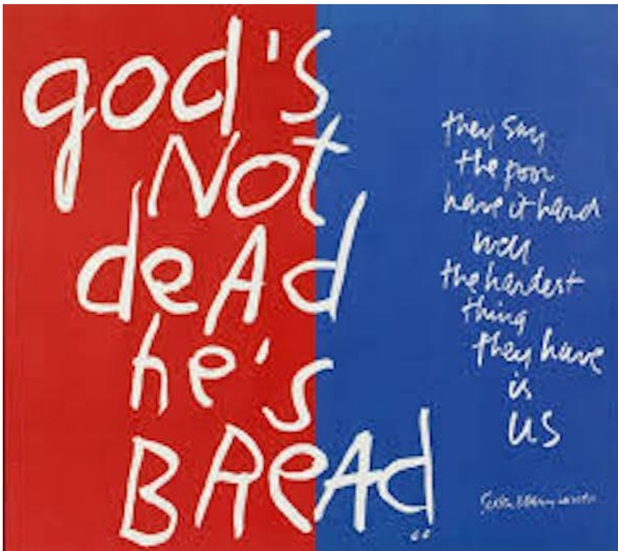
Corita Kent, Gods not dead .

Due gruppi di studiosi attualmente si contrappongono: da un lato stanno i pochi religionist , «convinti che la religione non abbia mai smesso di accompagnare l'arte moderna e che quest'ultima costituisca per molti versi uno degli ambiti in cui la religione può esprimersi»; dall'altro, quelli convinti che l'arte dal Modernismo (fine XIX e inizi XX secolo) in poi non possa assolutamente più essere religiosa, perché uno dei principi fondanti del movimento è che l'arte non sia un mezzo adatto a esprimere storie religiose. Certo esistono esempi di arte religiosa contemporanea. Elkins ne cita diversi, come la cappella di Matisse a Vence, la cappella di Cocteau a Villefranche-sur-Mer o quella di Rothko a Houston, tuttavia non spostano i termini della questione perché sono piuttosto «commissioni religiose affidate ad artisti laici».