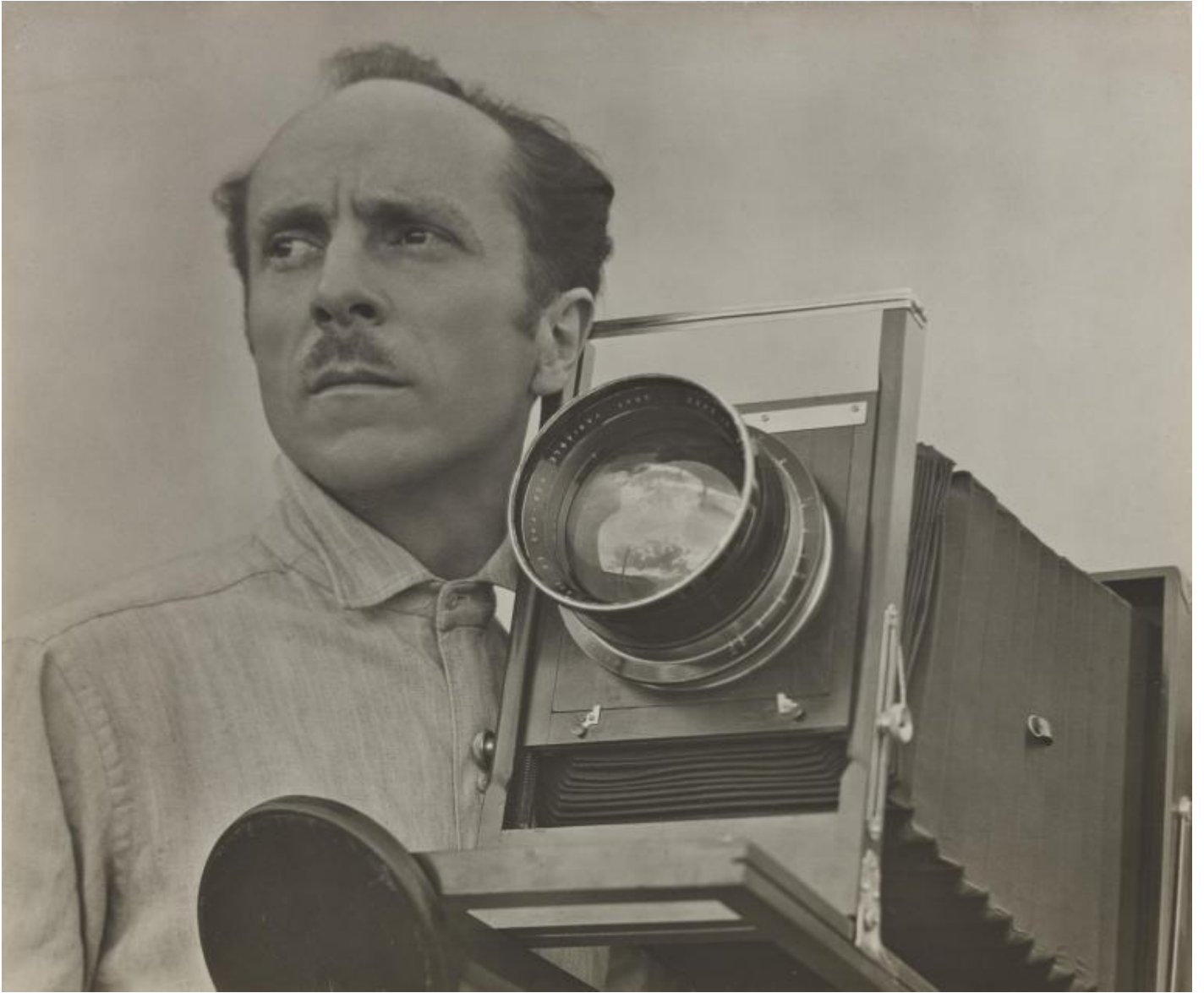
Opera di Tina Modotti.

Questo aspetto, più sottilmente, è rintracciabile in un altro esempio in mostra, ovvero nella “Vortografia di Ezra Pound” di Alvin Langdon Coburn del 1916–17: il vorticismo, movimento poetico fondato in quegli stessi anni da Ezra Pound (ideatore prima ancora dell’imagismo, che già preannunciava il mescolarsi dei campi della cultura e della percezione), viene in quest’opera tradotto in immagine, creando una connessione semantica tra letteratura e fotografia.