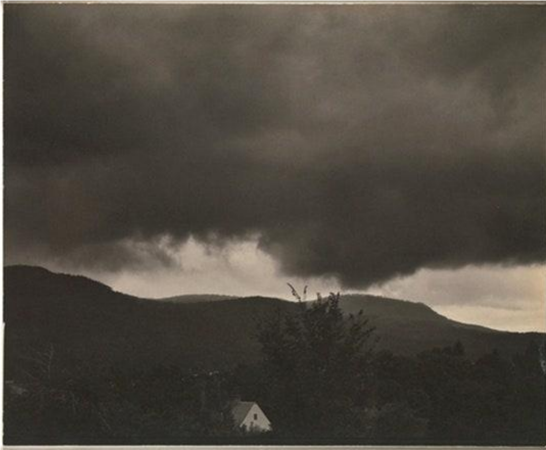
Opera di Alfred Stieglitz.

L'intero percorso si può definire come un insieme di intuizioni totalmente felici a cui tutta la fotografia e il cinema successivi, in un modo o nell'altro, sono tornati, e in cui la stessa primordiale sperimentazione tecnica ha portato dei tentativi di forma al gradino di risultati effettivi.