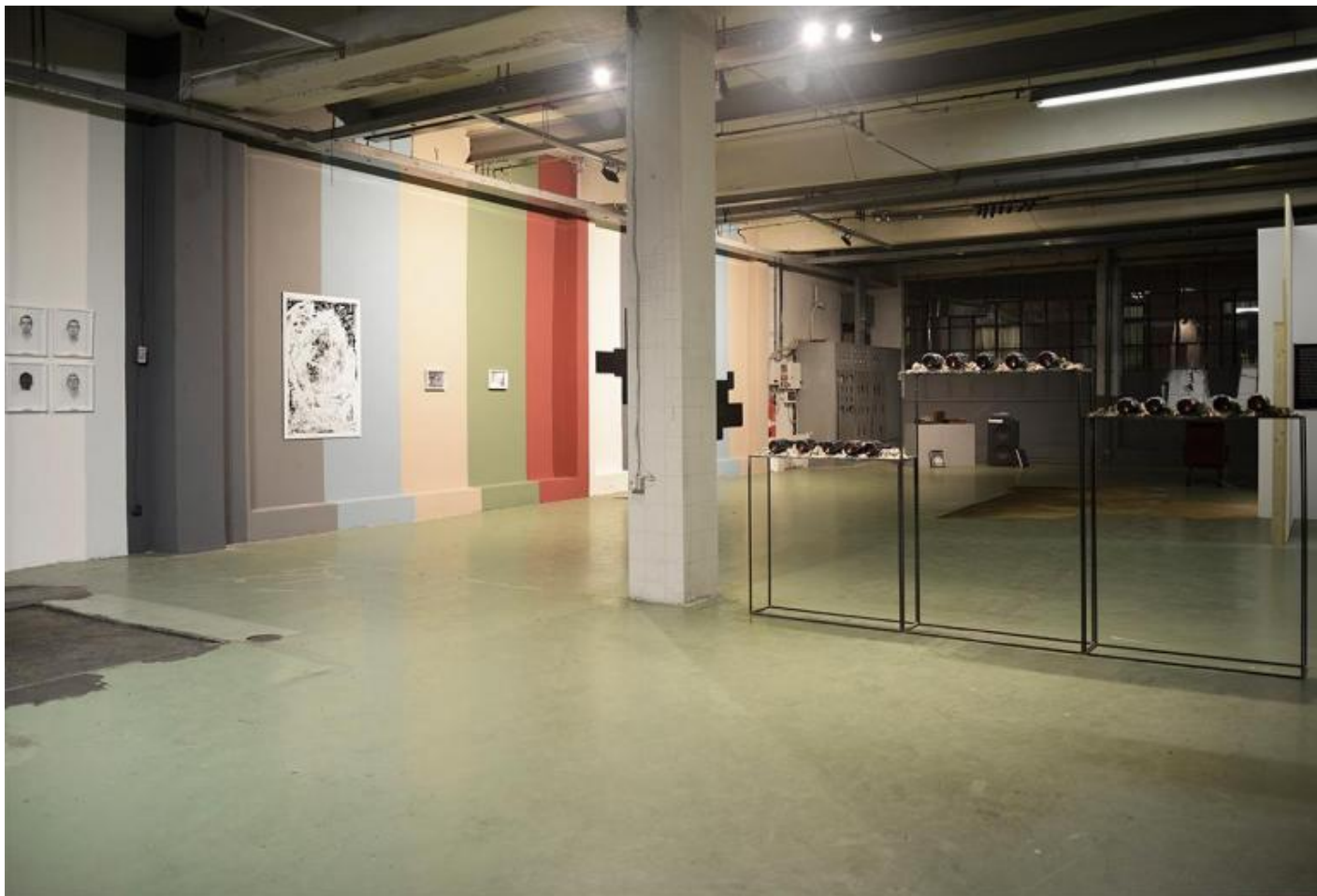
Veduta della mostra con Platone di esecuzione, 2019, podio in metallo, creta e bottiglie.

esecuzione. L'opera minaccia i visitatori, che devono sottoscrivere un'assunzione di responsabilità.