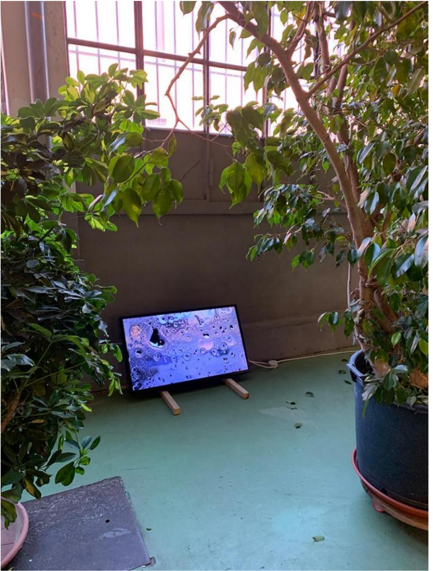
Gianluca Codeghini, One pose after the other, 2012, installazione video.