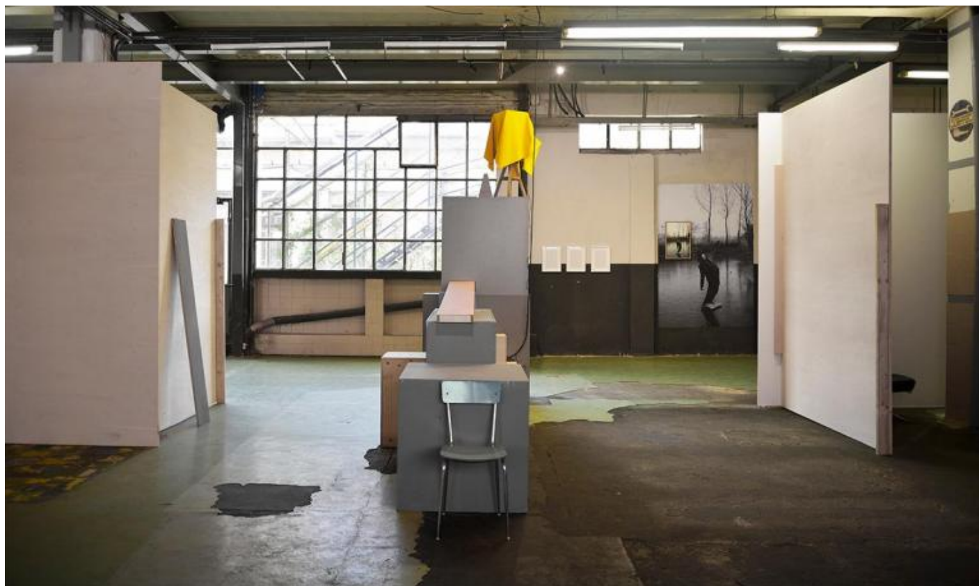
Veduta della mostra.

Ad Assab One (Milano, via Privata Assab 1) è in corso la mostra Il sorriso si ferma quando vuole (a cura di Elio Grazioli, fino al 19 Marzo) dedicata all'artista visivo, musicale e performativo Gianluca Codeghini. Installazioni audio, ceramiche, poster di grande formato, proiezioni video, interventi site-specific, neon, dipinti e sculture occupano più di 800 mq del piano terra dello spazio espositivo.