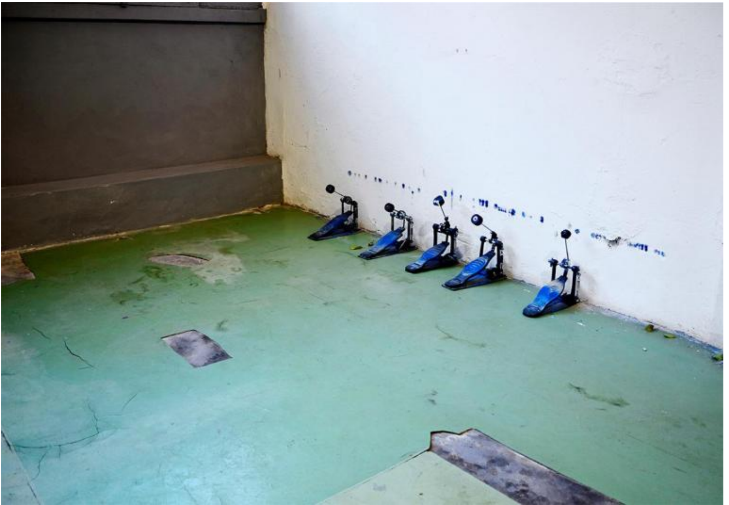
Gianluca Codeghini, Don't Stop Smiling, 2005/2019, cinque pedali da cassa con battente in feltro e inchiostro blu.

Codeghini sconcerata e depista. Lo “spiazzamento perpetuo” è il suo ideale.