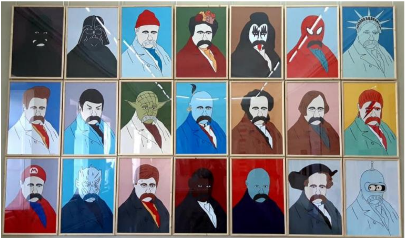
Ripensare l'eroe nazionale ucraino, Taras Shevchenko, Museo d'arte di Odessa, maggio 2019.

In particolare, l'Ucraina sembrava rientrare all'interno di un gruppo di Paesi (insieme a Moldova e Georgia) in cui il cambio delle autorità al vertice sembrava garantire ancora spazio per il confronto democratico e per elezioni libere (seppur legate alla strumentalizzazione di questioni identitarie da parte dei diversi gruppi di interesse, che erano lontane dalle riforme politiche ed economiche necessarie alla vita del Paese). Invece, in altre realtà dove il ripristino della 'controllabilità elementare del potere' era stato reso possibile dalla stabilità al vertice della medesima élite politica (come la Russia, l'Azerbaijan, la Bielorussia e le repubbliche centro-asiatiche), le istituzioni democratiche hanno gradualmente vissuto un processo di significativo svuotamento. Non a caso, solo nel primo gruppo di Paesi – e, in particolar modo, in Ucraina – abbiamo vissuto 'cicli rivoluzionari' consistenti, che hanno visto la società civile intervenire nel tentativo di ristabilire uno spazio di 'rappresentatività politica' nelle istituzioni democratiche, seppur con scarsi risultati .