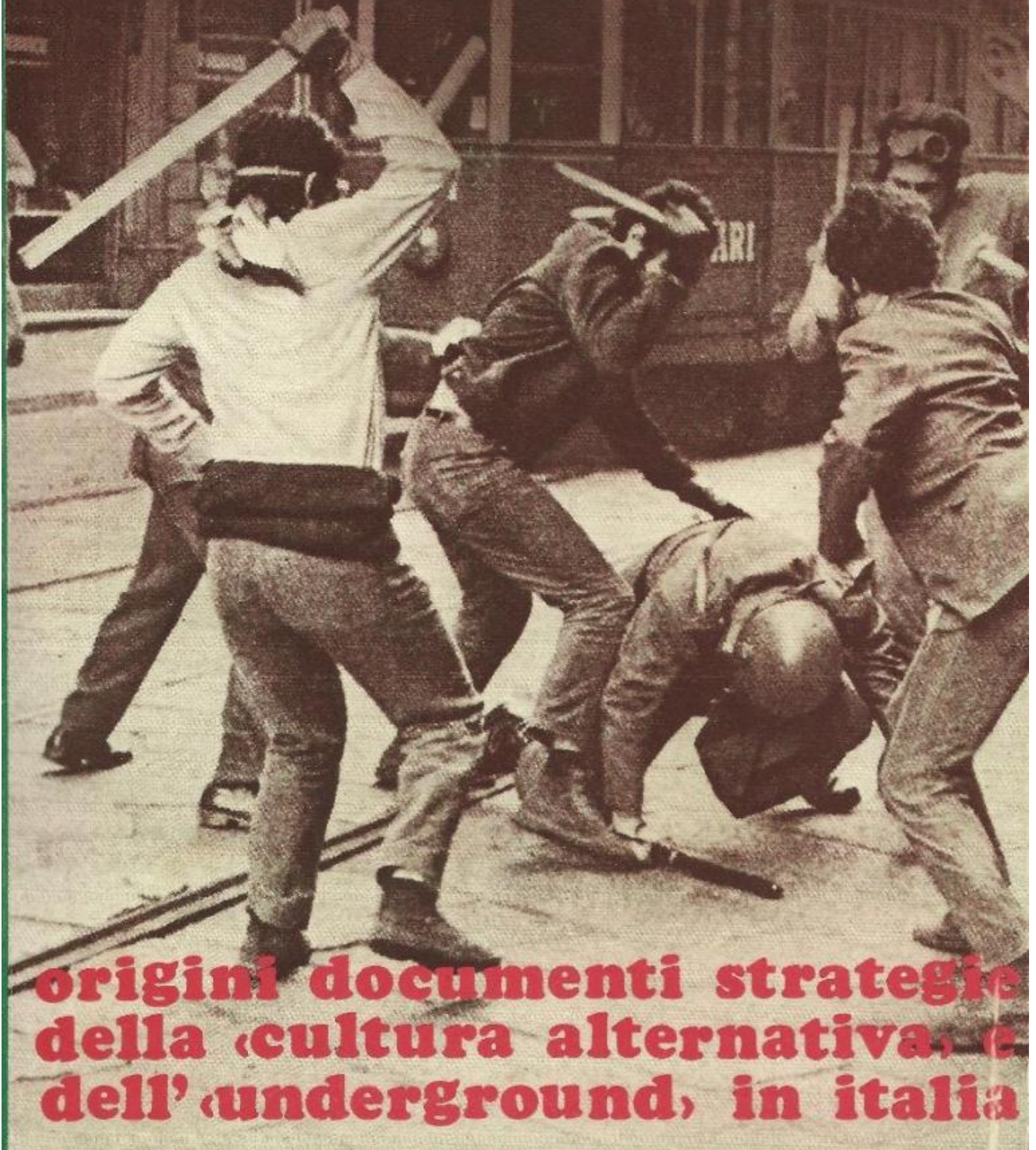
...ma l'amore mio non muore, Arcana Editrice, Roma 1971, copertina.