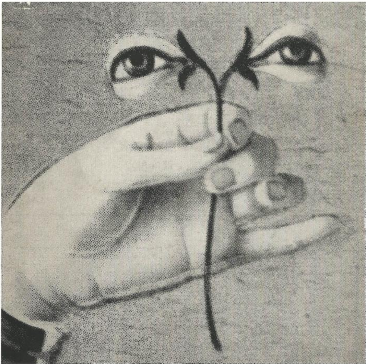
Bit, n. 1, marzo 1967, copertina.

arte oggi in Italia art: what's happening in Italy today marzo/march 1967 nr. 1