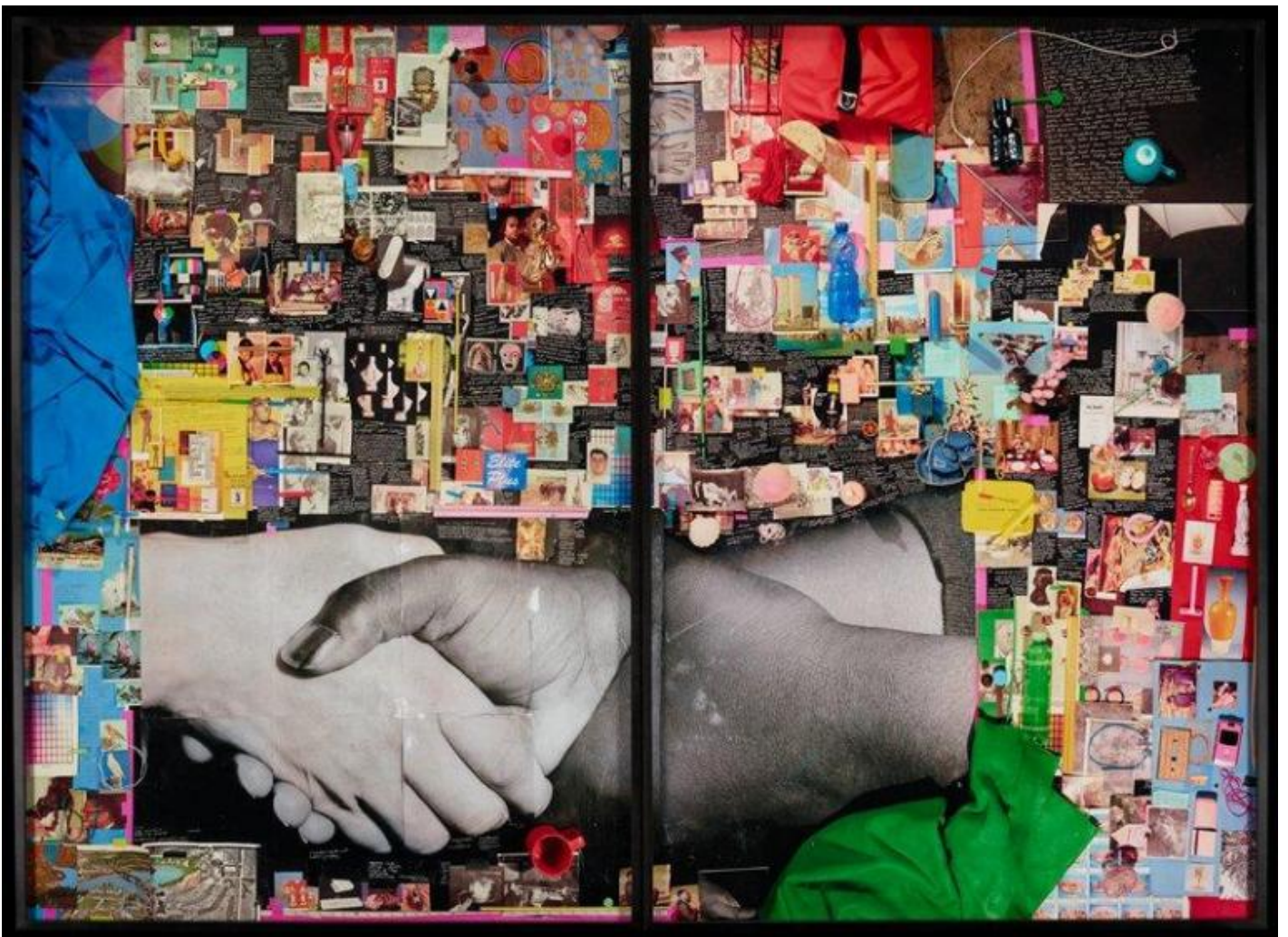
Sara Cwynar, Three hands, 2016, Digital c-print diptych.

Cerca di percorrere una linea sottile, tra cosa significa nostalgia e come funziona il design, e anche come percepiamo il futuro rispetto a come ripetiamo le stesse cose in forme leggermente diverse. C'è qualcosa di veramente contemporaneo in questo tipo di nostalgia?