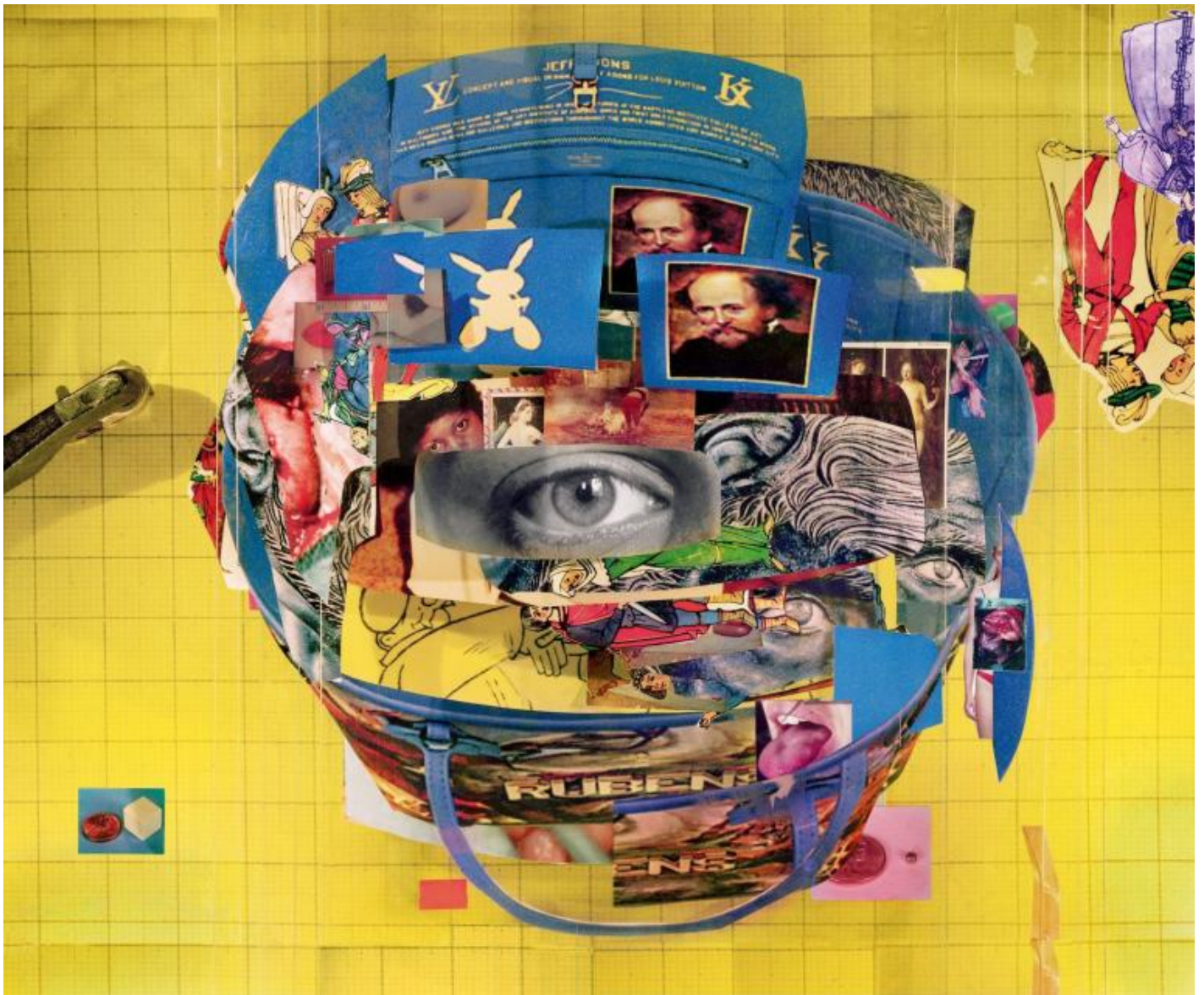
Sara Cwynar, Louis Vuitton, Jeff Koons, Rubens bag , 2020, from glass life aperture 2021.

Le mani tengono aperti i libri di storia. Kim Kardashian appare mentre si sente parlare di tulipani nell'Olanda del diciassettesimo secolo. Cwynar attacca una foto di scorta di un cobra alla parete del suo studio. La fotocamera ingrandisce i puntini di un giorno di una stampa vintage di una mela, un'illustrazione di Pinocchio e l'emoji sorridente del maiale. Un nuotatore si tuffa tra le immagini fluttuanti. Voci rassicuranti citano un saggio del 2011 sui social media: "Dobbiamo guardare noi stessi diventare noi stessi per essere noi stessi, ancora e ancora". In Glass Life , Cwynar fa in modo che lo spettatore abbia la sensazione di raggiungere gli oggetti visibili ma in realtà questi continuano a volare via. In forma di metafora, questi oggetti non sono necessariamente cose che vorremmo nella vita reale. Abbiamo l'impulso di continuare a raggiungere qualcosa e a guardare. Si tratta di un desiderio del desiderare, un desiderio senza oggetto, come direbbe Simone Weil. Le persone provano piacere nell'atto del trovare associazioni e mentre tentano di interpretare le questioni enigmatiche, così si ha la sensazione di sentirsi connessi con il mondo e di procedere con un certo ottimismo in un momento che potrebbe non necessariamente generare fiducia nel futuro.