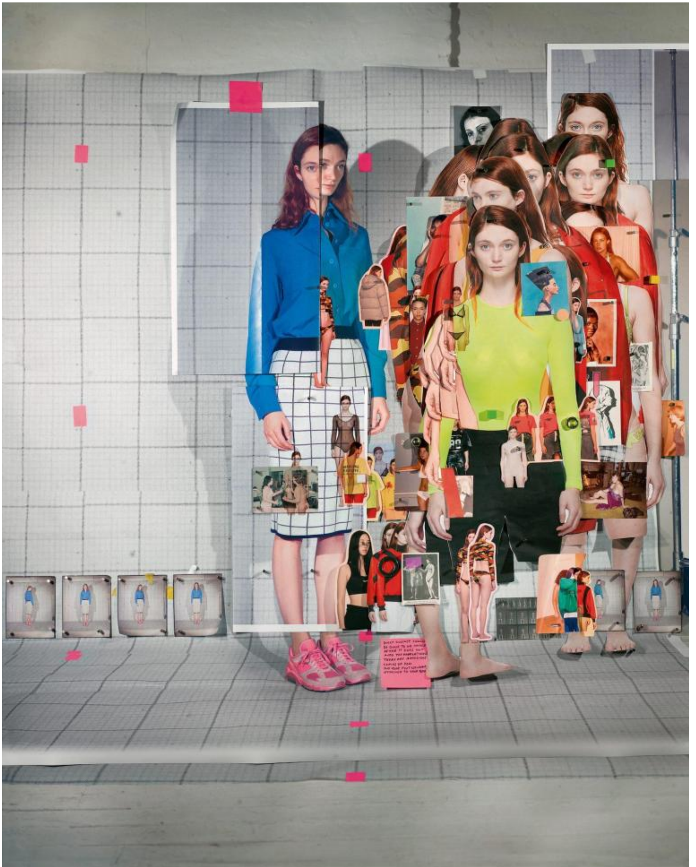
Sara Cwynar, 141 pictures of Sophie, 2019, from glass life aperture 2021.