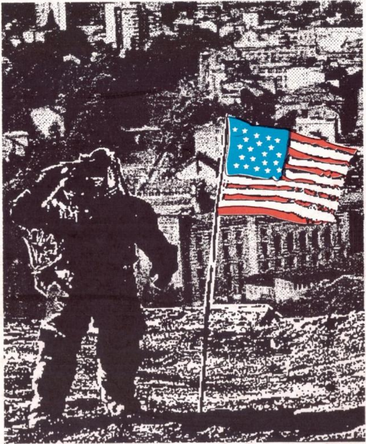
"Man on the Moon" - Design "Trio" - Sarajevo

"That's one small step for Sarajevo, but one giant leap for mankind..."