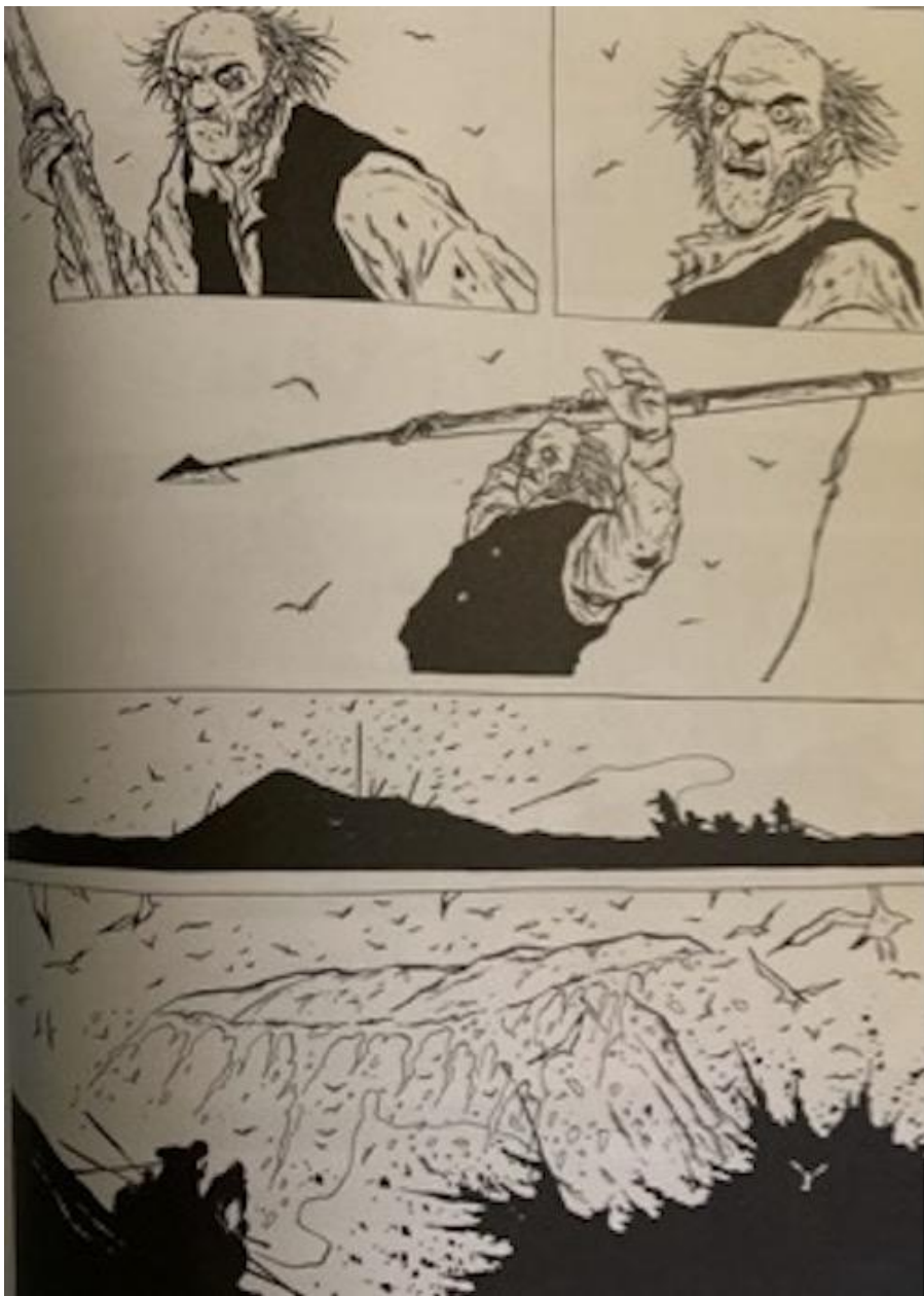
Moby Dick , Christophe Chabouté, 2017.

Se il narcisista sembra fare di tutto per allontanarsi dal dolore , il borderline pare invece cercarlo incessantemente, in un crescendo senza fine. I mondi interni ed esterni di questo carattere sono isole autonome infuocate, disorganizzate e inondate di collera. A differenza del dolore dello schizofrenico (che Bollas approfondisce in un bellissimo testo, Se il sole esplode. L'enigma della schizofrenia , Raffaello Cortina 2016), che cerca di oggettivarlo ed evitarlo, il borderline lo amplifica in un abbraccio mortale con l'ombra della vita. Il sogno e la vita si palleggiano l'angoscia (questa è la percezione del borderline ) confusi l'una con l'altro, dentro un corpo trascurato (poiché il corpo evoca le parole e viceversa) che fa da cassa di dissonanza incapace di accogliere quei contenuti debordanti. La destabilizzazione emotiva viene perseguita ovunque, soprattutto nelle relazioni selezionate con dovizia di riconoscimento: il border cerca border perché questo è l'unico linguaggio identitario che riconosce vicino e familiare, con il desiderio infinito di trovare l'oggetto d'amore e potersi fondere con esso. Ed è con questo desiderio di fusione che Bollas riprende il Moby Dick di Melville nella figura del capitano Achab, che egli considera la quintessenza del borderline .