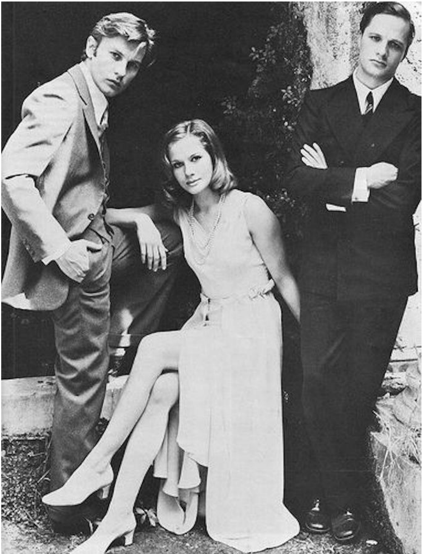
Dominique Sanda Capolicchio e H. Berger.