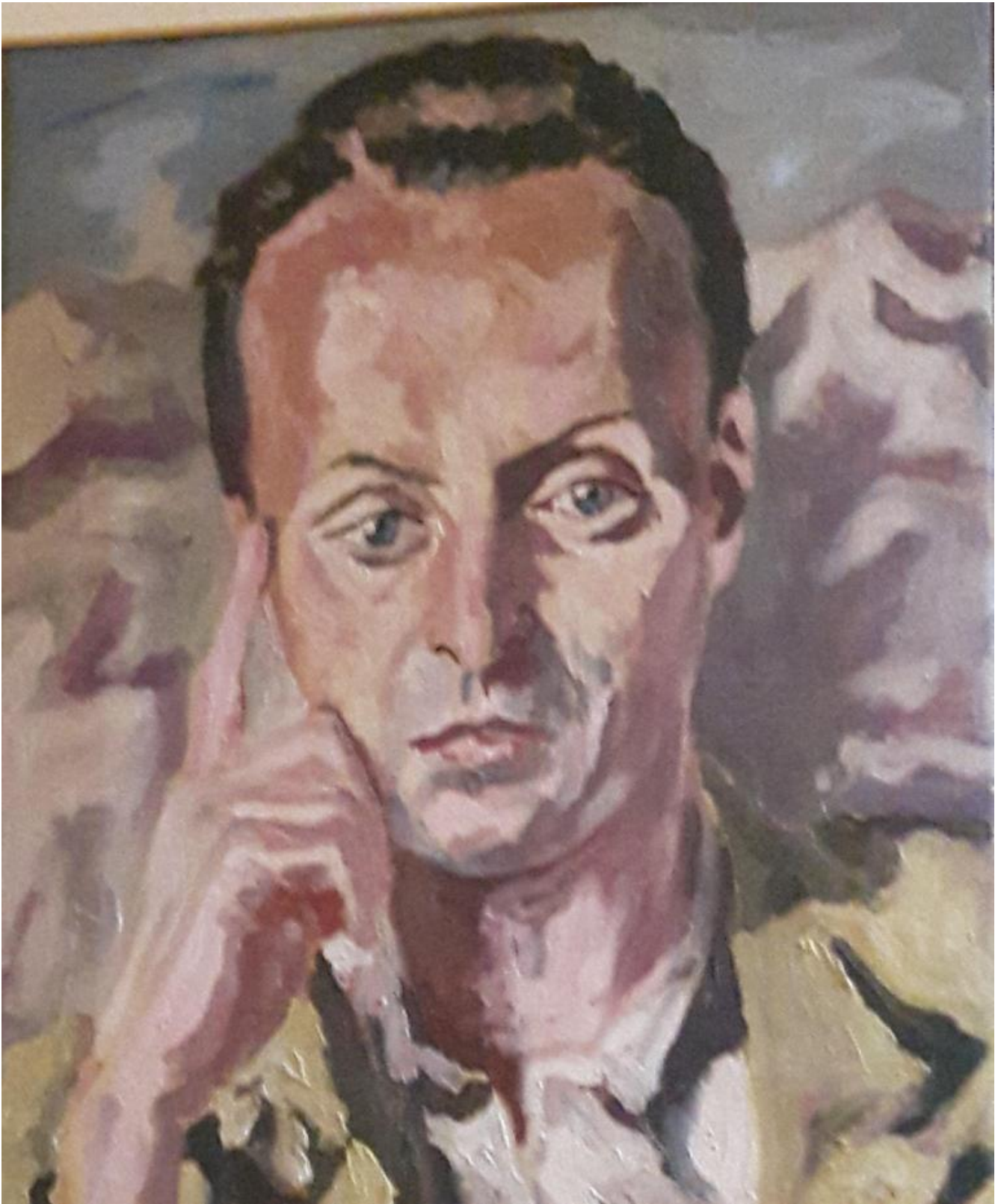
Carlo Levi, G. Bassani, centro studi bassaniani, Ferrara.