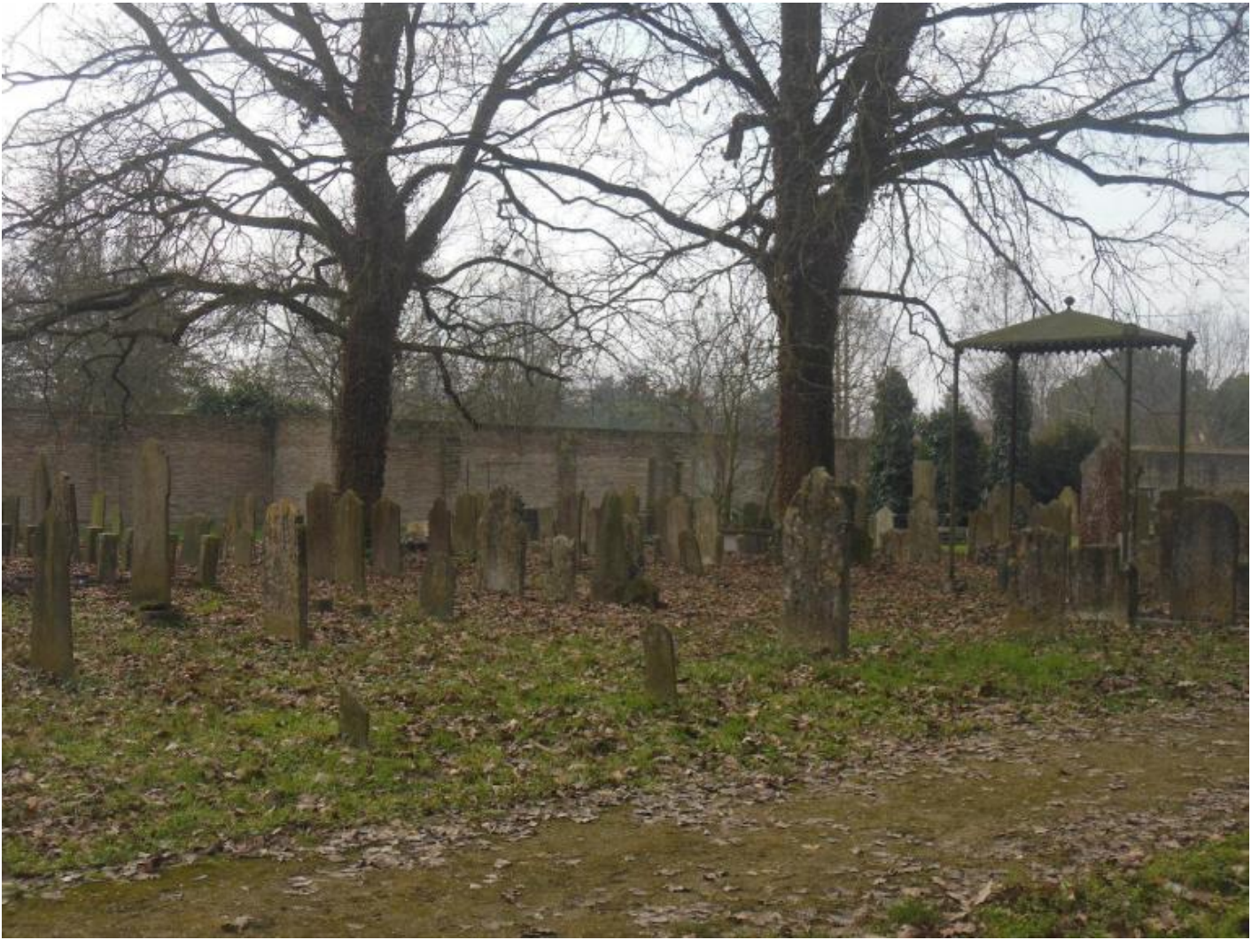
Cimitero ebraico, Ferrara, ph Anna Dolfi.

Al sole per altro è avvicinata assai spesso, come avviene alla protagonista dell'esergo che figura in testa a una delle liriche più famose della Bufera , La primavera hitleriana : "quella ch'a veder lo sol si gira", in un verso mediato da Dante che parla della fedeltà e dedizione di Clizia, la donna salvifica capace di proteggere dall'alto (come la Beatrice dantesca) e conservare intatto l'amore, per quanto mutato ("tu / che il non mutato amor mutata serbi"). Non è questo per altro l'unico riferimento montaliano che possiamo trovare, se si pensa ancora all'oro dei capelli di Micol, e alla luce ctonia e/o lunare che la circonda, tramata d'oro, che ricorda l'interno dove, lontana dal mondo e dalla tempesta che avanza, si rifugia Clizia nella lirica proemiale della Bufera . La stanza inaccessibile di Micol, la camera di cui vedremo solo mobili, libri e lattimi, assomiglia infatti al "nido notturno" del visiting angel , al rifugio di Irma/Clizia, la donna perdutoamente e inutilmente amata da Montale.