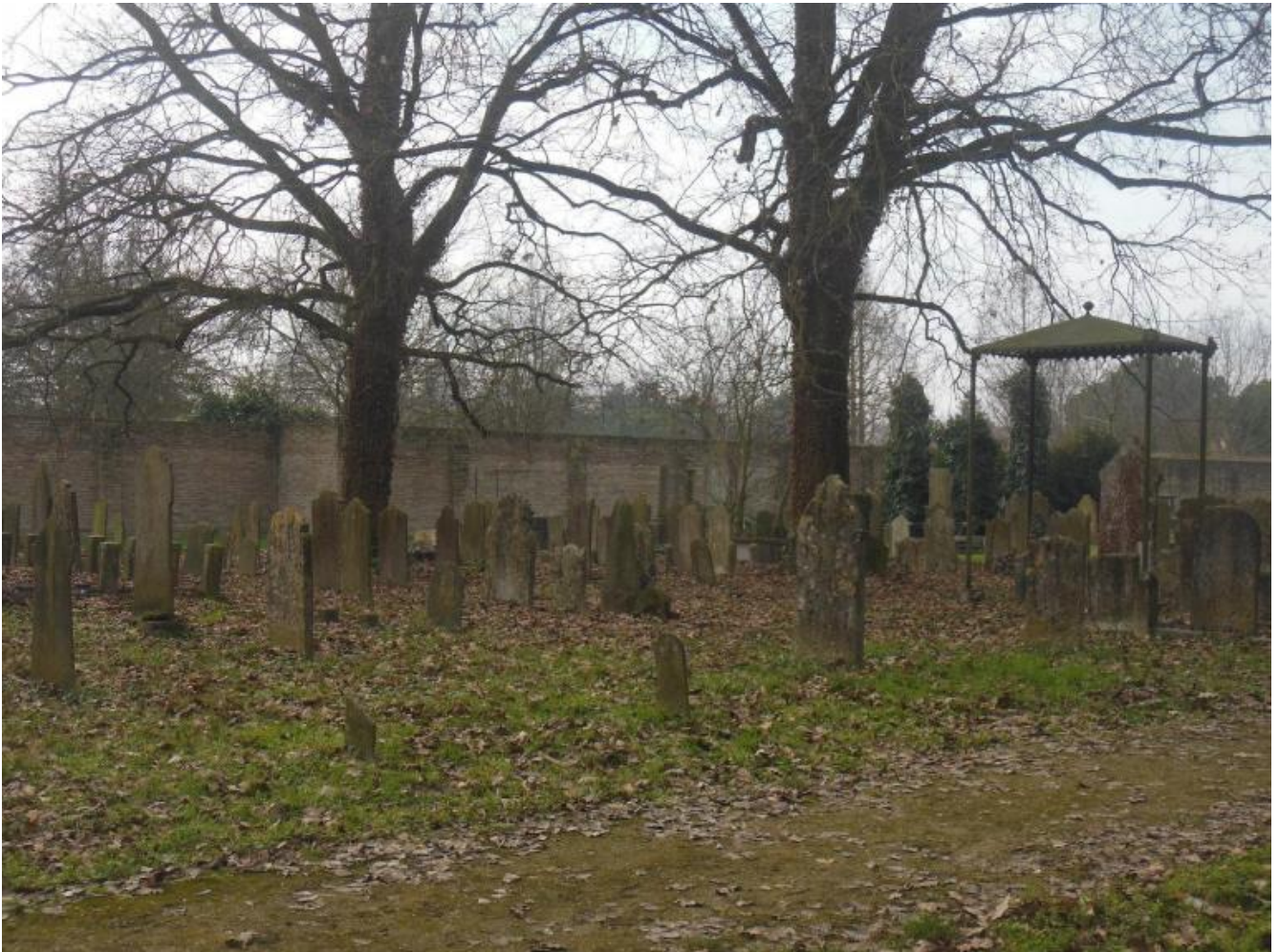
Cimitero ebraico, Ferrara, ph Anna Dolfi.

Al sole per altro è avvicinata assai spesso, come avviene alla protagonista dell'esergo che figura in testa a una delle liriche più famose della Bufera , La primavera hitleriana : "quella ch'a veder lo sol si gira", in un verso mediato da Dante che parla della fedeltà e dedizione di Clizia, la donna salvifica capace di proteggere dall'alto (come la Beatrice dantesca) e conservare intatto l'amore, per quanto mutato ("tu / che il non mutato amor mutata serbi"). Non è questo per altro l'unico riferimento montaliano che possiamo trovare, se si pensa ancora all'oro dei capelli di Micol, e alla luce ctonia e/o lunare che la circonda, tramata d'oro, che ricorda l'interno dove, lontana dal mondo e dalla tempesta che avanza, si rifugia Clizia nella lirica proemiale della Bufera . La stanza inaccessibile di Micol, la camera di cui vedremo solo mobili, libri e lattimi, assomiglia infatti al "nido notturno" del visiting angel , al rifugio di Irma/Clizia, la donna perdutamente e inutilmente amata da Montale.