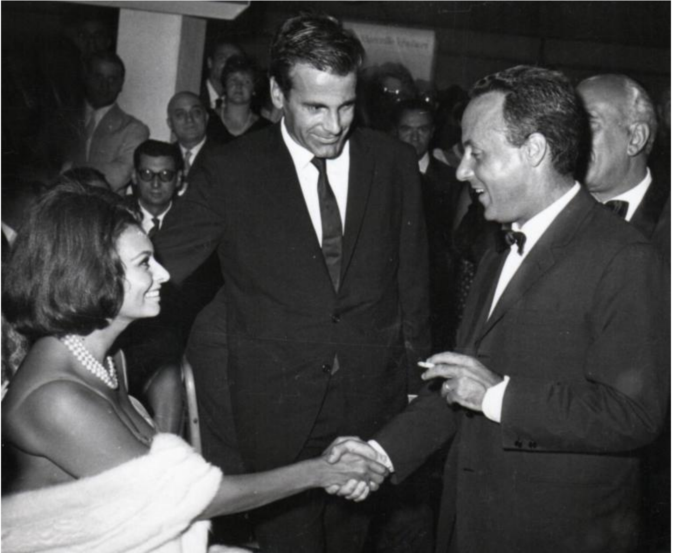
Bassani e Sofia Loren al premio Viareggio 1962.

edizione del libro, proprio come si fa con le persone realmente esistenti, anche se sapeva bene, e lo avrebbe ricordato più volte, che “Micol non è mai esistita, lo stesso giardino non esiste” (G. Bassani, Interviste 1955-1993 , Milano, Feltrinelli, 2019, p. 212).