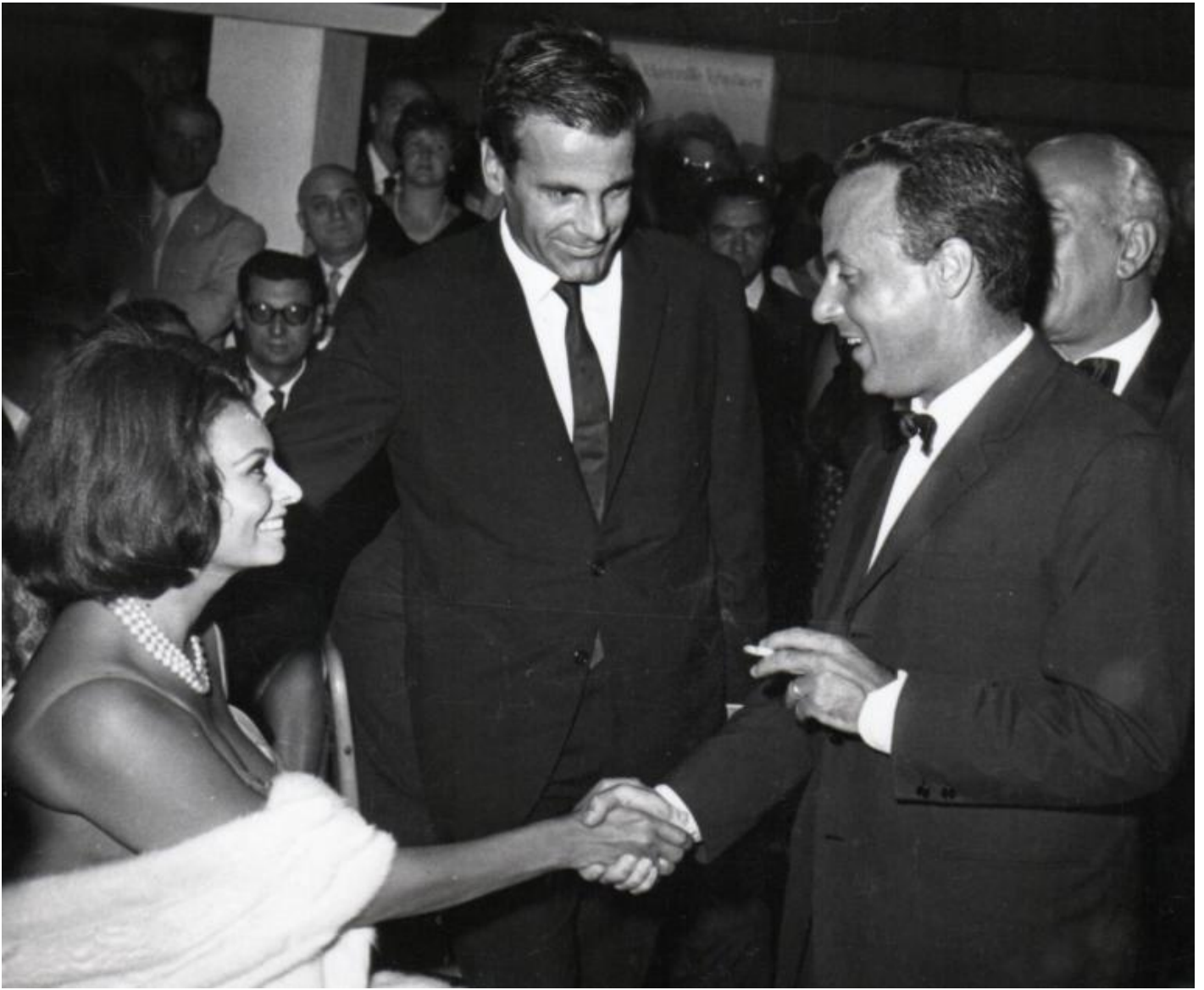
Bassani e Sofia Loren al premio Viareggio 1962.

Ma non basta: sottolineando a più riprese la natura essenzialmente lirica del romanzo, non avrebbe mancato di affiancarvi una lettura che portava fatalmente all'assoluta centralità del suo personaggio femminile, accentuandone il mito e la conseguente trasfigurazione. Si pensi, nella famosa intervista a Camon, l'affermazione " Micol è assolutamente diversa dagli altri " ( Interviste , p. 253) combinata con un severo giudizio sullo stesso mondo da cui proveniva destinato non a caso a un'inevitabile fine (si veda per questo la recente intervista a Guido Calabresi in occasione della prima a New York dell'opera lirica Il giardino dei Finzi-Contini ):