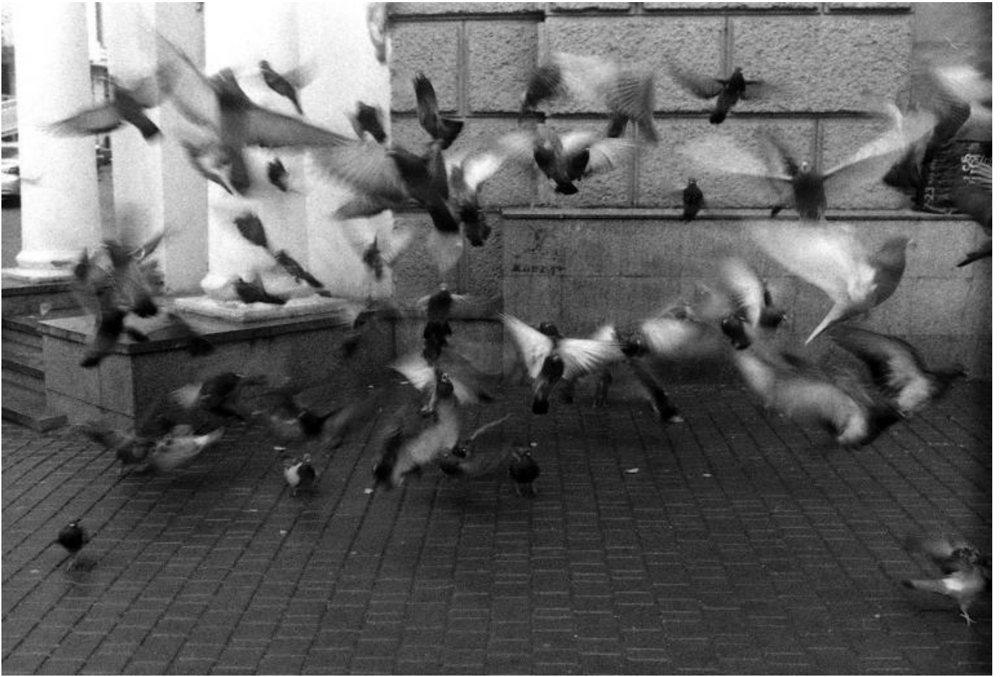
54° giorno dell'invasione, La danza dei piccioni.

Una delle scene più famose della storia del cinema è quella della strage sulla scalinata nel film La corazzata Potjomkin (1925) di Serghej Eisenstein. La pattuglia di cosacchi rastrella le scale sparando a bruciapelo sulla folla. Sono come un pettine che ripulisce e bonifica, il loro compito è sgomberare il manufatto architettonico dalle impurità. Le baionette sono perfettamente perpendicolari al taglio orizzontale degli scalini, e perfettamente a filo con la diagonale della discesa. La suadente geometria della guerra. I manifestanti si disperano, si aiutano, scappano. E poi c'è la scena della carrozzina. La madre è uccisa, e dopo una studiata esitazione, la carrozzina comincia a scivolare verso la morte, un piccolo cavallo di Troia nella coscienza dei soldati.