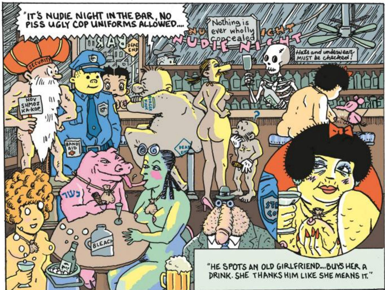
Una tavola da Street Cop .

Per disegnare i quartieri che si spostano, gli edifici “mobili” della città immaginata da Coover, il riferimento non poteva essere altro che le case dalle lunghe gambe inventate da Winsor McCay in uno dei sogni di Little Nemo in Slumberland . E poi c'è un'illustrazione in particolare dove, tra gli avventori di un bar della città vecchia, spuntano Betty Boop, la già citata Nancy (ma invecchiata), il gatto Ignatz dalla striscia Krazy Kat e un personaggio di The Squirrel Cage .