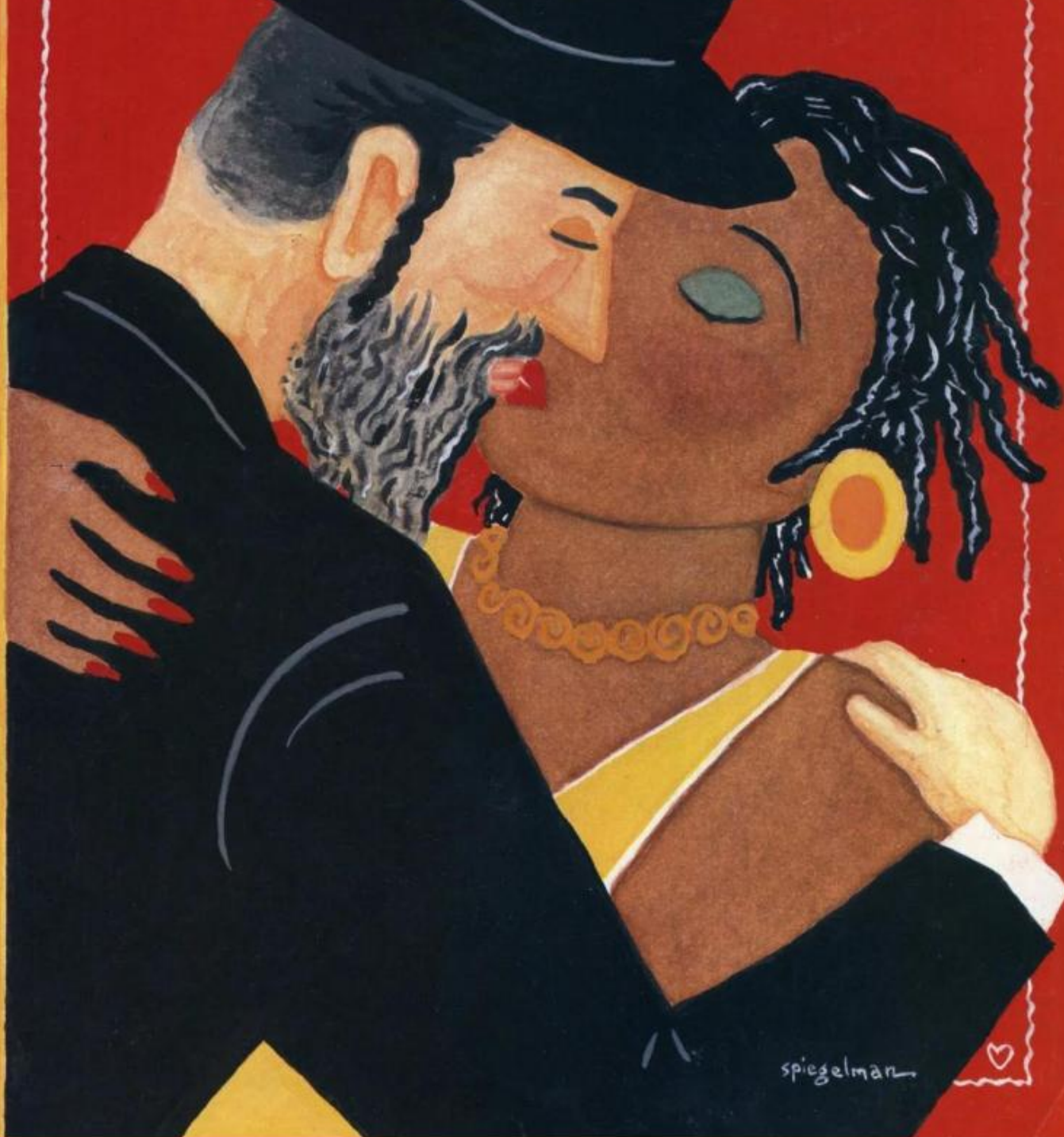
La prima copertina di Art Spiegelman per The New Yorker.