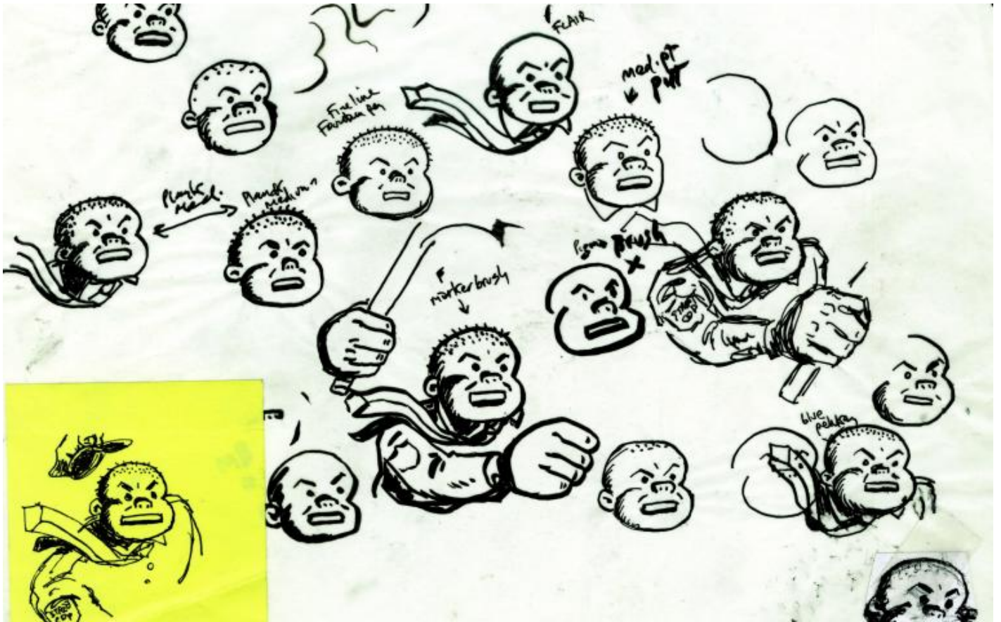
Una tavola da Street Cop Uncovered!

Nel catalogo Street Cop Uncovered! , c'erano le decine e decine di schizzi, prove e bozzetti da cui sono nate le illustrazioni per il libro. Questo è uno degli aspetti più interessanti del lavoro di Art Spiegelman: nonostante sia l'autore del graphic novel più famoso al mondo, l'iniziatore di un intero genere, il suo rapporto con il disegno rimane una lotta corpo a corpo. Lo aveva già scritto in Baci da New York , il bel volume pubblicato da Nuages che raccoglie e racconta il lavoro di Spiegelman per le copertine del settimanale The New Yorker : "Le mie insicurezze e la mia incapacità di disegnare di getto mi hanno sempre portato a fare una montagna di studi preliminari solo per mettere a fuoco un disegno". Non è detto che un disegnatore talentuoso sia anche un bravo fumettista, mentre capita spesso che un autore meno sicuro delle proprie doti artistiche si riveli uno splendido narratore per immagini. È il caso di Art Spiegelman, che però ha anche un'altra qualità: una profonda conoscenza dei meccanismi e della storia del fumetto, e in particolare delle strip americane.