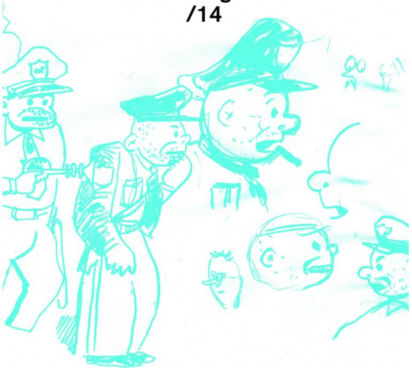
La copertina di Street Cop Uncovered!