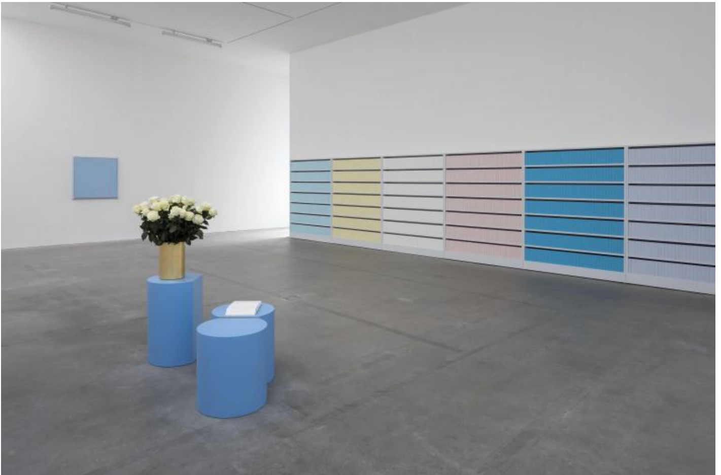
Exhibition view

La forza della ricerca dell'artista è evidente fin dalla prima sala della mostra, al piano terra della galleria, dove sono esposte due sole sculture: Colonna nel vuoto (2019) e Ellisse (2016), quest'ultima composta da un uovo bianco in marmo e da tre piccoli piedistalli bianchi a base rotonda ma tagliati verticalmente a ricavare una superficie rettangolare dipinta di un azzurro molto tenue. Entrambe le sculture sono di dimensioni molto più piccole rispetto al grande spazio in cui sono collocate, ma riescono a dominarlo totalmente, come se il loro colore diventasse architettura. È stato Germano Celant a sottolineare l'importanza della scelta dell'artista di specifiche forme e volumi: “Per condurre un discorso sull'apparizione della sostanza pittorica e sui suoi effetti di riverbero e di affioramento [...] Spalletti ha ridotto al massimo la presenza dei volumi, la cui formalizzazione, che dà corpo a una colonna o un parallelepipedo, una coppa o un bacile, dipende da uno sviluppo geometrico elementare, legato alle figure del quadrato e del triangolo, del cerchio e dell'ellisse”.