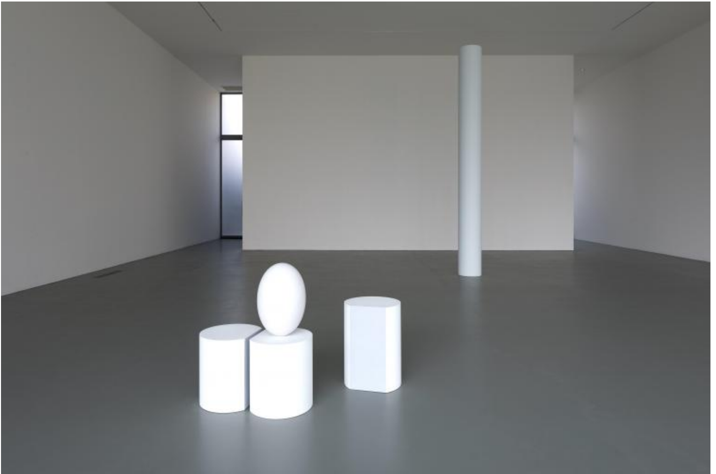
Exhibition view

La valenza concettuale del lavoro di Spalletti, tuttavia, non sta tanto nel processo tecnico con cui realizza le opere, quanto nell'importanza attribuita al colore e al rapporto del colore con la luce. Tant'è vero che sovente i titoli dei suoi lavori non sono altro che descrizioni del colore e della materia di cui sono costituite; si veda ad esempio Impasto di colore eco rosso-azzurro, tuttotondo, blu di Prussia .