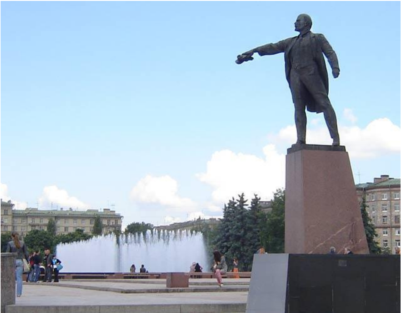
Moskovskij prospekt, statua Lenin.

Alcune decisioni invece si dimostrarono assurdamente salomoniche, come il mantenimento del nome di Leningradskaja oblast' e Sverdlovskaja oblast' per le regioni attorno a Pietroburgo e Ekaterinburg. Ma poi la decomunistizzazione alla russa si bloccò, perché all'entusiasmo seguirono i costi dei cambiamenti toponomastici e altri problemi, considerati ben più impellenti. Anche la rimozione delle statue, avviata in gran stile con la rimozione della statua di Feliks Dzeržinskij dalla omonima piazza alla Lubjanka il 22 agosto 1991 dopo il fallito golpe, si arrestò, lasciando gran parte dei monumenti al proprio posto. Con il recupero da parte di Vladimir Putin della storia imperiale e della reinterpretazione di alcuni momenti del periodo sovietico in chiave nazional-conservatrice, l'approccio verso l'ingombrante lascito statuuario e monumentale è stato diversificato.