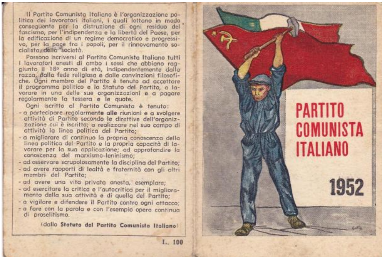
La tessera del PCI del 1952

(Ignazio Silone, Una manciata di more , Mondadori, Milano 1975, pp. 37-39)