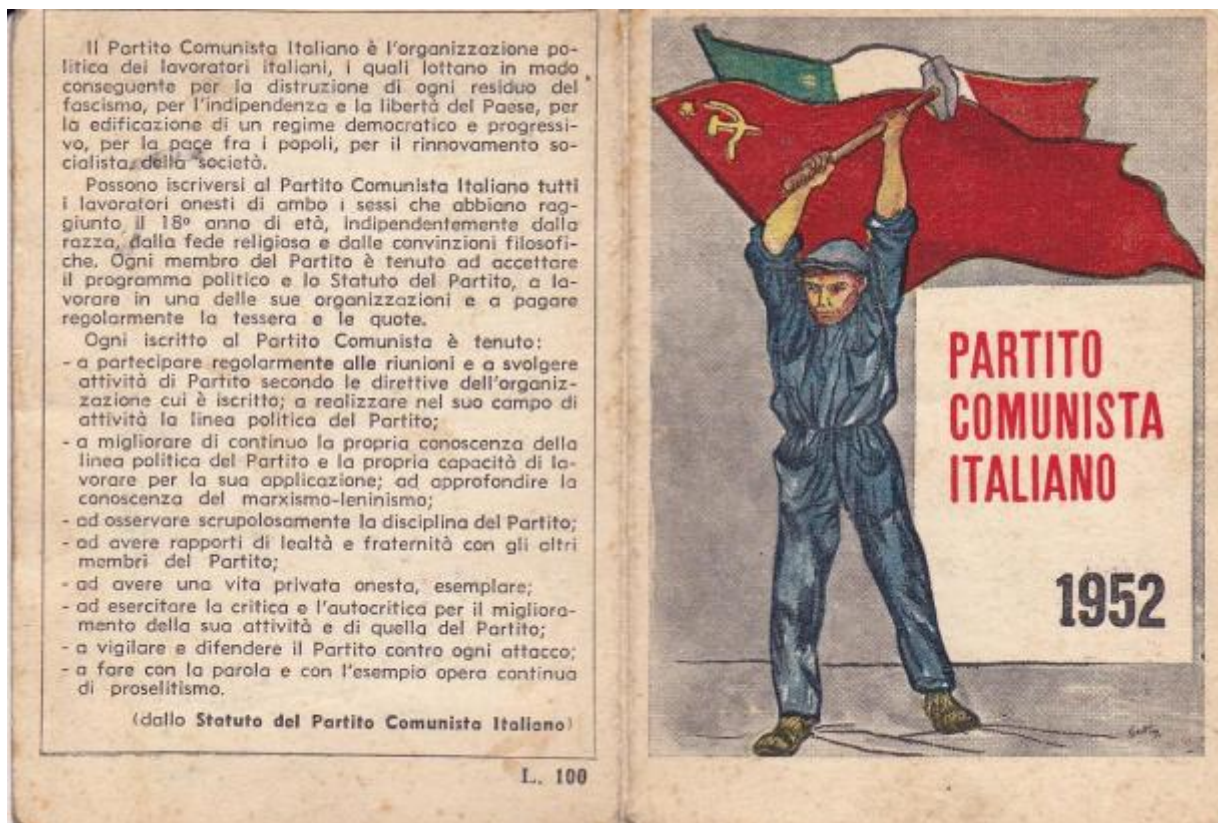
La tessera del PCI del 1952