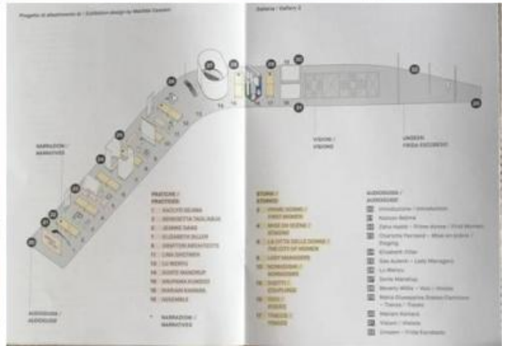
Buone Nuove. Donne in architettura. Alcune vedute della mostra visitabile al MAXXI e schema dell'allestimento.

Organizzare mostre di Architettura destinate al grande pubblico è compito arduo. Infatti, il più delle volte, esse risultano criptiche ai non addetti ai lavori, a meno che non siano allestite in modo coinvolgente, capace cioè di toccare anche le corde dell'emozione, magari con molti disegni, con maquettes, fotografie, video, etc. Ed è esattamente ciò che è accaduto, proprio al MAXXI, con la grande mostra di Aldo Rossi, e, in Triennale con quella di Carlo Aymonino, tenutesi entrambe nel 2021: due esposizioni di elevato rigore scientifico ma anche ricche di pathos che hanno fatto registrare un notevole successo di critica e di pubblico.