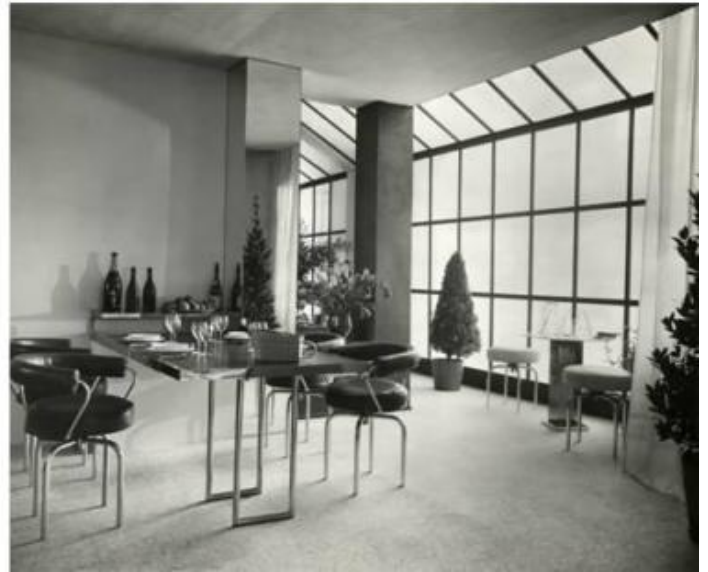
A sinistra, in alto: Eileen Gray, E1027, Roquebrune, Cap-Martin, 1926-1930. In basso: Lina Bo Bardi, MASP, São Paulo, 1957-69. A destra, in alto: Mies van der Rohe e Lilly Reich, Tugendhat house, Brno, 1930. In basso: Charlotte Perriand, sala da pranzo della casa-studio di Place Saint Sulpice, Parigi, 1927.