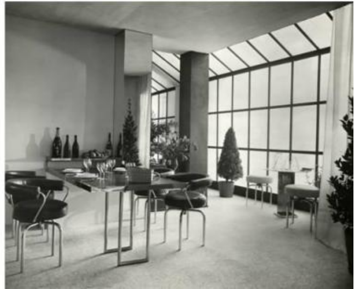
A sinistra, in alto: Eileen Gray, E1027, Roquebrune, Cap-Martin, 1926-1930. In basso: Lina Bo Bardi, MASP, São Paulo, 1957-69. A destra, in alto: Mies van der Rohe e Lilly Reich, Tugendhat house, Brno, 1930. In basso: Charlotte Perriand, sala da pranzo della casa-studio di Place Saint Sulpice, Parigi, 1927.