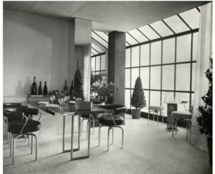
A sinistra, in alto: Eileen Gray, E1027, Roquebrune, Cap-Martin, 1926-1930. In basso: Lina Bo Bardi, MASP, São Paulo, 1957-69. A destra, in alto: Mies van der Rohe e Lilly Reich, Tugendhat house, Brno, 1930. In basso: Charlotte Perriand, sala da pranzo della casa-studio di Place Saint Sulpice, Parigi, 1927.