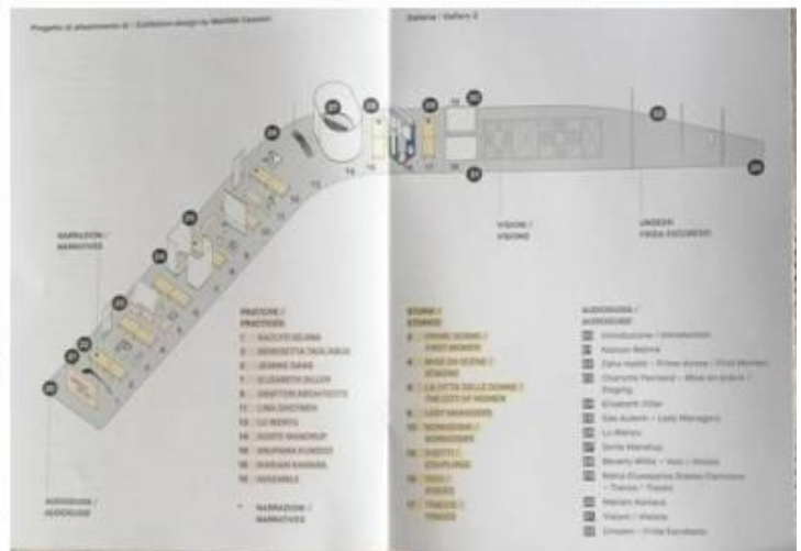
Buone Nuove. Donne in architettura. Alcune vedute della mostra visitabile al MAXXI e schema dell'allestimento.

Organizzare mostre di Architettura destinate al grande pubblico è compito arduo. Infatti, il più delle volte, esse risultano criptiche ai non addetti ai lavori, a meno che non siano allestite in modo coinvolgente, capace cioè di toccare anche le corde dell'emozione, magari con molti disegni, con maquettes, fotografie, video, etc. Ed è esattamente ciò che è accaduto, proprio al MAXXI, con la grande mostra di Aldo Rossi, e, in Triennale con quella di Carlo Aymonino, tenutesi entrambe nel 2021: due esposizioni di elevato rigore scientifico ma anche ricche di pathos che hanno fatto registrare un notevole successo di critica e di pubblico.