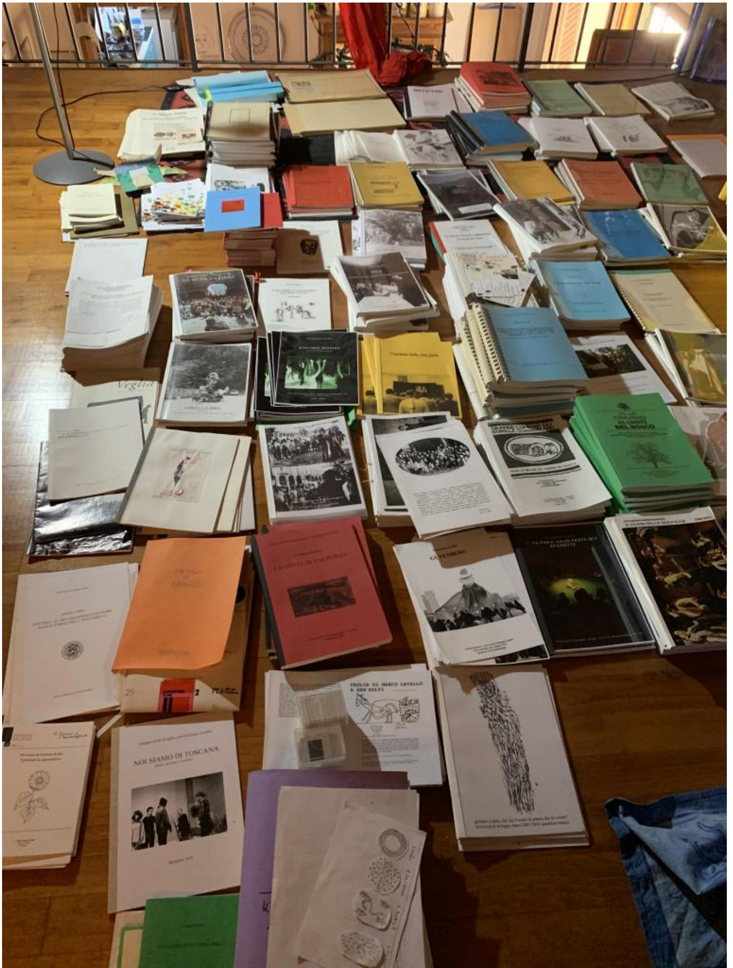
I Quaderni di Drammaturgia, che raccontano gli anni dell'Università.