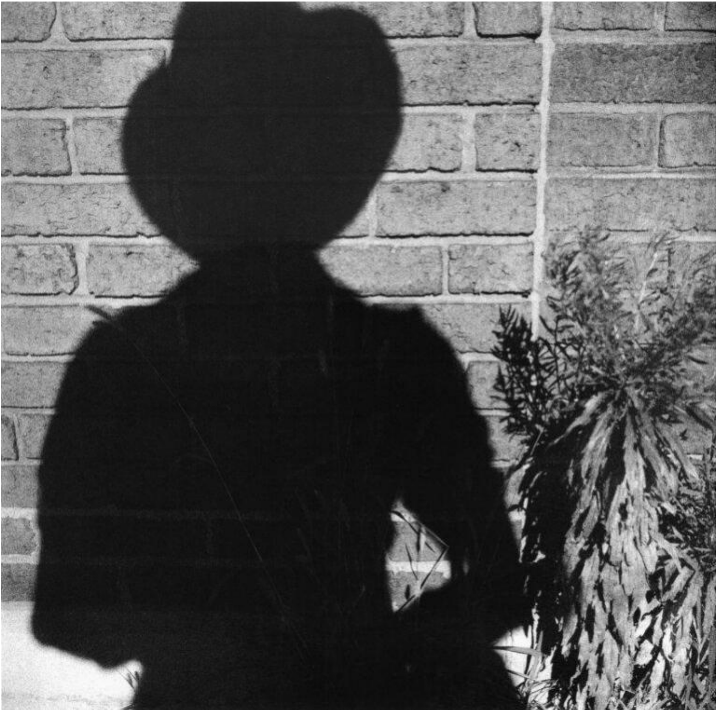
Autoritratto, 1962, Estate of Vivian Maier, courtesy of Maloof Collection and Howard Greenberg Gallery, NY.

In una poetica maturamente sintetica, che vede sì una moltitudine di scatti, ma unificati sotto pochi e correlati filoni, proprio l'astrazione è un secondo modo di vedere che la Maier sa far convivere perfettamente col proprio sguardo lucido sulla realtà umana: nelle sezioni "Gesti" e "Forme", dettagli di scenari in cui si muoveva diventano vere composizioni informali dei segni che l'uomo lascia – riflessi, pozzanghere, tende, oggetti lasciati per strada o buttati nella spazzatura. Ogni lascito umano è per la Maier fonte inesauribile a cui attingere per addentrarsi con cautela nel mondo, cercando di capire qualcosa da cui si è sempre tenuta lontana, in una solitudine calmierata soltanto dalla sua professione.