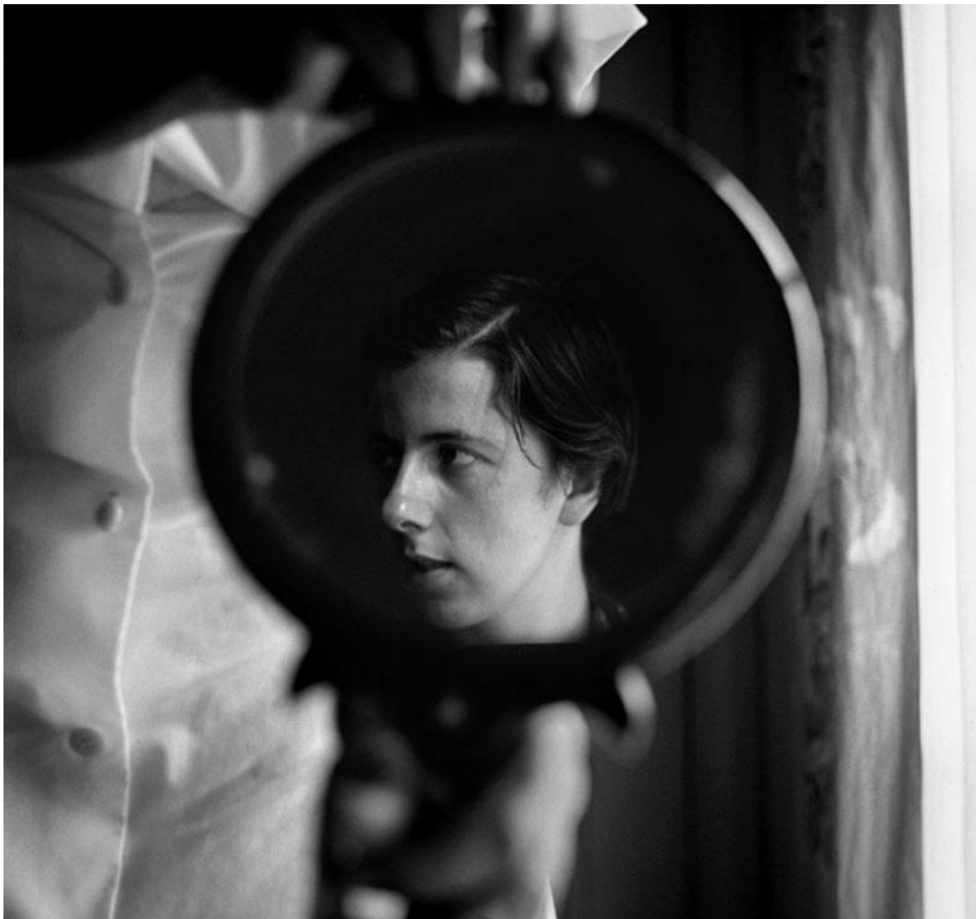
Autoritratto, 1962, Estate of Vivian Maier, courtesy of Maloof Collection and Howard Greenberg Gallery, NY.

dall'uomo come necessaria. Così facendo, oltre al suo sguardo rimasto precluso agli altri, l'unica tesoriera di quel mondo visto, l'unico archivio di quelle immagini impresse, è stata la sua stessa memoria. Gli occhi per un momento, la memoria per quanto tempo possibile. Questa interruzione del meccanismo che vede l'attenzione posta solo sulla prima fase del processo, ovvero quella della raccolta di informazioni e suggestioni, è il fatto tanto curioso, il punto di rottura che rende impossibile qualsiasi immedesimazione e che per questo suscita tanta attrattiva.