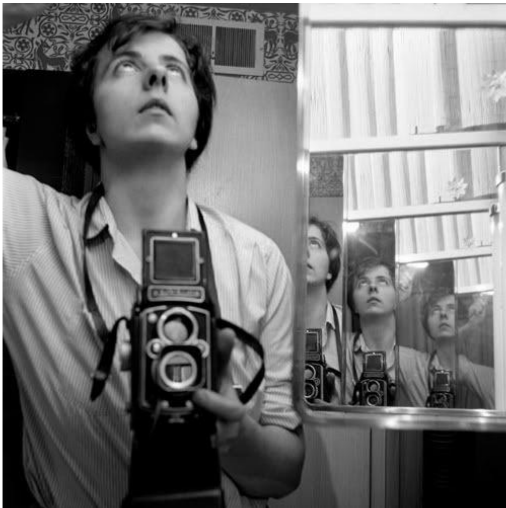
Autoritratto, 1962, Estate of Vivian Maier, courtesy of Maloof Collection and Howard Greenberg Gallery, NY.

Entrando, ci si affaccia nella prima sala dedicata agli autoritratti. Filone tanto importante nella ricerca di Vivian Maier quanto quello di reportage urbano, ci permette di prendere – o riprendere – confidenza con gli occhi che avrebbero dato vita ad alcune delle immagini più iconiche del secondo Novecento.