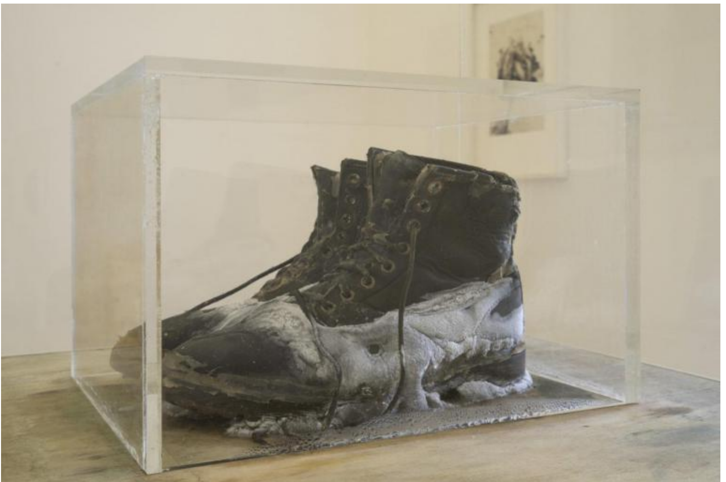
Lawrence Carroll, Untitled, 2006.

Eppure, l'eterogenea produzione di Carroll non si limita affatto alla sola ed enigmatica rappresentazione dell'empietà: le opere dell'artista, al contrario, mostrano tratti spesso antitetici rispetto alla dilagante inquietezza delle quattro copertine realizzate per gli Slayer – Reign in Blood (1986), South of Heaven (1988), Season in the Abyss (1990) e Christ Illusion (2006). Dalla seconda metà degli anni Ottanta, infatti, Carroll decide di abbandonare progressivamente il proprio lavoro come grafico e illustratore per dedicarsi alla realizzazione di opere incentrate sul mezzo pittorico. L'assordante afflizione delle illustrazioni cede il passo al silenzio delle tele, all'assenza figurativa, mentre l'ocra, il giallo e l'avorio hanno la meglio sull'esasperazione policroma. Tuttavia, si tratta di un candore incerto, diafano, irresoluto, e forse proprio per questo tangibile. Assistiamo alla contraddizione del concetto apparentemente univoco di monocromia, come se il tempo lasciasse un segno del proprio passaggio, annullando ogni presunta differenza tra colore e materia, tra rappresentazione e realtà, tra Immagine e tatto. La pittura diviene corpo.