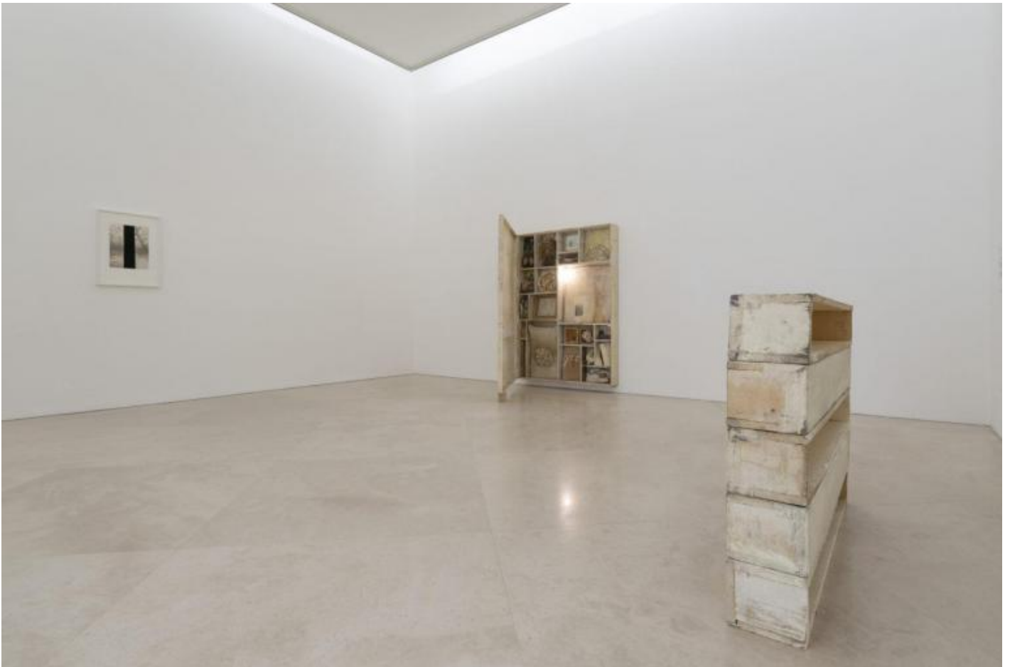
Lawrence Carroll, Madre, Veduta della mostra.

L'esordio nell'arte contemporanea avviene alla metà degli anni Ottanta, proprio in concomitanza con la realizzazione della copertina di Reign in Blood degli Slayer, introducendo la tridimensionalità oggettuale degli scarti all'interno del proprio operato. La prima personale dell'artista si tiene alla Stux Gallery di New York (1988), tuttavia l'affermazione internazionale coincide con la partecipazione alla collettiva Einleuchten , curata dallo svizzero Harald Szeemann presso la Deichtorhallena di Amburgo (1989), a fianco di Joseph Beuys, Bruce Nauman e Robert Ryman, per poi consolidarsi in occasione della nona edizione di documenta a Kassel, curata dal belga Jan Hoet (1992).