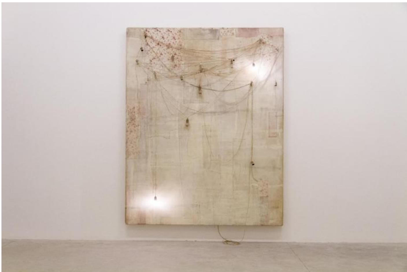
Lawrence Carroll, Untitled, 2013.

“Credo che l’arte (almeno per me) stia nel mezzo delle cose. “Nel mezzo” è una grande parte del mio modo di pensare e procedere, sia psicologicamente che fisicamente.”