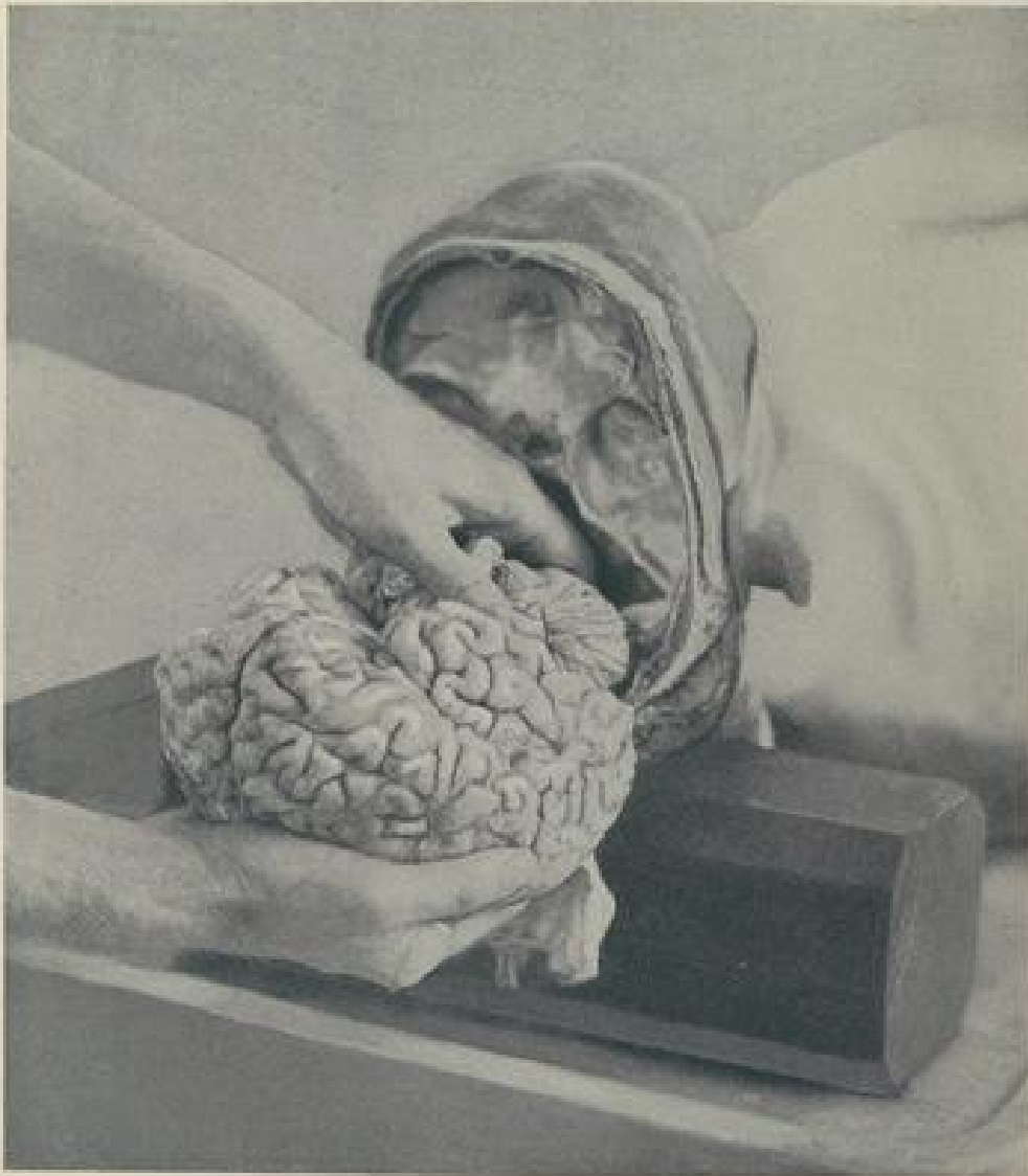
FIG. 131.—Method of removing the brain after it is severed from the body.

Tra le mirabilia esposte non mancano fettine del cervello di Einstein (conservate malgrado la sua volontà di essere cremato integro), nonché di criminali che hanno eccitato l'opinione pubblica inglese all'inizio del secolo scorso, crani riportanti tracce di trapanazione e strumenti antichi e moderni per realizzare questa operazione in uso dall'età del bronzo fino alla prima guerra mondiale (una nota ci informa che alle volte alcuni pazienti affetti da un'eccessiva pressione sanguigna nel cervello ottenevano un parziale sollievo dall'operazione).