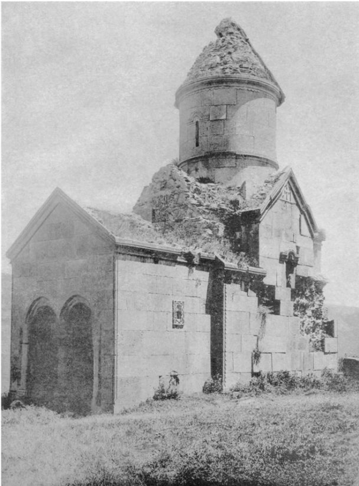
Claudio Gobbi, Kecharis, Armenia, XI secolo

GDF - Voglio tornare sul tema dei diversi approcci generazionali, ma ora insisto su questa idea di un linguaggio obsoleto e impotente sul piano della comunicazione.