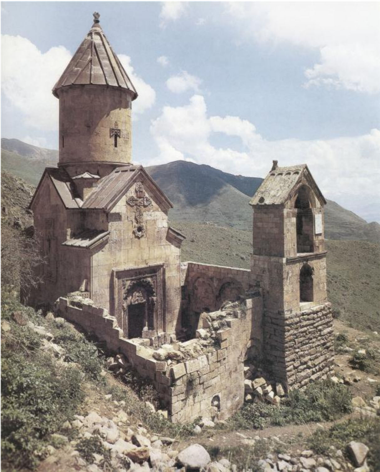
Claudio Gobbi, Spitakavor, Armenia, XIII secolo

GDF - Vuoi spiegarmi meglio in che senso parli di "confine"? Perché questo termine può indicare allo stesso tempo separazione e contatto, distanza e incontro, e a me sembra che in tutto ciò il ruolo della fotografia (l'uso che se ne fa) sia determinante.