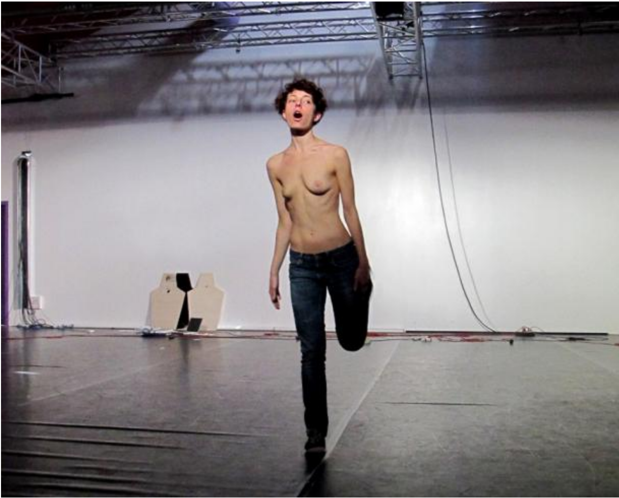
Kinkaleri, Fake For Gun No You

L'attore è il fantasma: uno spettro che spesso si manifesta, torna, ingombra. Tra i premiati dalla rivista "Lo straniero" c'era anche Carlo Cecchi. Apparso, sorridente sotto una paglietta e occhiali scuri, poi subito svanito, senza recitare, senza neanche un incontro pubblico, a raccontare il suo straordinario teatro d'invenzione e negazione di personaggi. Perché l'attore, come la realtà, non è un essere vivente, o un intreccio di casi. È un dubbio insinuato nei giorni, nelle cose, nelle storie. Un crinale, un problema. Un vapore, una necessità fatta carne che subito si nega nella sua natura bifronte, umana e astratta, quotidiana e diabolica.