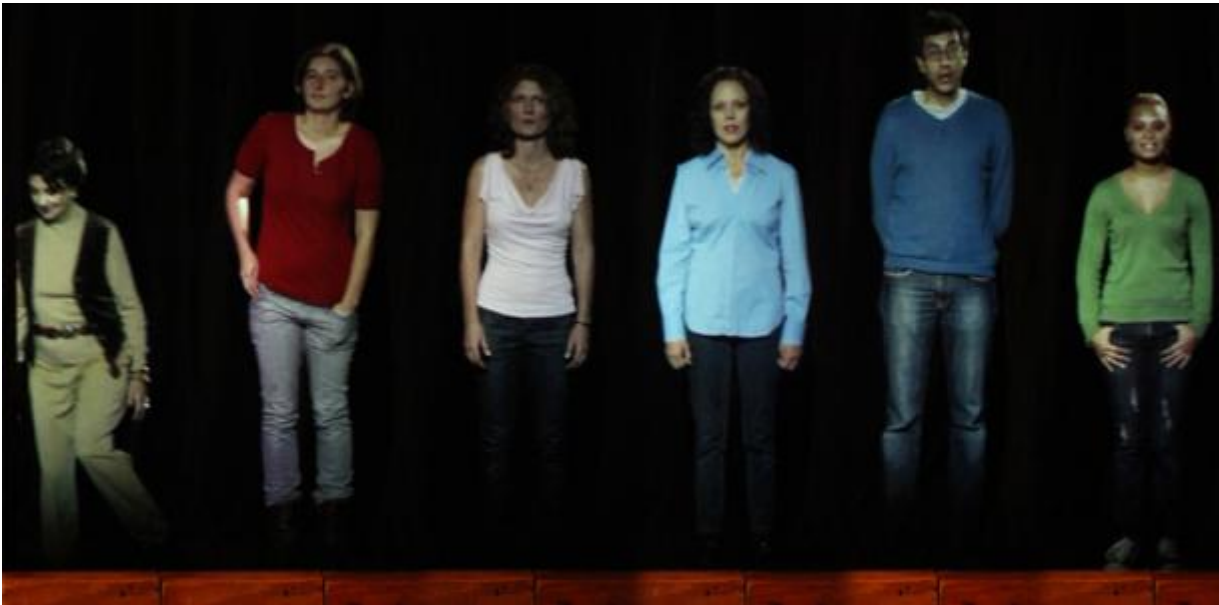
Richard Maxwell, Ads

Il festival Santarcangelo?12 ci aveva riservato, il primo giorno, un atteso lavoro di Richard Maxwell, Ads , (abbreviazione di advertisement , pubblicità, esposizione in pubblico), trasposizione romagnola di una ricerca nata a New York nel 2010, che prova a rispondere alla domanda: “in un mondo consumato da crisi di identità e allo stesso tempo dominato dalla pubblicità, come può l’uomo iniziare a riprendersi il proprio spazio?”. Questo regista che crea spettacoli essenziali, spesso affidati a non professionisti, per sfrangiare le convenzioni, per forare gli schermi della rappresentazione, ha dato la parola a una trentina di cittadini di Santarcangelo di tutte le età e di varie razze. In palcoscenico, però, li ha rievocati in forma di ologrammi registrati, con un’illusione solo iniziale di presenza: subito si scoprivano come ombre che parlavano di cose in cui persone reali credono, l’amore, la famiglia, i figli, il lavoro... Il tutto grondava buoni sentimenti, attesa, lievi timori, valori piuttosto convenzionali. Polso del paese reale? Scelta non particolarmente attenta o fortunata? Qualche tipo forava la ripetizione un po’ catechistica con tic, con capacità affabulatorie; ma sostanzialmente si rimaneva sempre distanti dal conflitto, dalla passione forte, dalla necessità dirompente, dal mistero, impantanati nei paraggi del lato più risaputo delle speranze comuni.