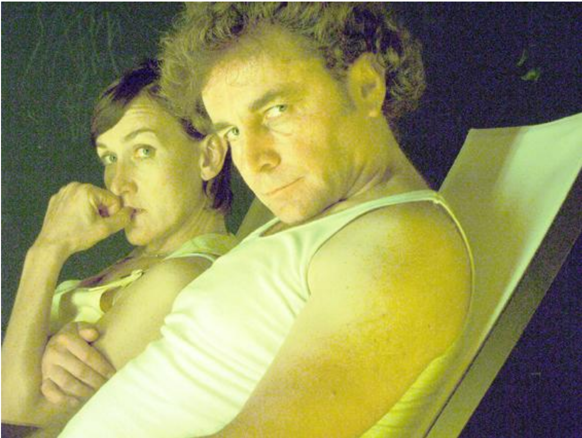
Quotidiana.com, Grattai e vinci.

Abbiamo visto in As It Is di Damir Todorovic e Valentina Carnelutti un giochino con una scassata macchina della verità che voleva dimostrare la finzione nel racconto autobiografico (!) e la menzogna dell'attore (!), deboli, usurati pretesti per raccontare, senza forza, episodi della guerra in Bosnia. Abbiamo partecipato al tenero, autistico gioco di Matija Ferlin, che in Sad sam / almost 6/ dialoga con un centinaio di pupazzetti di animali disposti in un grande cerchio intorno a lui: un ritorno all'infanzia per narrare e agire solitudine, memoria, smarrimento del senso del tempo, riproducendo i meccanismi della vita adulta in un gioco che diventa sempre più specchio di ansie, in un mondo che chiede di essere simili al piccolo agnello solo di fronte al branco dei grandi animali feroci. Ferlin riempie lo spazio con presenza di danzatore, creando spesso in quel piccolo mondo protetto una frattura, un salto, una ferita.