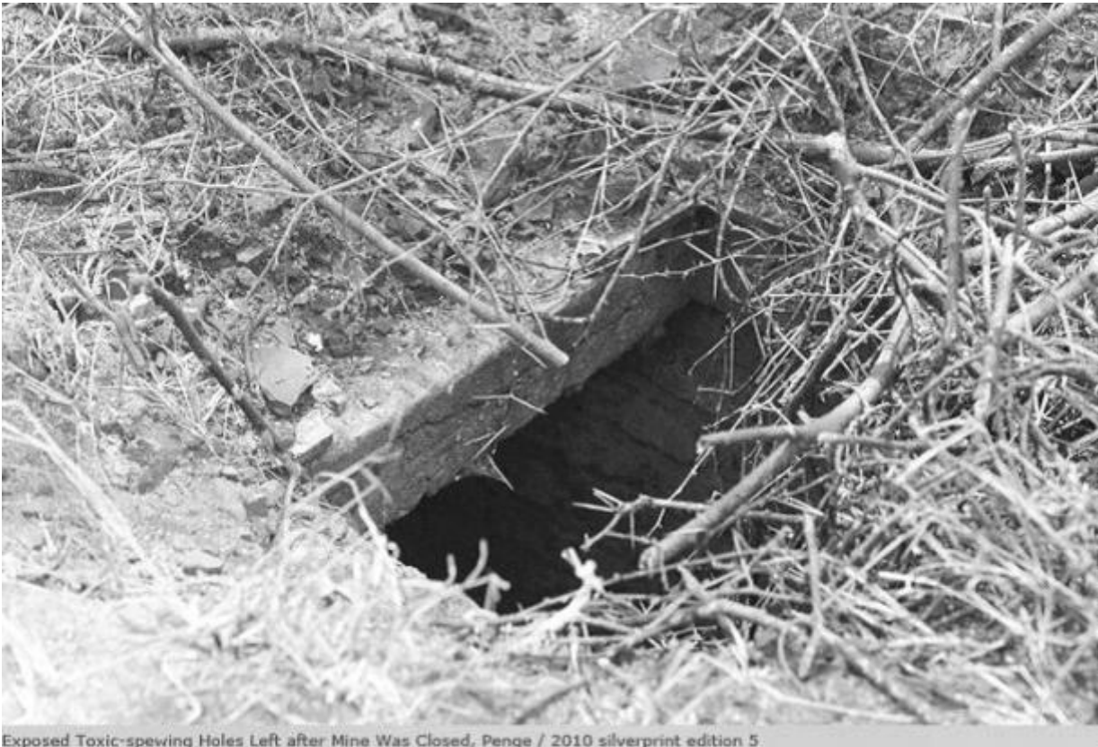
Exposed Toxic-spewing Holes Left after Mine Was Closed, Penge / 2010 silverprint edition 5.

Su ogni dettaglio e ogni immagine domina infatti lo sguardo ambiguo del fotografo, la messa in discussione di ciò che Santu Mofokeng chiama con una formula icastica “a casa propria”, ovvero “una finzione che ci si crea per bisogno di appartenenza”. Il suo sguardo ha la struttura aperta di un dubbio: ogni luogo come ogni volto impresso nelle sue immagini, è indice di una precisa realtà, ma riesce proprio nello spazio generato dal dubbio a divenire “metafora viva”, capace di trascendere i limiti del medium fotografico – ciò che Roland Barthes chiamava “morte piatta” – per trasformarsi in un vero e proprio “instauratore di discorsività”, o meglio uno sguardo-discorso sulla realtà fotografata e sulla fotografia stessa.