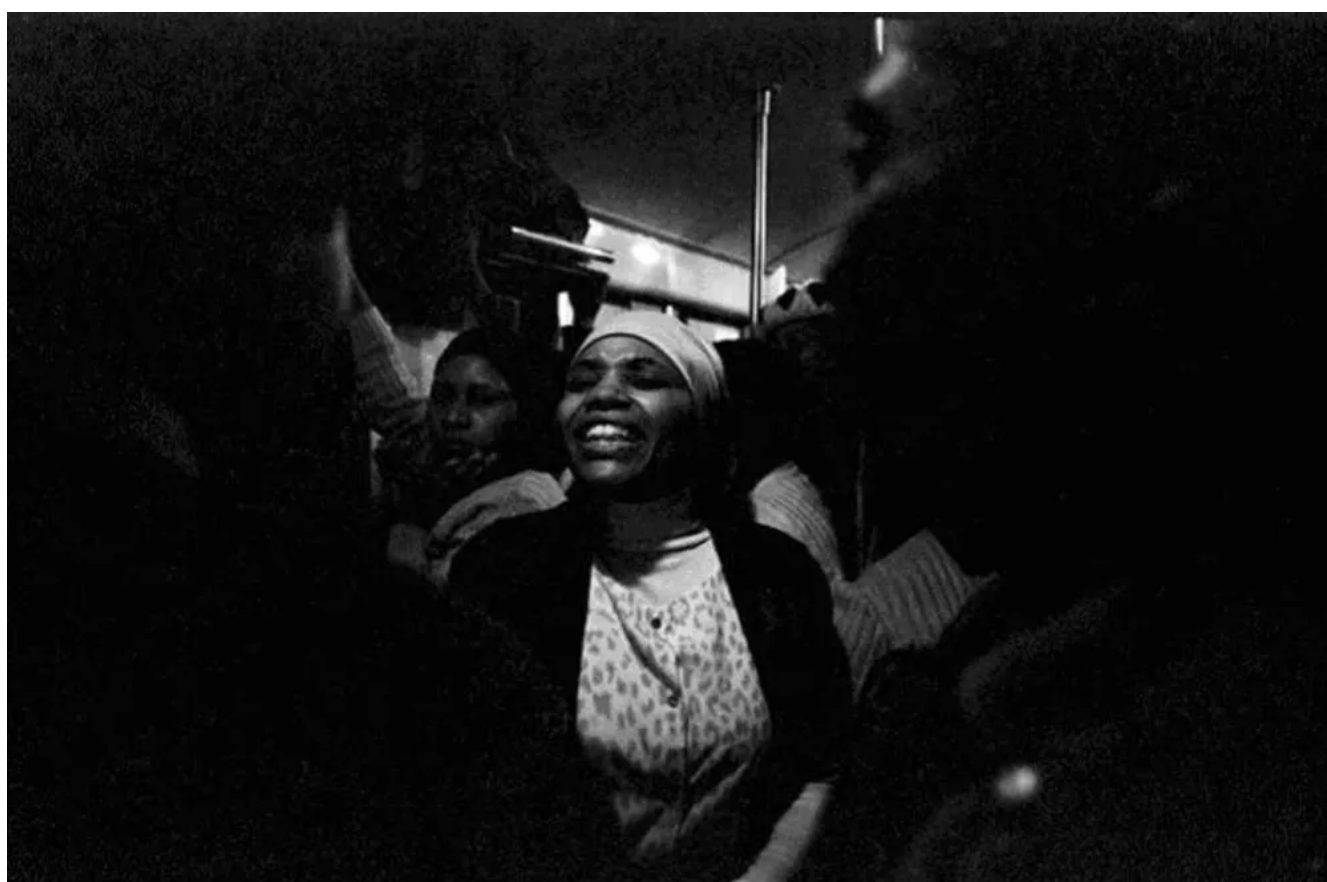
Exhortations, Johannesburg - Soweto Line / 1986 silverprint edition 5

Torna presto a leggerci e SOSTIENI DOPPIOZERO