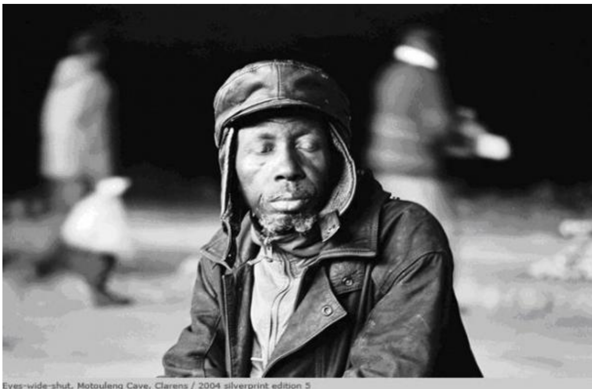
Eyes-wide-shut, Motouleng Cave, Clarens / 2004 silverprint edition 5

L'ombra che offusca la pupilla non indica la presenza di un'assenza, come in Plinio, bensì qualcosa di materiale che prenderà corpo nelle immagini del fotografo- chasseur d'ombres , riflesso metaforicamente in questa immagine e, quasi in un rovesciamento speculare, nell'autoritratto della propria ombra fra due file di immagini fotografiche – ombre sopravvissute – nel campo di concentramento di Auschwitz.