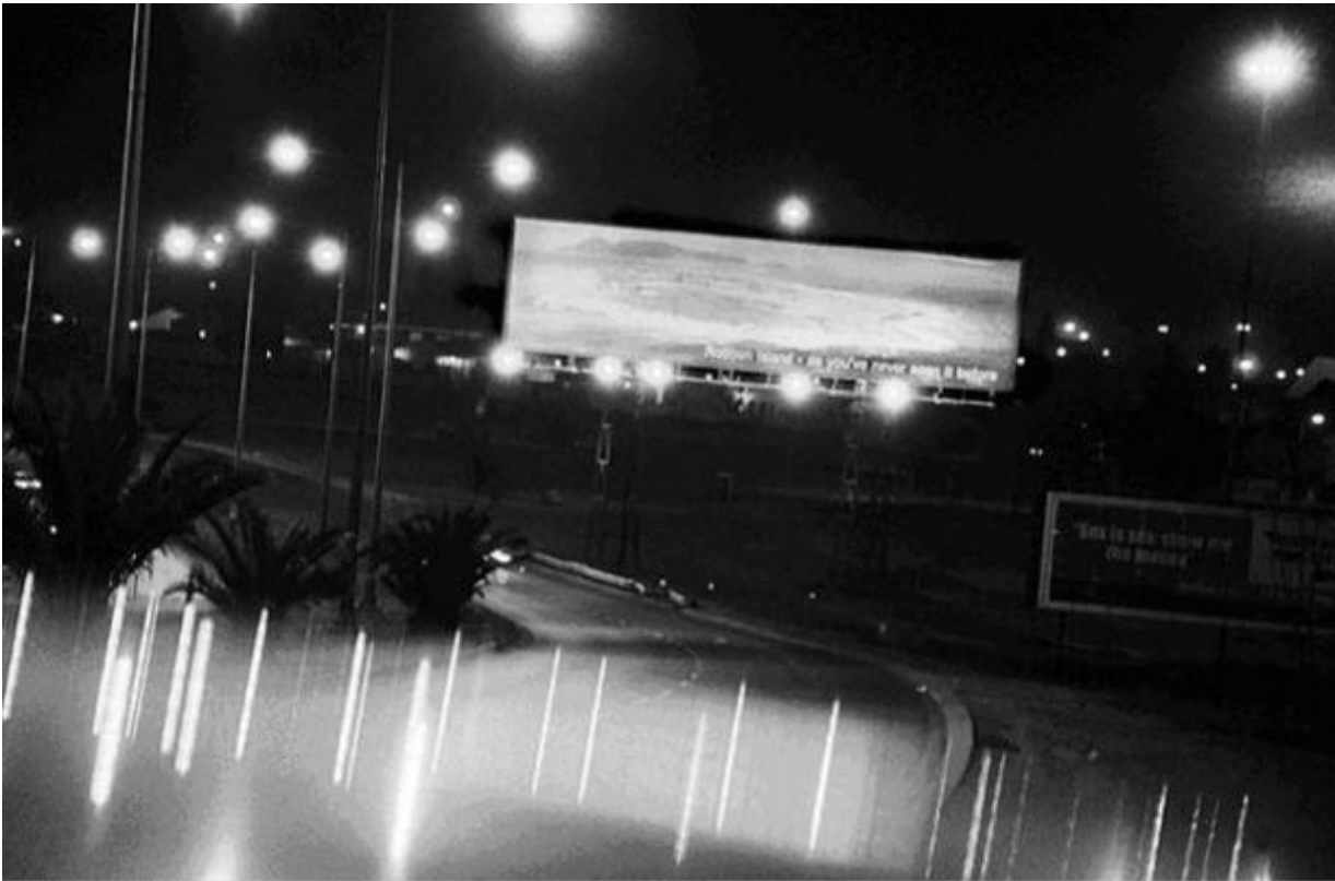
Robben Island as You Have Never Seen it Before / c.2002 silverprint edition 5