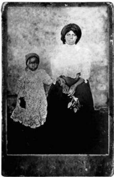
Slide 17/80 / 1997 black and white slide projection, installation edition 5

Il fotografo realizza una serie di immagini che hanno per soggetto i grandi cartelloni pubblicitari tipici del paesaggio delle townships , che sembrano, afferma l’artista “le pagine di un libro sfogliato velocemente” e da cui emergono espliciti rimandi all’ideologia dell’apartheid (la pubblicità dello “sbiancante” Omo, l’ironico cartellone che raffigura Robben Island, dove era recluso Nelson Mandela, come un luogo di vacanza, lo slogan pubblicitario “Democracy is Forever” per cui ogni commento è superfluo).