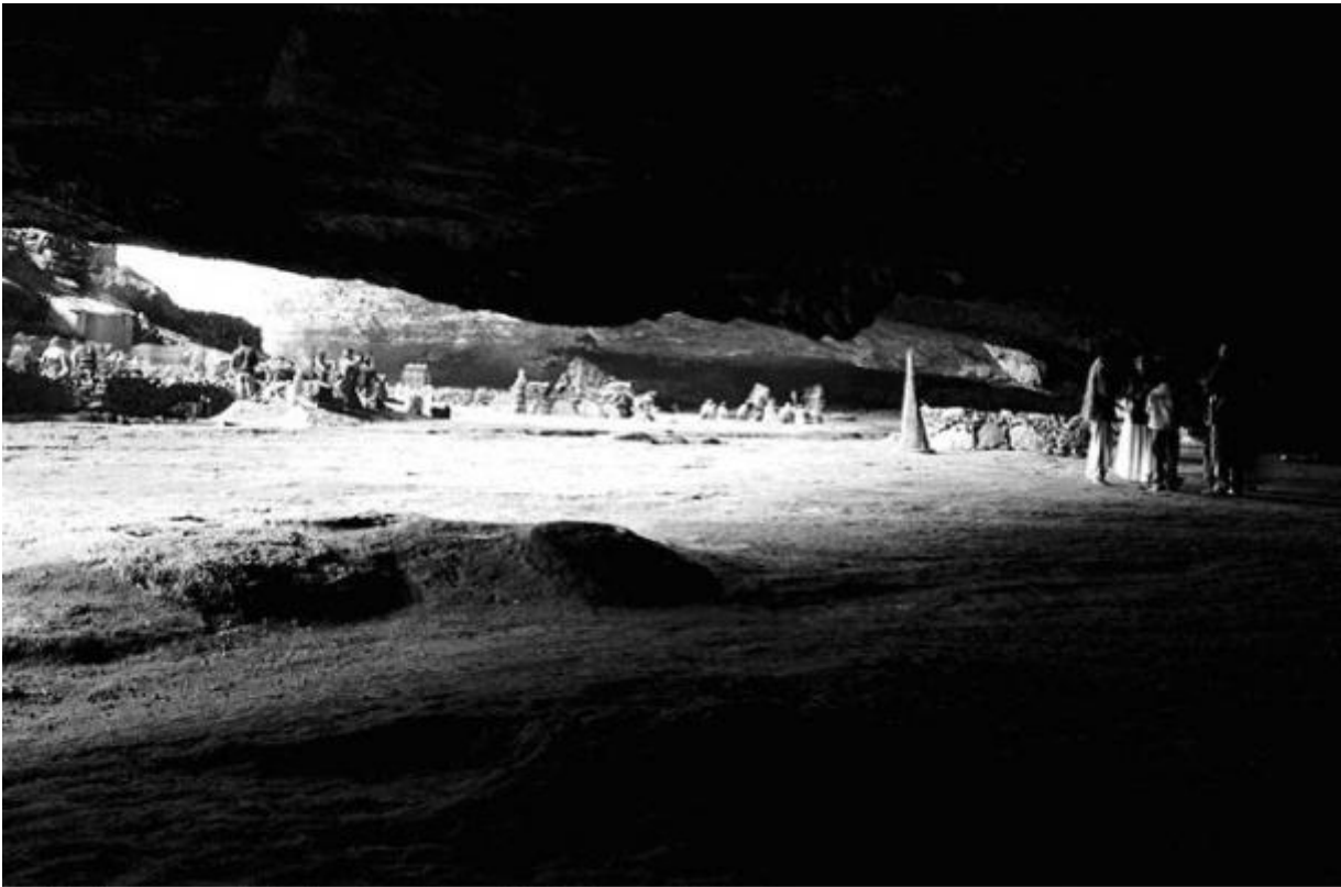
Inside Motouleng Cave, Motouleng Cave, Clarens / 1996 silverprint edition 5