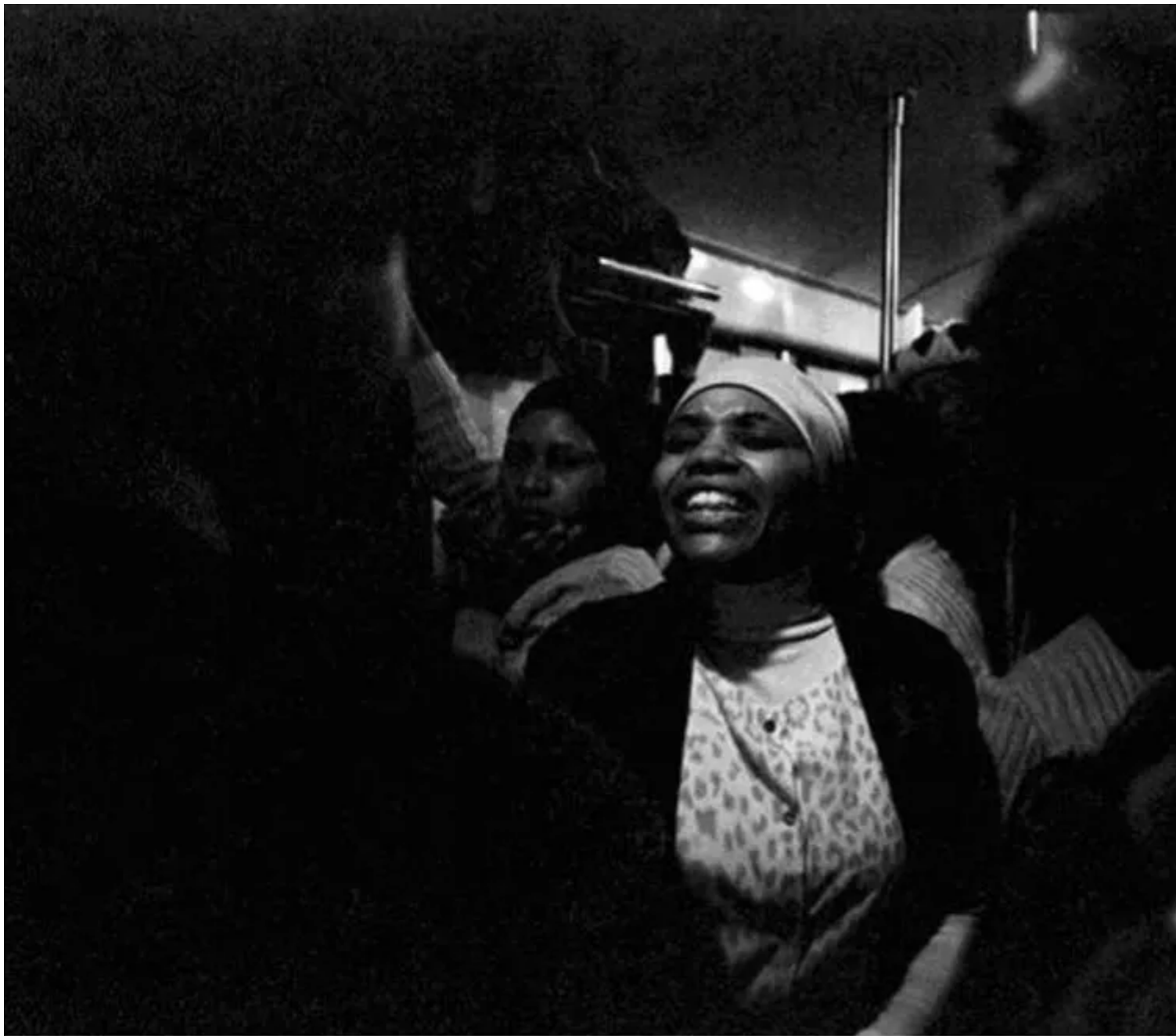
Exhortations, Johannesburg - Soweto Line / 1986 silverprint edition 5