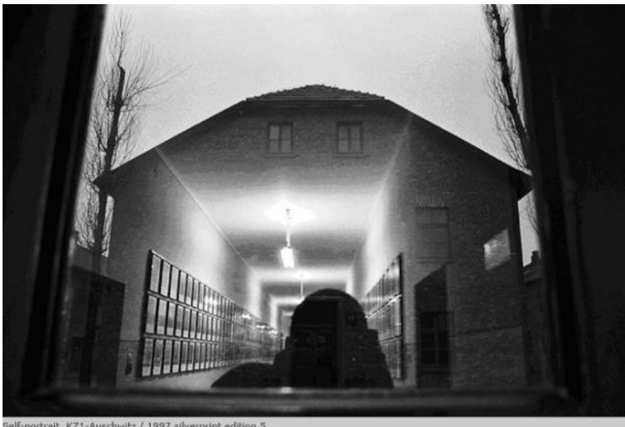
Self-portrait, KZ1-Auschwitz / 1997 silverprint edition 5