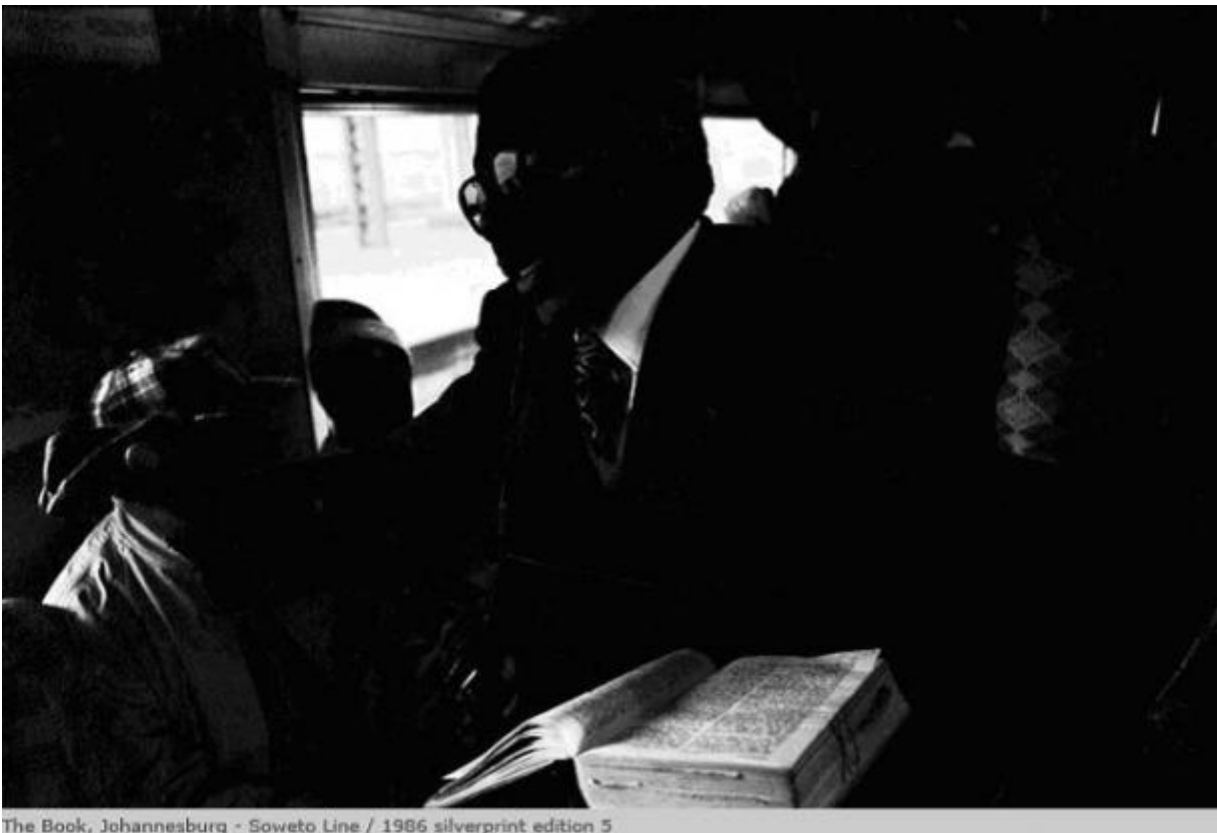
The Book, Johannesburg - Soweto Line / 1986 silverprint edition 5

Basta limitarsi a guardare la sequenza di Train Church , i “treni-chiesa” di Soweto, ovvero i mezzi di trasporto rischiosi e insicuri su cui viaggiano centinaia di persone per recarsi al lavoro. In equilibrio tra la bellezza e l’eroismo della visione, come direbbe Susan Sontag, immerse in suoni e canti – l’immagine The Drumming è eloquente – gli individui qui immortalati riescono a tramutare questo frammento di tempo in una preghiera catartica inneggiante alla sopravvivenza: Exhortations , Opening Song , Supplication , dicono le parole scritte nelle didascalie. Il fotografo, anch’esso sul treno in movimento, mostra i volti di uomini e donne coinvolti in un’estasi religiosa improvvisa e bizzarra, accentuata ora da fasci di luce dal chiarore quasi soprannaturale, ora da zone d’ombra che rendono i loro corpi evanescenti, sospesi in un’atmosfera di “dolcezza vellutata”, scrive Okwui Enwezor.