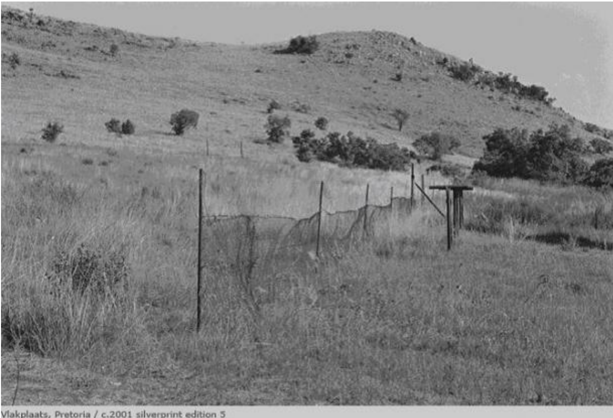
Vlakplaats, Pretoria / c.2001 silverprint edition 5

Da questa consapevolezza Santu Mofokeng intraprende un viaggio iniziatico nei luoghi delle tragedie in Europa e Asia nel tentativo di comprendere le diverse strategie di elaborazione del lutto e del ricordo, da cui nascono i suoi Trauma Landscapes .