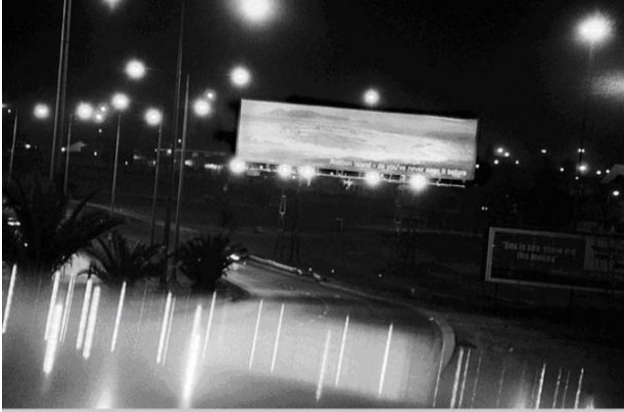
Robben Island as You Have Never Seen it Before / c.2002 silverprint edition 5