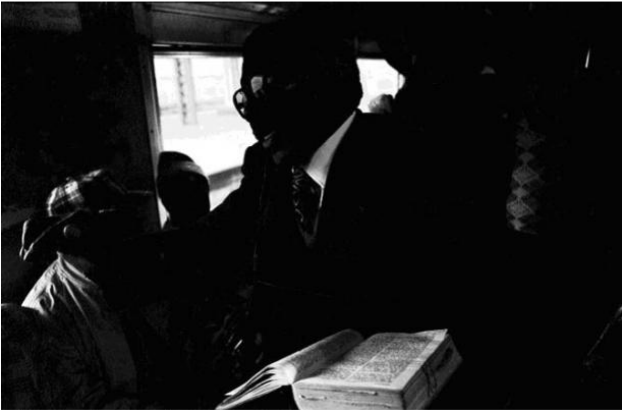
The Book, Johannesburg - Soweto Line / 1986 silverprint edition 5