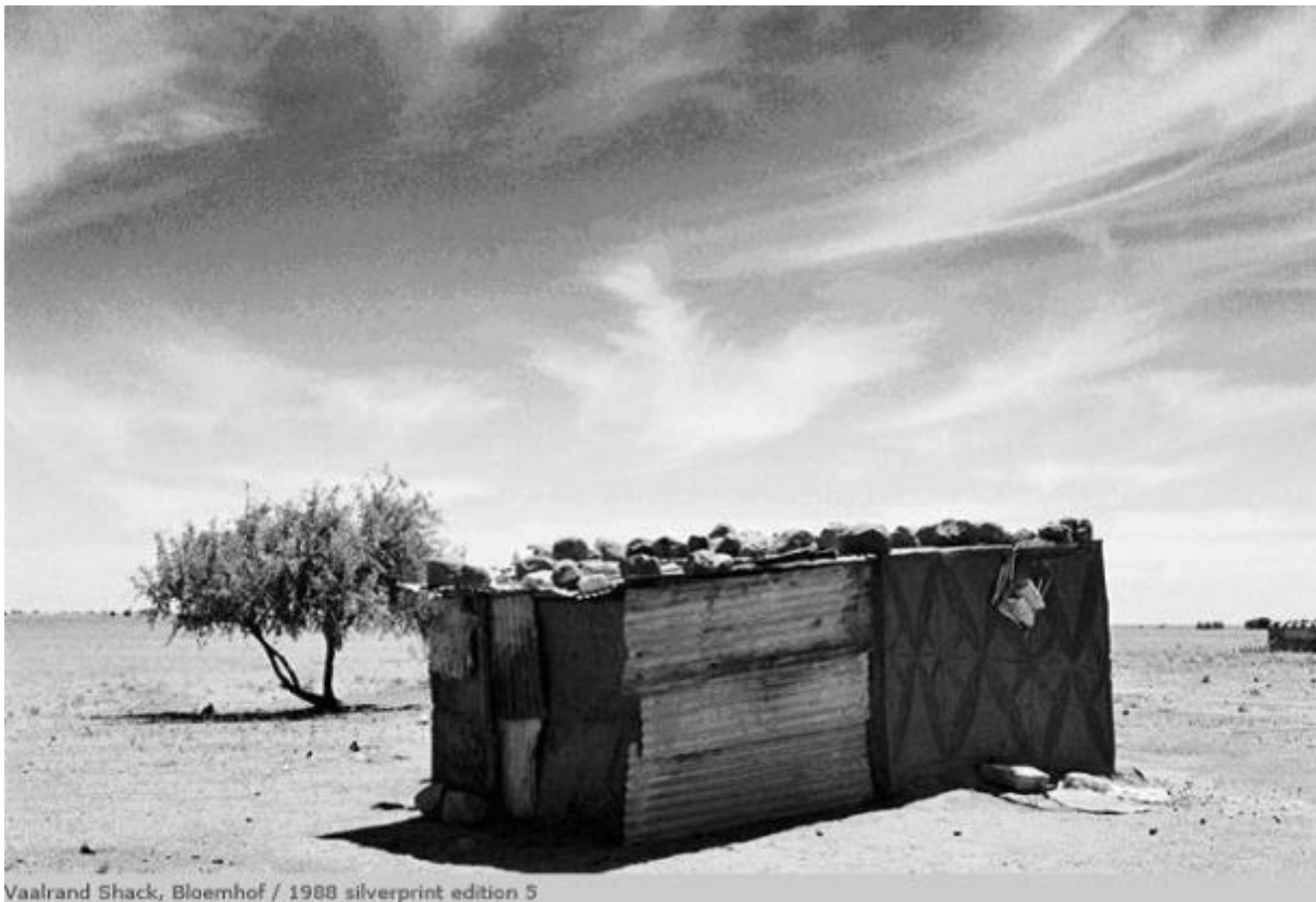
Vaalrand Shack, Bloemhof / 1988 silverprint edition 5

È in questa cornice che si inscrivono le peregrinazioni del fotografo, i suoi tentativi di dare corpo al paesaggio sudafricano, nei luoghi dove si sono sedimentate l'ombra della violenza e della tragedia. L' ombra-seriti qui si fa "re-membrance", ovvero come dice Mofokeng, un processo grazie al quale diviene possibile ridare consistenza ai ricordi dimenticati senza abbandonarsi alla tentazione di spettacolarizzare il dolore.