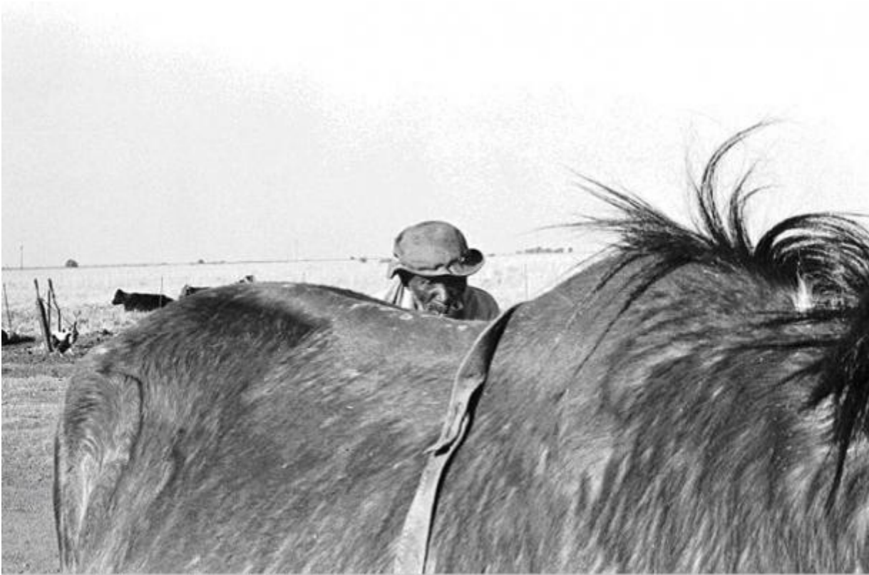
Maine Talking to His Horse, Vaalrand / c.1988 silverprint edition 5