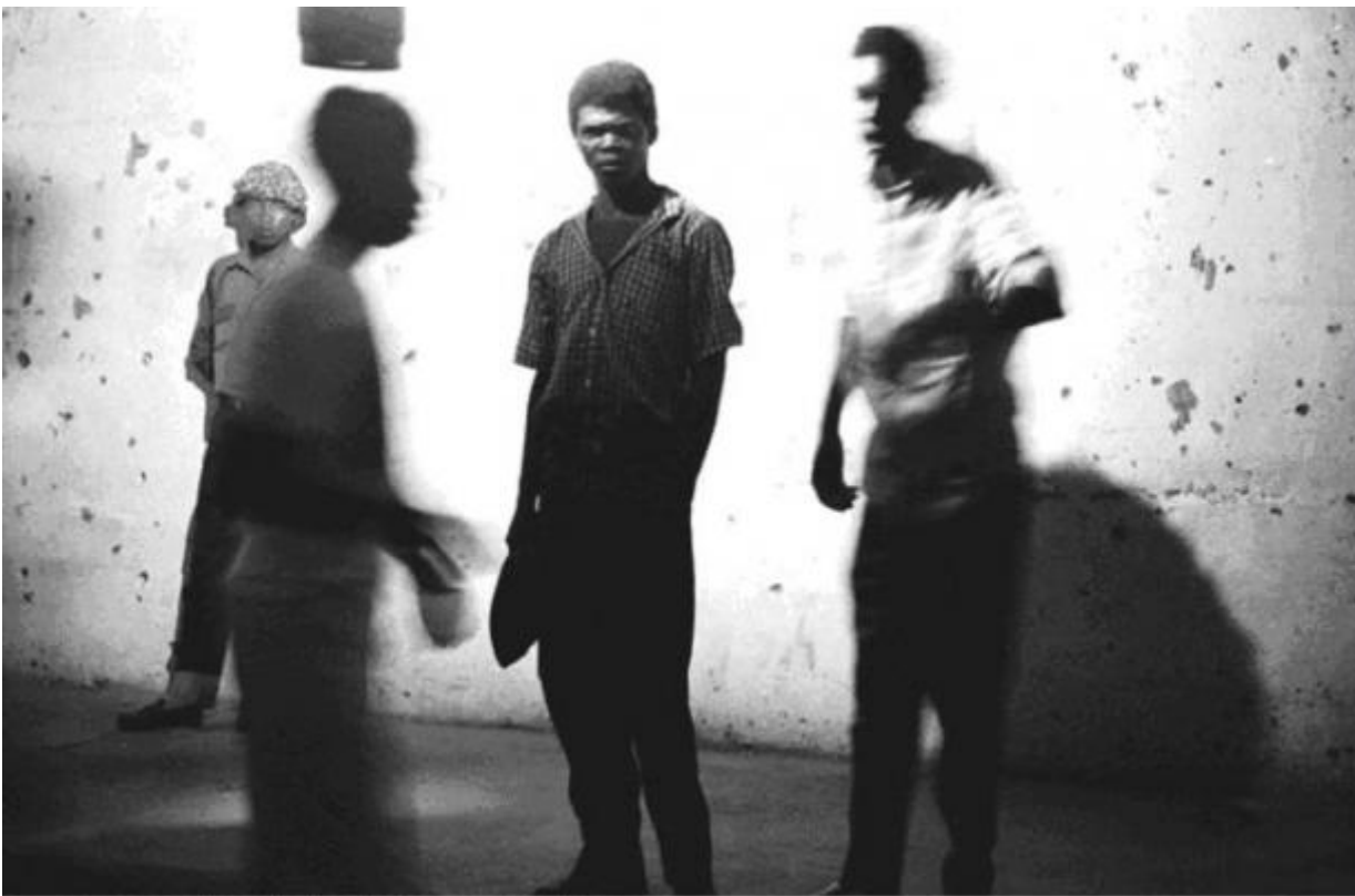
Concert at Sewefontein, Bloemhof / 1989 silverprint edition 5