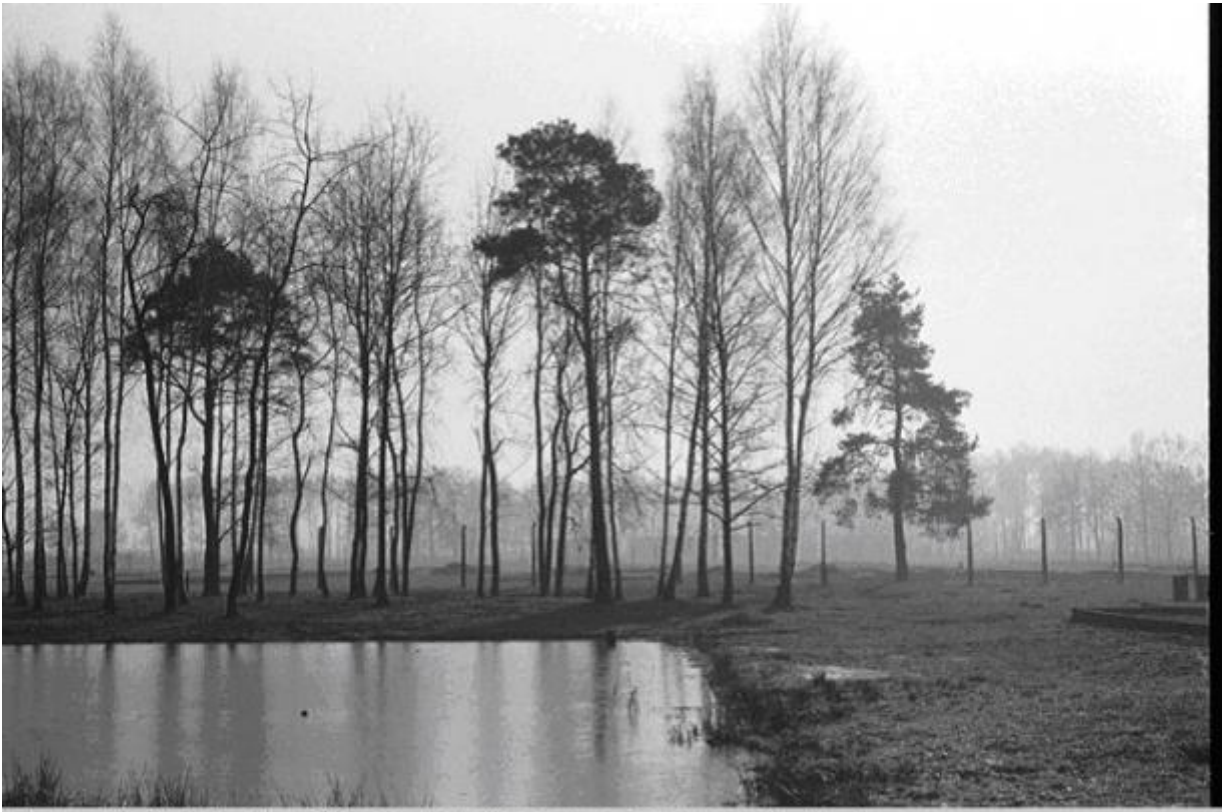
Lake Once Filled With The Ashes of tThe Cremated, KZ2-Auschwitz / 1997 silverprint edition 5