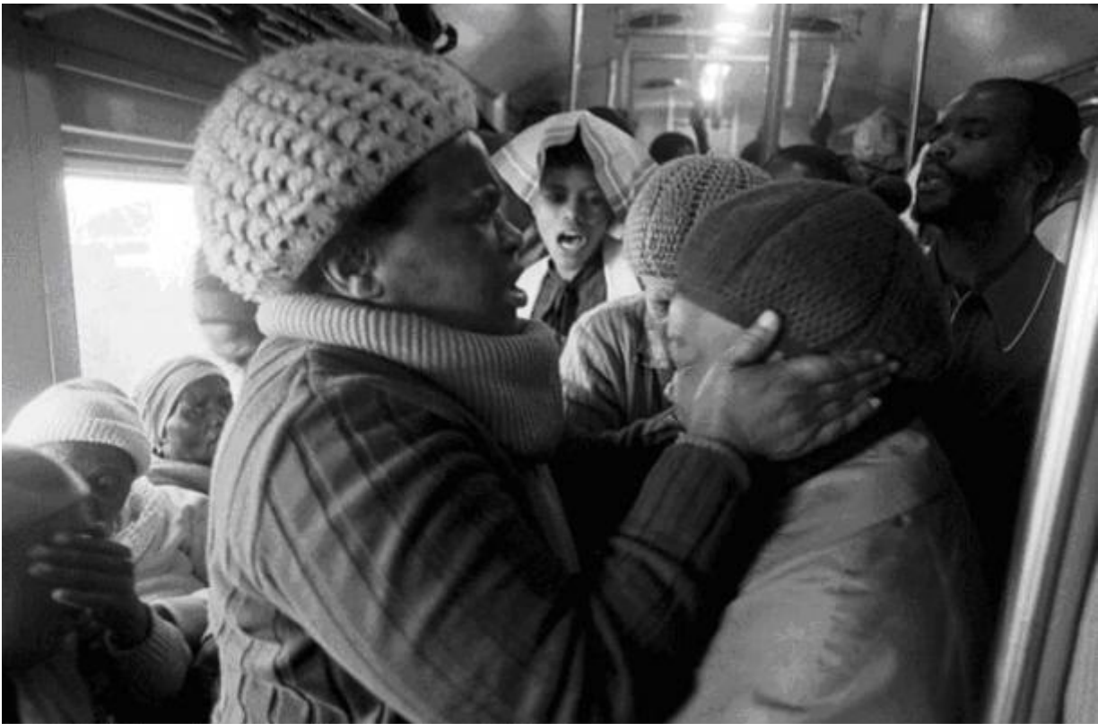
Supplication, Johannesburg - Soweto Line / 1986 silverprint edition 5