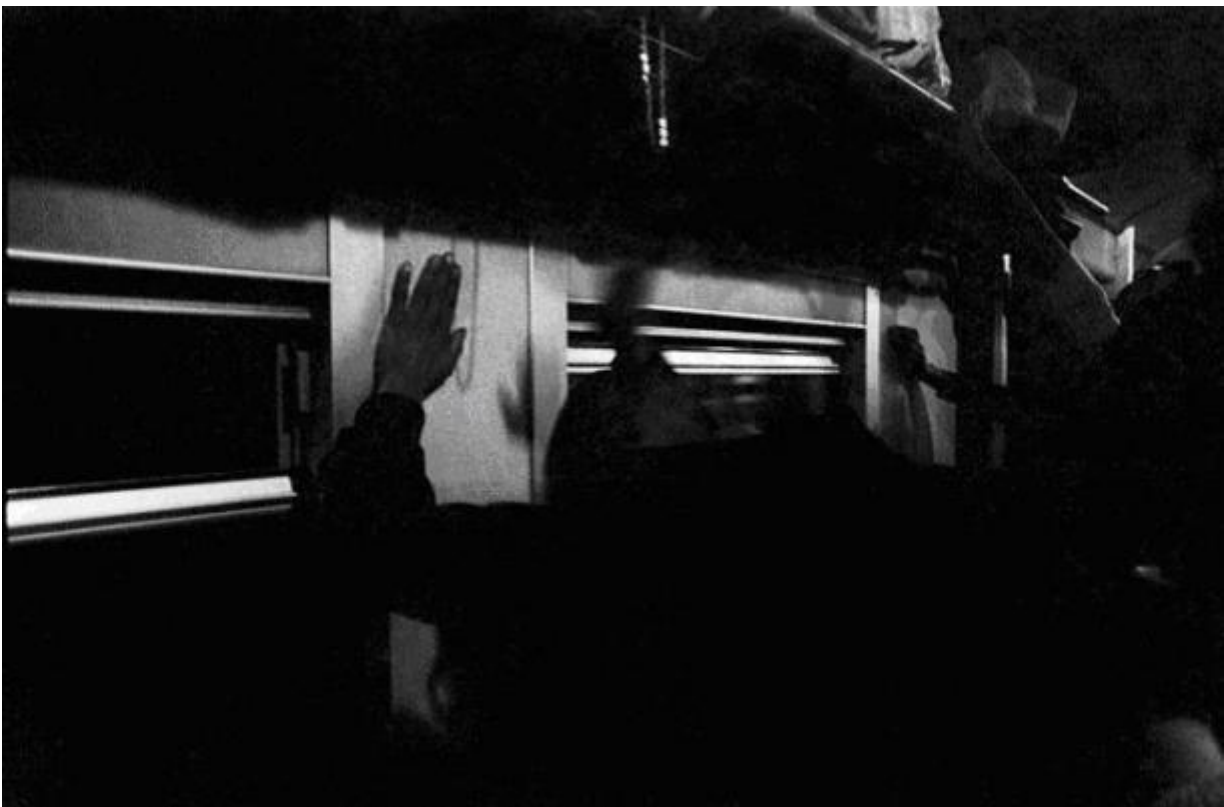
The Drumming, Johannesburg - Soweto Line / 1986 silverprint edition 5