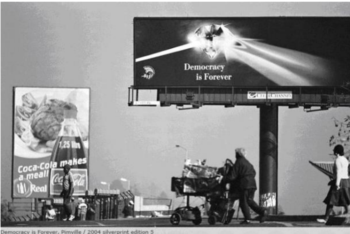
Democracy is Forever, Pimville / 2004 silverprint edition 5

E lo stesso vale per le immagini di paesaggi avvelenati: miniere dismesse, rifiuti tossici, effetti causati dai cambiamenti climatici, raffigurati anche in questo caso con uno sguardo colmo di ambiguità, che in alcuni casi accosta desolazione e