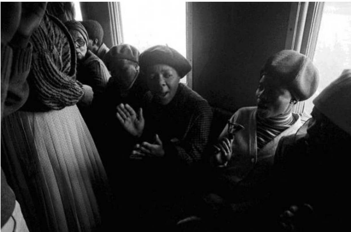
Opening Song, Hand Clapping and Bells / 1986 silverprint edition 5

Così come avviene in Chasing Shadows , in cui il fotografo affronta da un altro punto di vista la questione della spiritualità, che nel suo paese ha avuto un ruolo importante: molte persone pensavano che se non potevano abbattere l'apartheid,