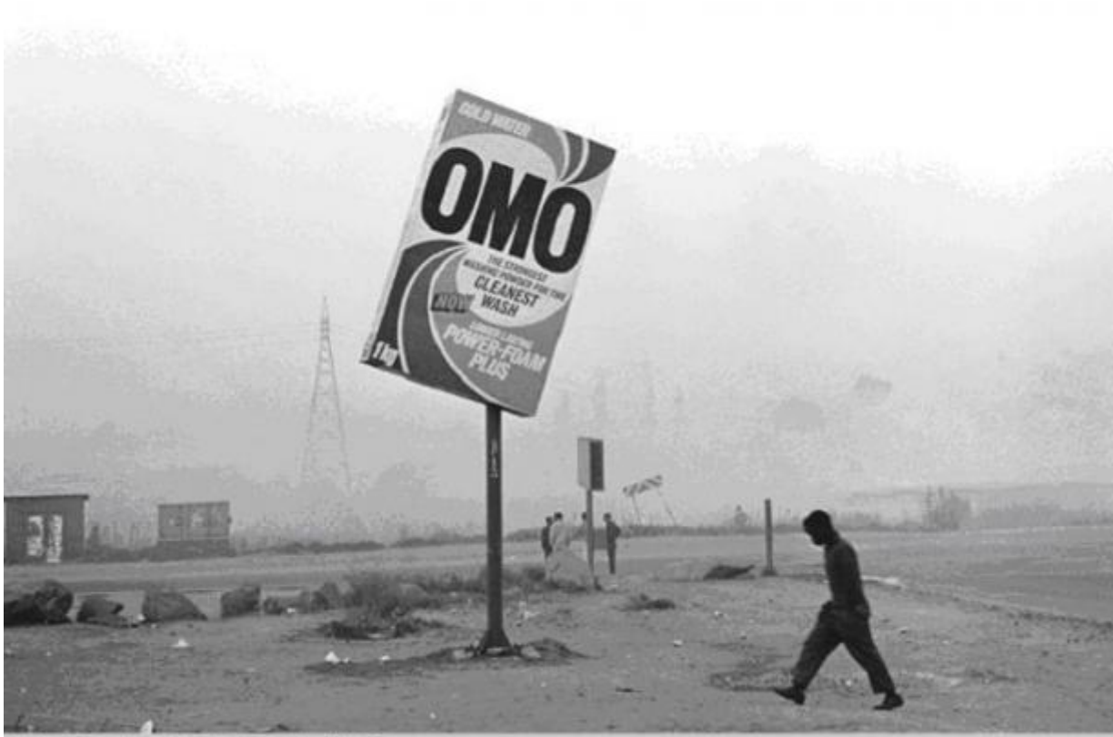
Winter in Tembisa / 1991 silverprint edition 5