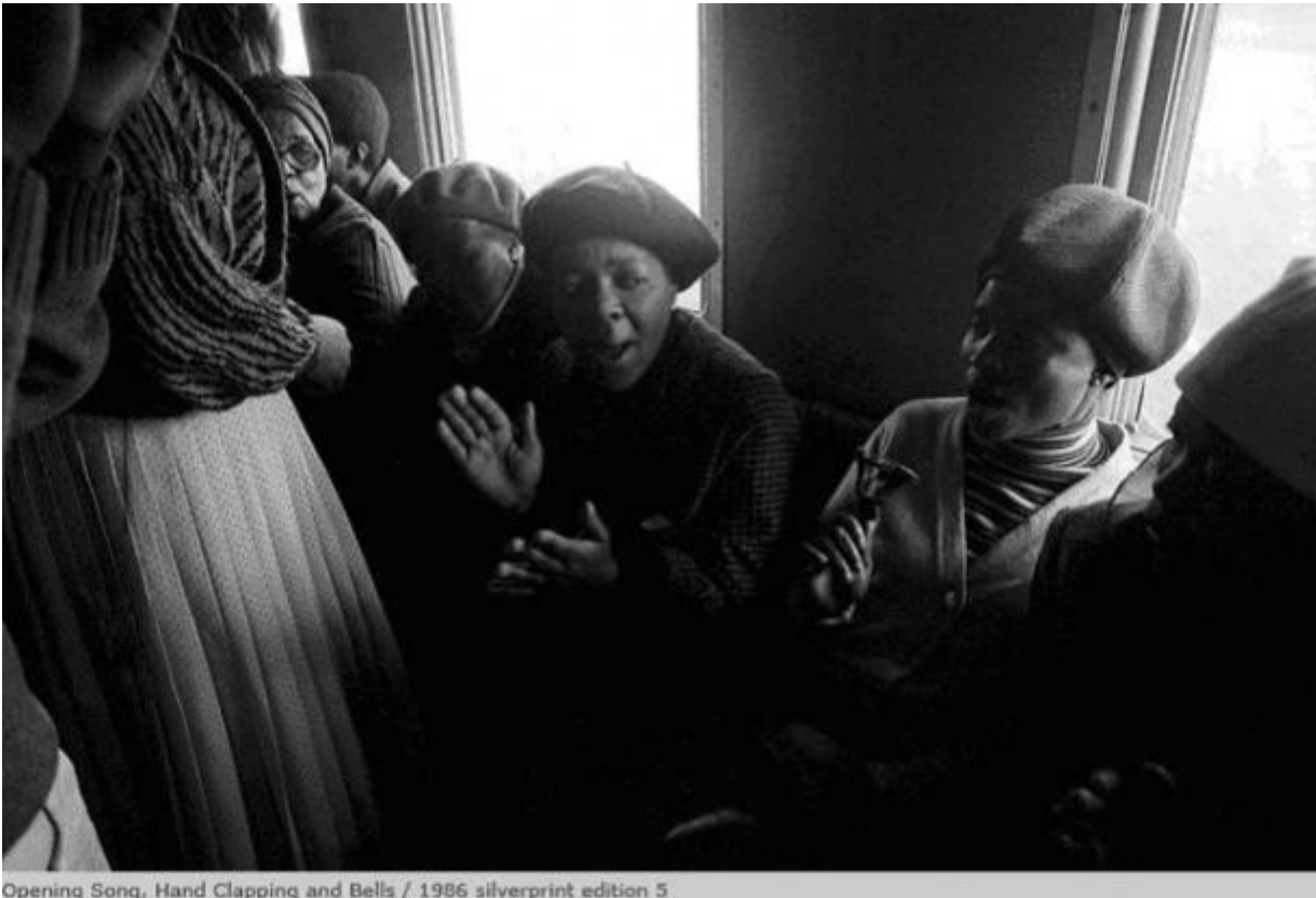
Opening Song, Hand Clapping and Bells / 1986 silverprint edition 5

Così come avviene in Chasing Shadows , in cui il fotografo affronta da un altro punto di vista la questione della spiritualità, che nel suo paese ha avuto un ruolo importante: molte persone pensavano che se non potevano abbattere l'apartheid, avrebbero trovato giustizia nell'aldilà. Ecco che il titolo di questo lavoro, evoca nello stesso tempo qualcosa di chimerico ma allo stesso tempo reale, un "monde arachnéen", lo definisce Mofokeng – in Inside Motouleng Cave anche il suo occhio, come quello di un ragno, pare guardare dall'interno di un buco, a caccia di "ombre" – dove realtà e irrealtà, sacro e profano, umano e divino perdono i loro contorni e si fanno mondi labili, in Church of God la sacralità del luogo si confonde con "l'aura" dell'individuo; forze invisibili che lasciano tracce nel mondo tangibile, scrive Adam Ashforth.