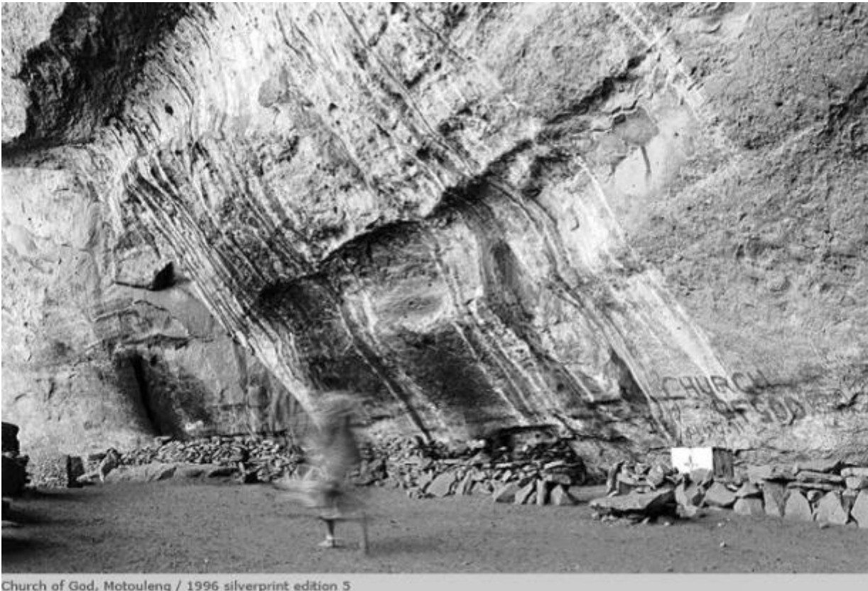
Church of God, Motouleng / 1996 silverprint edition 5

In Rumours/The Bloemhof Portfolio , si possono trovare le tracce di una risposta a questo interrogativo. Bloemhof è il nome di una piccola città nella regione del Transvaal, in cui Mofokeng si reca per documentare le condizioni di vita dei mezzadri: i salari miseri, le interminabili giornate di lavoro, ma altresì per osservare, come lui scrive, l'inquieta euforia alla vigilia delle prime elezioni democratiche del 1994, rappresentata emblematicamente in Moth'osele Maine . Qui si vede che dall'ombra del soggetto, sovrapposta alla sua vera immagine – ma potrebbe anche trattarsi del riflesso dello stesso fotografo, del suo sguardo, delle sue aspettative – sembra sgorgare un'aura, una luce, una speranza che rischiarerà la stanza.