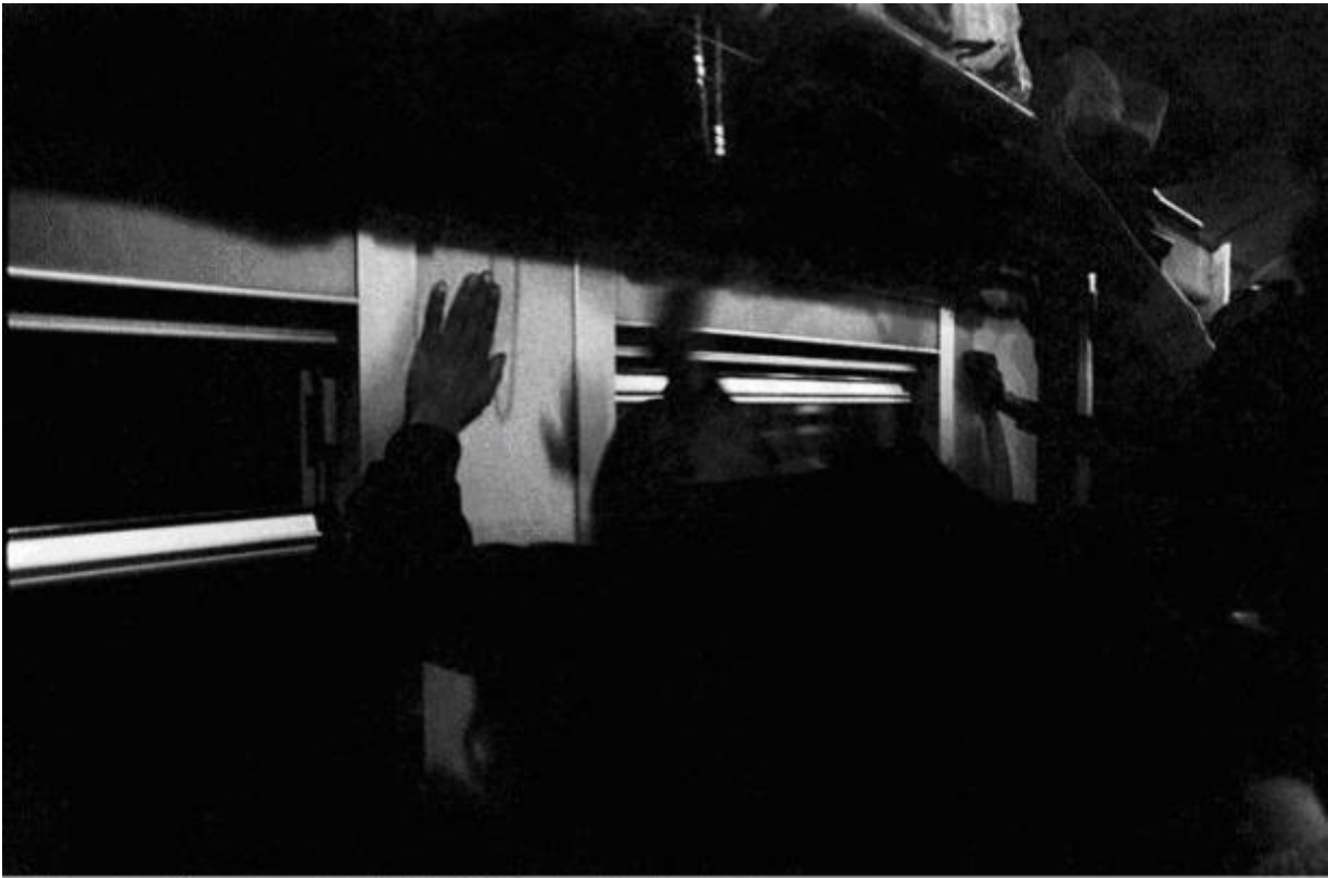
The Drumming, Johannesburg - Soweto Line / 1986 silverprint edition 5