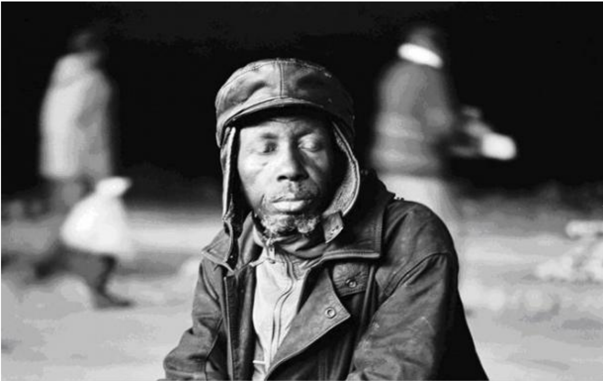
Eyes-wide-shut, Motouleng Cave, Clarens / 2004 silverprint edition 5