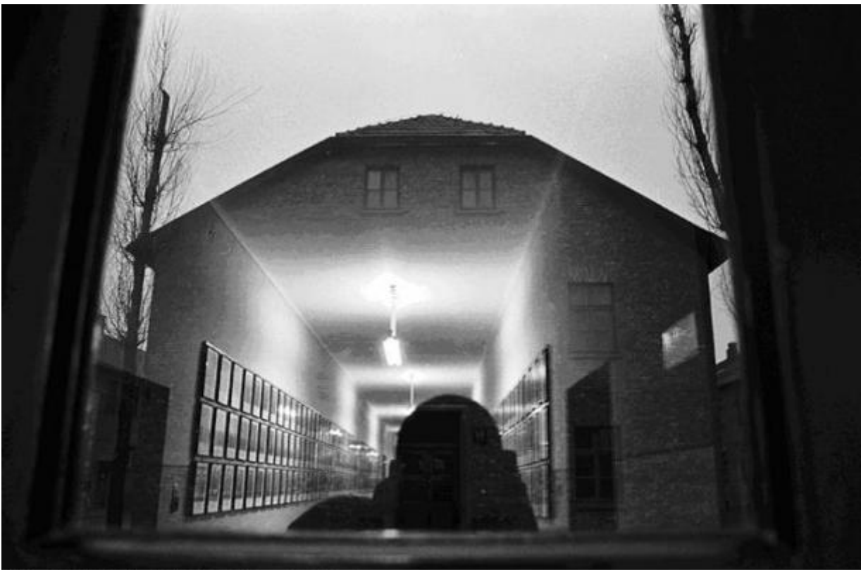
Self-portrait, KZ1-Auschwitz / 1997 silverprint edition 5

Nell’Africa del Sud, scrive Mofokeng, a differenza che nella tradizione europea, l’ombra indica qualcosa di reale. In sesotho , la sua lingua madre, la parola seriti corrisponde a ombra, ma l’assenza di luce non esaurisce il suo senso: seriti nel