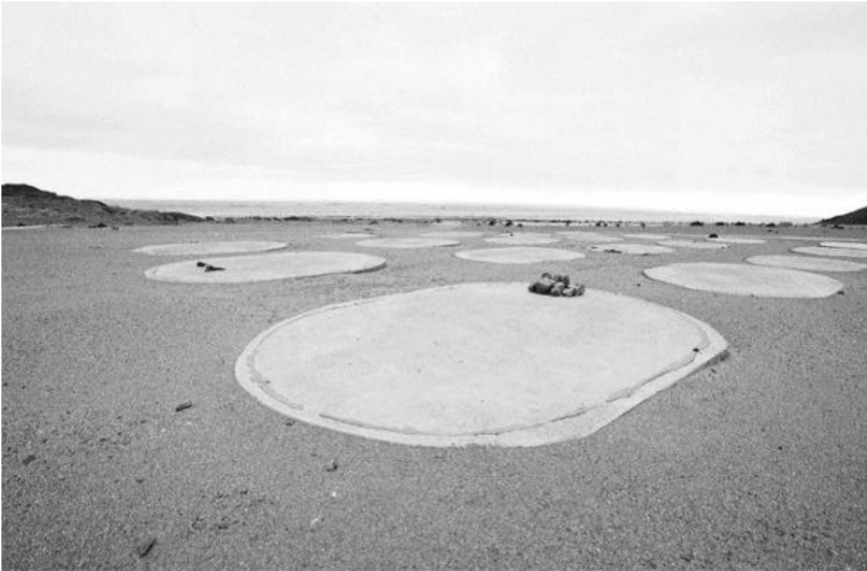
Landscape Left by Rossing Uranium Mine after its Closure, Kolmanskop, Namibia / 2011 silverprint edition 5

bellezza, come in Landscape Left by Rössing Uranium Mine , che si costituiscono come ideale risposta ai Trauma Landscapes .