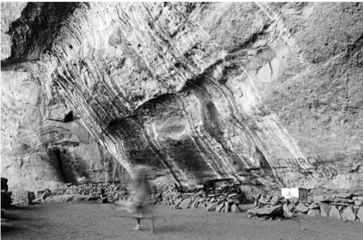
Church of God, Motouleng / 1996 silverprint edition 5

In Rumours/The Bloemhof Portfolio , si possono trovare le tracce di una risposta a questo interrogativo. Bloemhof è il nome di una piccola città nella regione del Transvaal, in cui Mofokeng si reca per documentare le condizioni di vita dei mezzadri: i salari miseri, le interminabili giornate di lavoro, ma altresì per osservare, come lui scrive, l'inquieta euforia alla vigilia delle prime elezioni democratiche del 1994, rappresentata emblematicamente in Moth'osele Maine . Qui si vede che dall'ombra del soggetto, sovrapposta alla sua vera