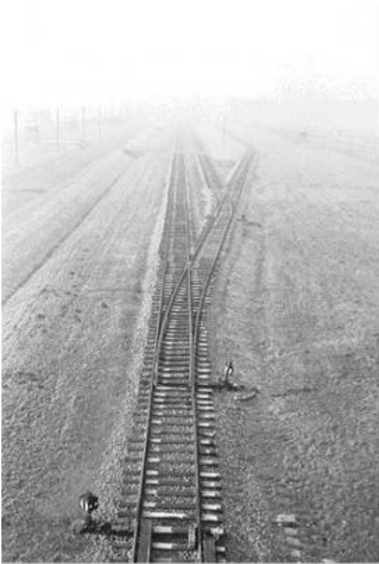
End of The Line, KZ1-Auschwitz, Poland / 1997 silverprint edition 5