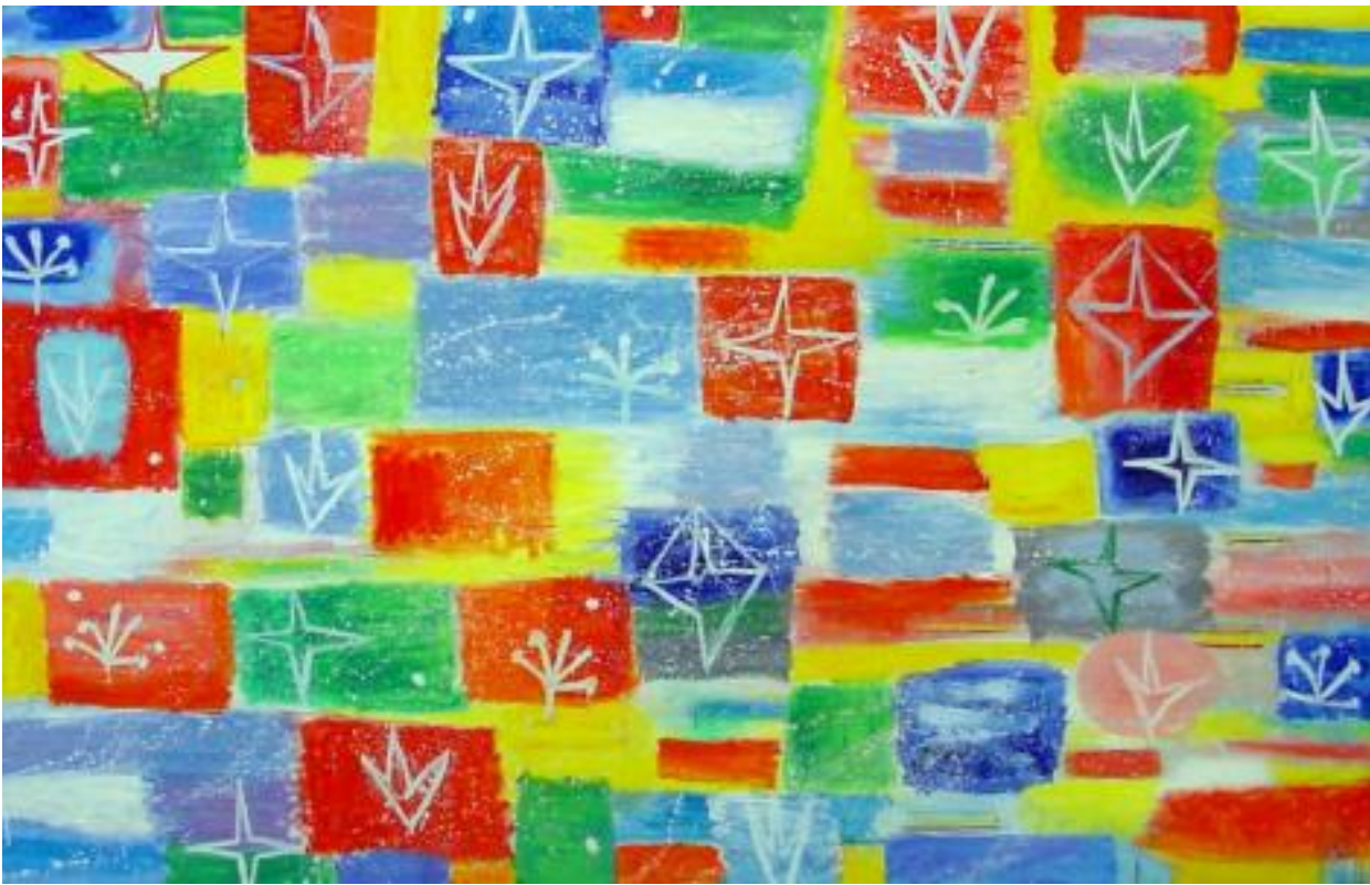
Nicola De Maria, Festival dell'atmosfera che brilla

anacronistici, nazionali o addirittura regionali, insieme al perdurante attaccamento a una storia dell'arte sentita come parte fondante dell'identità individuale e collettiva. L'appropriazione può avere modalità di volta in volta "ludico-erotiche", storico-artistiche o archeologiche, per cui, come fa Salvo, il museo non è solo citato ma "mandato memoria e copiato"; ovvero, come nel caso di Pisani, rivisitando con la guida di Marcel Duchamp e Joseph Beuys le catacombe della cultura esoterica alla ricerca di una ambigua illuminazione; o ancora, come per Ontani, trasformando "la pinacoteca classico-rinascimentale" in un "guardaroba teatrale da indossare e reinterpretare afrodisiacamente"[31]. Sullo sfondo, per tutti questi artisti, il precoce sentimento di un crepuscolo, di una condizione cristallizzata, imm modificabile, in cui l'arte agisce non come forza prospettica ma piuttosto come esercizio scettico e malinconico, intriso di pessimismo, del sentimento della profonda e tragica ironia connaturata alla Storia. A quest'ultima De Dominicis avrebbe elevato nel 1970 un memorabile epicedio con l'installazione Il tempo, lo sbaglio, lo spazio , dove lo scheletro umano e quello di un cane, i loro pattini a rotelle e l'asta dorata in equilibrio, compendiano la fatale sproporzione tra desiderio e destino, il senso dell'ineluttabile e umoristico fallimento che attende la missione cosmico-eroica dell'artista.