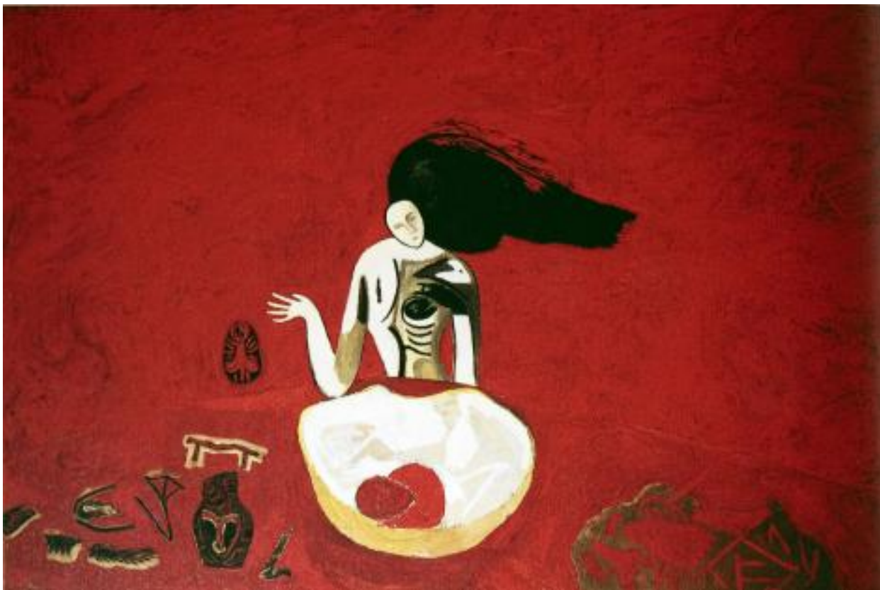
Mimmo Paladino, Senza titolo, 1982

buio della crisi economica, politica e sociale di quel decennio – i sintomi di un passaggio, di una “catastrofe” anzi, che incideva direttamente sul piano simbolico e si manifestava anzitutto con l’esaurirsi degli schemi culturali e linguistici tardomodernisti, dei loro presupposti ideologici “progressivi”, ovvero di quel “primato del politico” che era stato uno dei tratti essenziali della decade di convulsi, spesso tragici sommovimenti sociali e politici che l’Italia sperimenta tra ‘68 e ‘78. Proprio per la particolarità della vicenda italiana e il quadro ambivalente che la caratterizza alla fine del decennio[11], il passaggio alla stagione postmoderna conosce tuttavia nel nostro paese modalità e ritmi molto diversi da quelli, ad esempio, che caratterizzano il mondo anglosassone, dove il post-strutturalismo e il decostruzionismo di radice francese si affermavano come chiave di lettura dei fenomeni sociali, psichici, politici, estetici ecc. e dove la spinta a denunciare la natura autoritaria dei sistemi di pensiero modernisti si univa all’esigenza di ripensare l’eredità occidentale nel contesto di una contemporaneità sempre più deterritorializzata, nella quale la “decolonizzazione” delle culture si rapportava in modi imprevisi all’incipiente affermazione dei valori neocapitalisti.