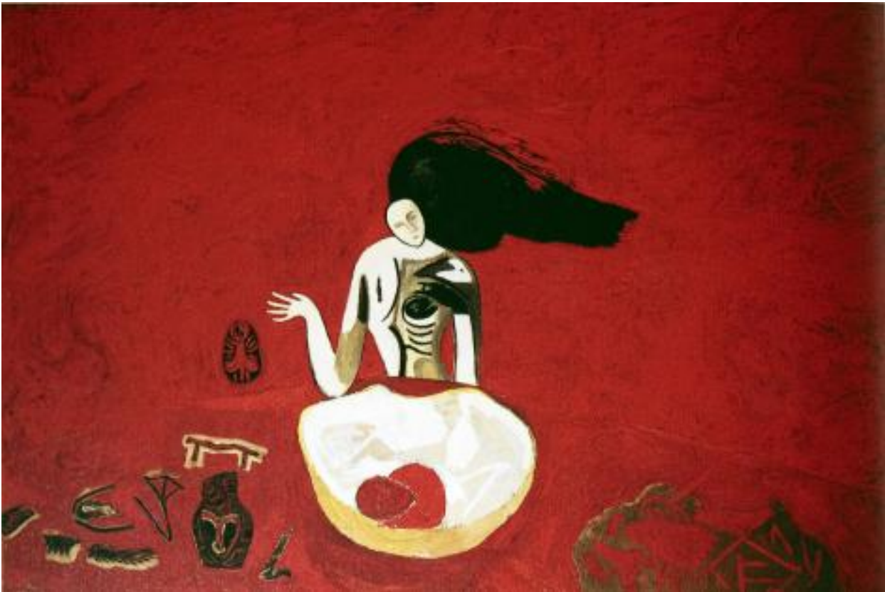
Mimmo Paladino, Senza titolo , 1982

Diversamente da questo approccio pragmatico, la congiuntura italiana appare contrassegnata sul piano filosofico ed estetico da una peculiare volontà di ripensare il modernismo alla luce obliqua di una finis Europae in cui la crisi dei paradigmi e dei criteri di razionalità modernisti scopre come un'onda di risacca il negativo, la parte maledetta, lo sfondo rimosso della vicenda otto-novecentesca. È questa infatti l'ottica di quel "pensiero debole" che dà il titolo alla fortunata antologia curata da Pier Aldo Rovatti e Gianni Vattimo nel 1983 [12] e che rappresenta il tentativo più cospicuo della cultura italiana di interrogare le trasformazioni in atto, la crisi, al tempo oramai conclamata, delle pretese universali della ragione eurocentrica e delle utopie di emancipazione, in nome di una sensibilità all'alterità, alla dimensione ermeneutica, agli aspetti simbolici e storici dei linguaggi, alimentata dal pensiero di diversi autori "continentali", specie di area germanica, da Nietzsche a Heidegger a Gadamer e Habermas.