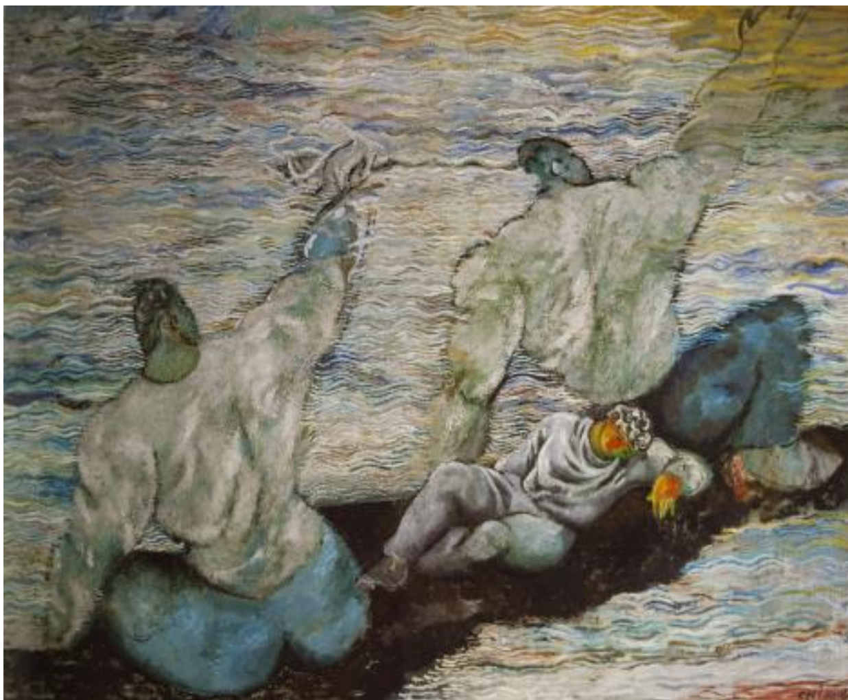
Sandro Chia, Zattera temeraria , 1982