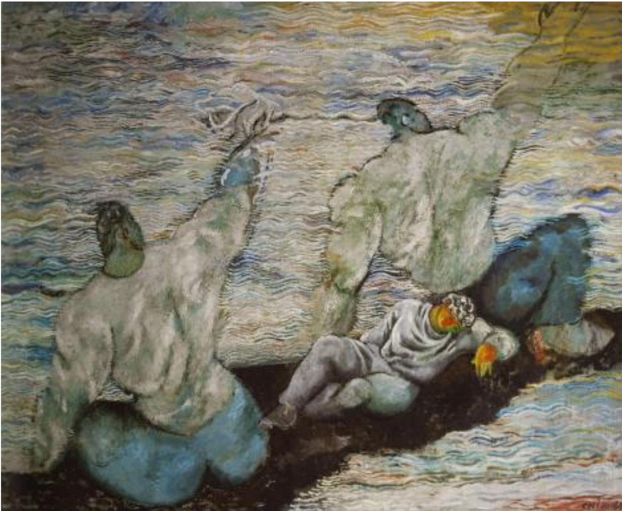
Sandro Chia, Zattera temeraria, 1982