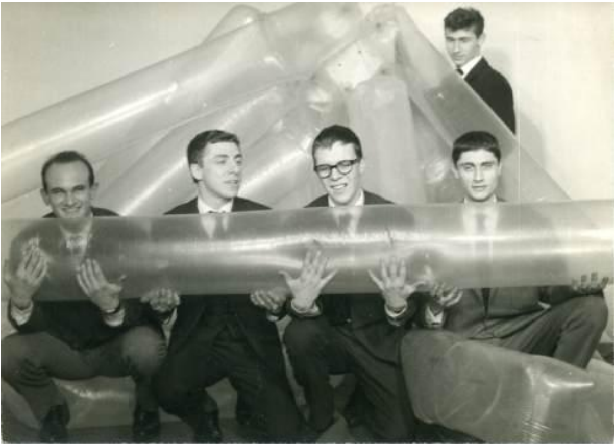
Il Gruppo T nel 1959