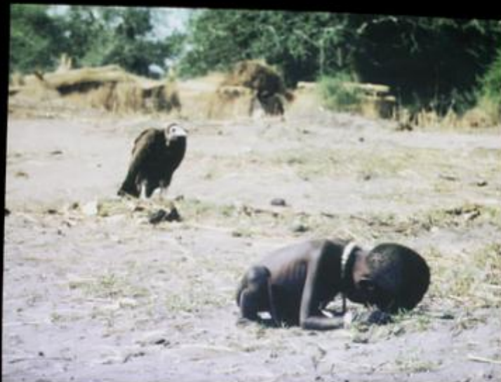
Alfredo Jaar, The sound of silence , 2006

why didn't he help the little girl, they asked