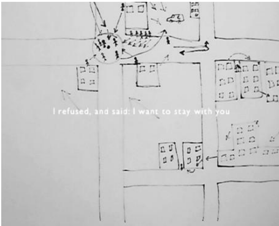
Till Roeskens, Fotogramma da Videocartographies, Aida, Palestine, 2009

Crediamo che per tenere viva la coscienza civile delle persone siano necessarie a tutti i costi fotografie che ci diano un pugno nello stomaco, che ci provochino un'emozione forte, che ci facciano piangere? Non riteniamo di avere piuttosto bisogno di fotografie (oltre che di testi e di qualunque altro mezzo) che ci permettano di riflettere in modo più profondo sul reticolo di cause e conseguenze dei fenomeni? O non possiamo fare a meno di continuare a toccare con lo sguardo la sofferenza degli altri, pretendendo che ci sia sempre qualcuno a subirla in prima persona e qualcun altro a metterla in immagine per noi?