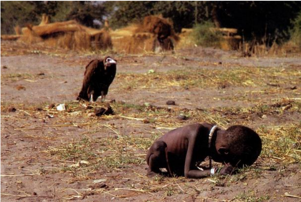
Kevin Carter, A starving Sudanese girl who collapsed on her way to a feeding center while a vulture waited nearby, 1993

Un anno dopo, a soli 33 anni, Carter decise di togliersi la vita, perseguitato dalle troppe scene di morte e violenza a cui aveva assistito e soprattutto, probabilmente, da quell'episodio, da quell'immagine. A guardarla di nuovo, riecheggia nella mente la perentoria e sconcertante domanda che Ivan Karamazov rivolge al fratello Alëša nel capolavoro di Dostoevskij. Alla prolungata sofferenza della bambina che rese possibile l'immagine, si aggiunse quella del fotografo che aveva creato la più controversa icona della fame in Africa. L'aveva fatto con il nobile intento di sensibilizzare la comunità internazionale perché intervenisse su quella situazione, ma per farlo aveva dovuto abbandonare al proprio destino quella creatura. Deve essere ancora questa, al giorno d'oggi, la missione del fotoreporter? La sua autentica efficacia è commisurata al prezzo che viene spesso pagato? La tortura psicologica che Carter si autoinflisse e il suo sacrificio sono stati davvero utili alla causa? In definitiva, per far progredire la civiltà umana è ancora necessario accettare queste condizioni?