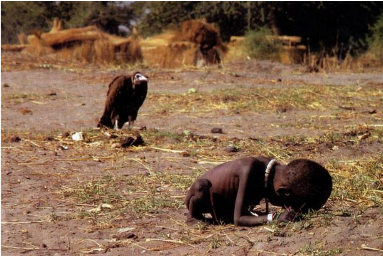
Kevin Carter, A starving Sudanese girl who collapsed on her way to a feeding center while a vulture waited nearby, 1993

possibile con lo scopo di informare l'opinione pubblica e suscitare interesse, nella speranza di cambiare lo stato delle cose e accettando, per questo, di essere spettatore della sofferenza altrui.