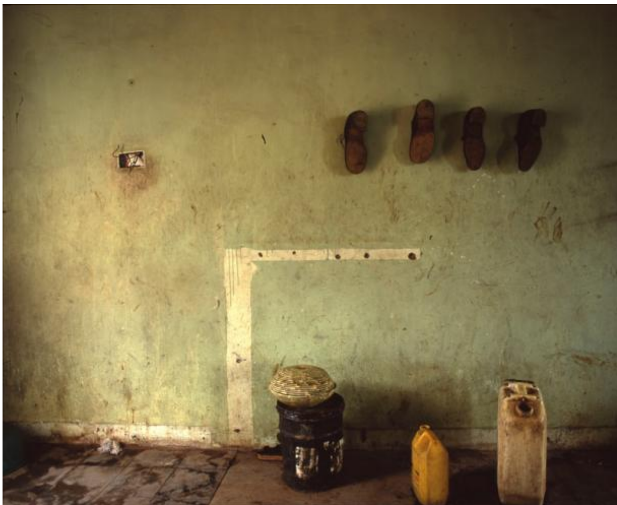
Zarina Bhimiji, Memories are trapped inside the asphalt, 1998-2003

Se continuiamo a tenere vivo questo spazio è grazie a te. Anche un solo euro per noi significa molto. Torna presto a leggerci e SOSTIENI DOPPIOZERO