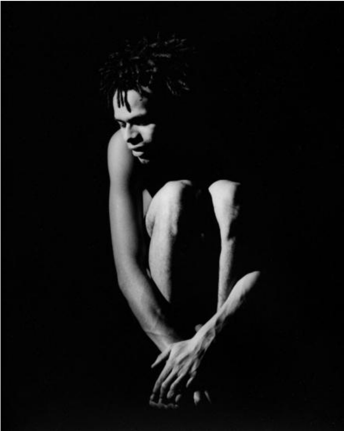
Compagnia Fanny&Alexander, "Heliogabalus"