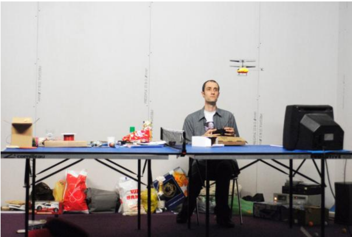
L'Effet de Serge, foto di Martin Argyrolo

Tutto avviene in un'atmosfera ovattata, con un grado di leggerezza stupefacente e un'armonia rara. Terminata ogni performance, presentata da Serge con tanto di lettura del titolo in forma ufficiale, emerge con forza uno dei campi d'indagine del lavoro di Quesne: le relazioni. Gli astanti (alcune sono comparse scelte nel luogo di spettacolo) con un soffio di voce, quasi impercettibile al pubblico, si complimentano con l'autore; Vourc'h, preciso in ogni minimo gesto, centellina le emozioni del suo Serge, il quale, imbarazzato, minimizza e ricorda agli amici di tornare fra due settimane per un nuovo spettacolo. Intanto il tempo passa, scandito da una voce fuori campo e dalle grandi pizze margherita lasciate sul tavolo.