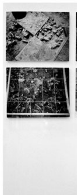
Joan Fontcuberta, fotoinstalação Retseh-cor , Rochester, 1993