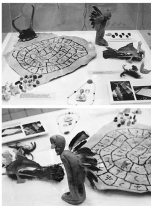
Joan Fontcuberta, fotoinstalação Retseh-cor , Rochester, 1993