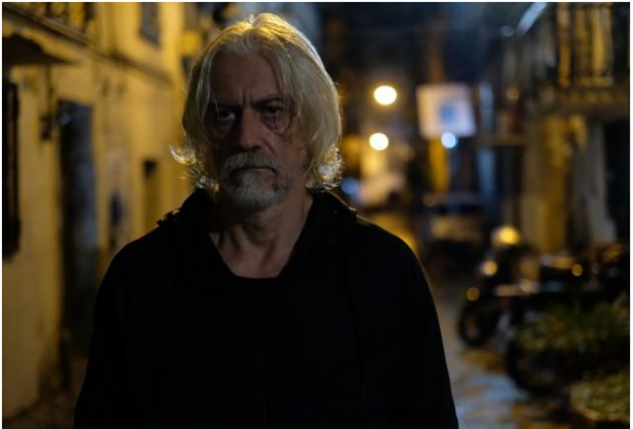
“Nostalgia”, di Mario Martone.

Anche in È stata la mano di Dio , di Sorrentino, appare un monaciello , per esempio nella scena finale, quando il protagonista decide di andare via da Napoli; ed è interessante, perché il cinema di Sorrentino e quello di