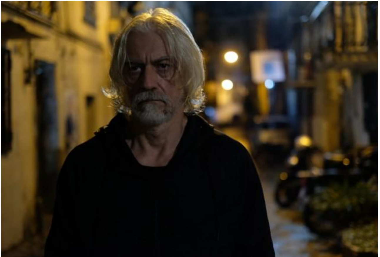
“Nostalgia”, di Mario Martone.

Anche in È stata la mano di Dio , di Sorrentino, appare un monaciello , per esempio nella scena finale, quando il protagonista decide di andare via da Napoli; ed è interessante, perché il cinema di Sorrentino e quello di