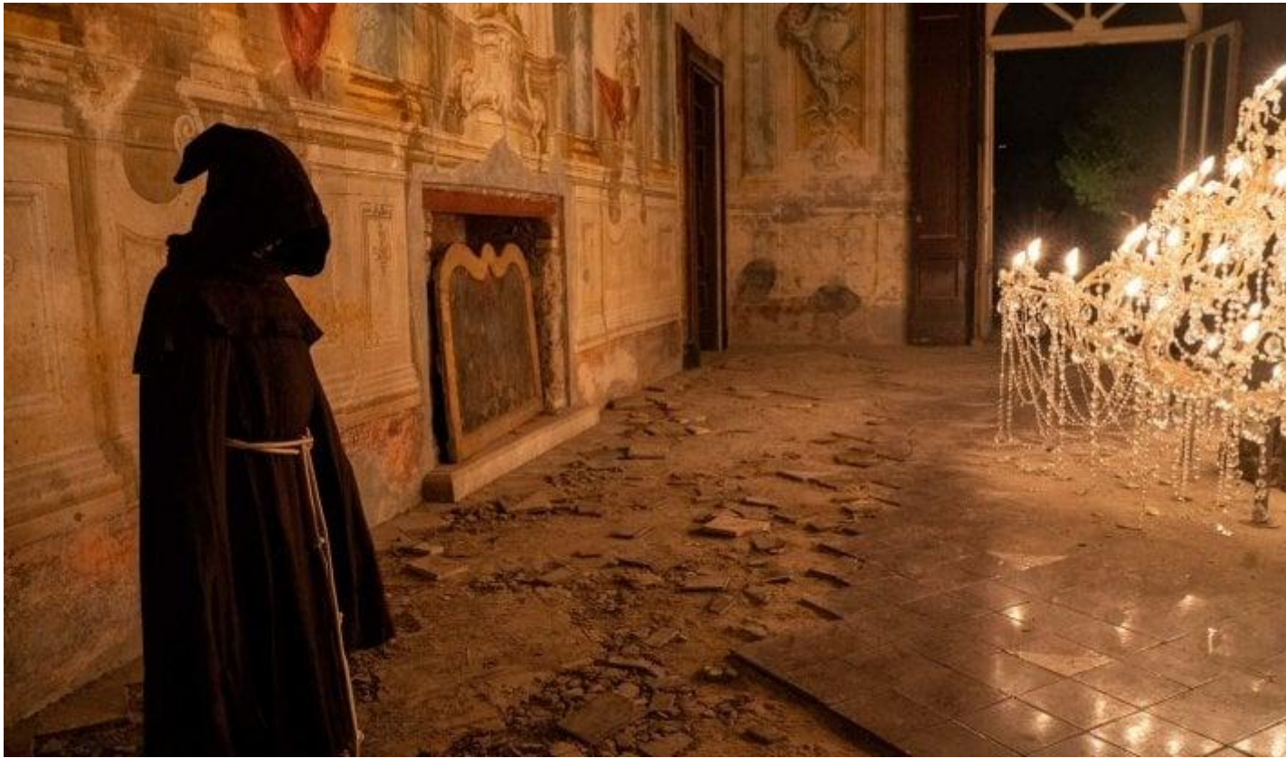
“È stata la mano di Dio”, di Paolo Sorrentino.