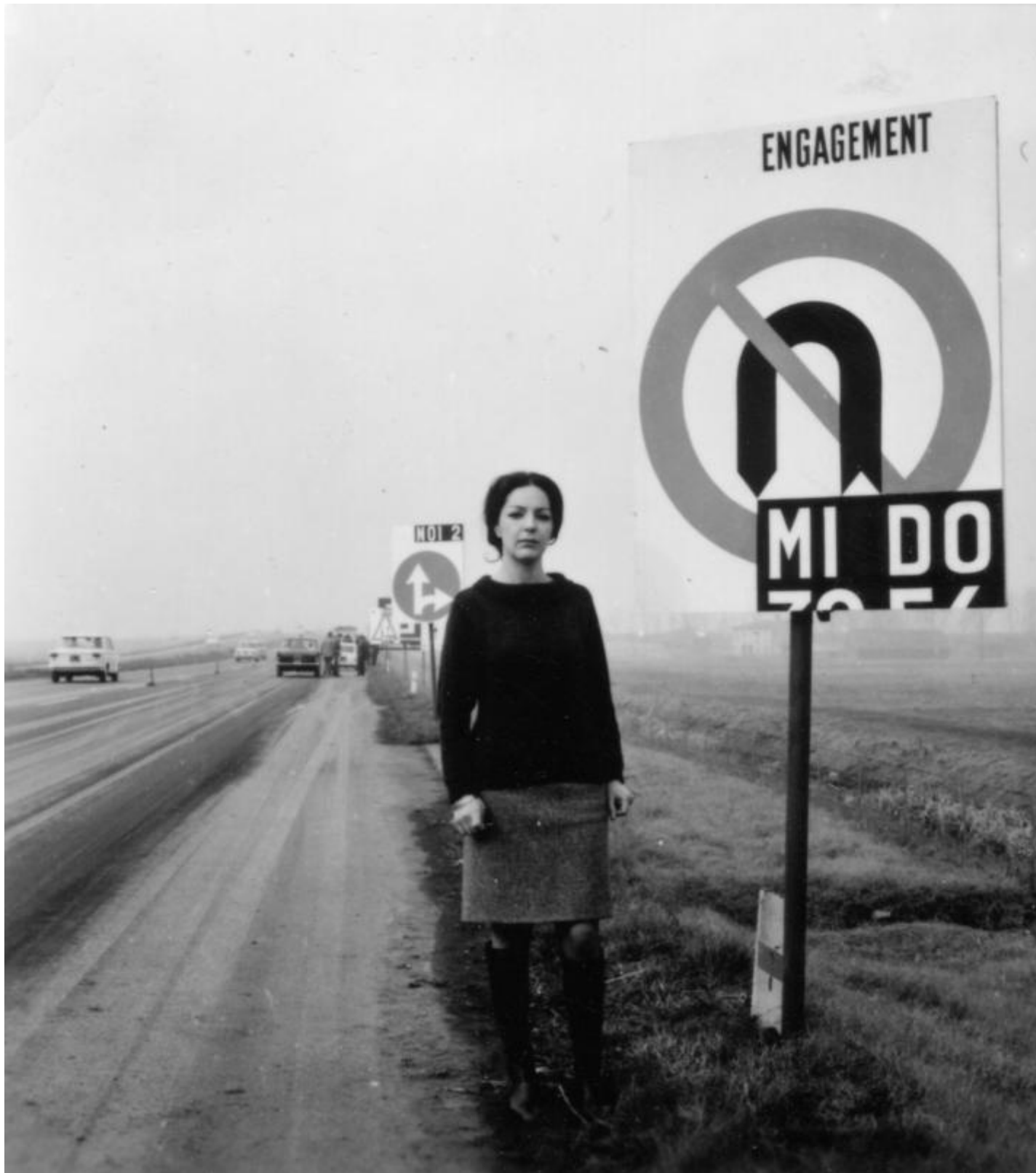
Ketty La Rocca, Fotografie dell'azione Approdo, Autostrada A1 per Firenze Nord, 1967

Il bisogno stesso di percepire qualcun altro, che comunque ci rimane intrappolato addosso, sulle dita, perché siamo noi a creare quel tu a cui rivolgersi, come chimera autogenerata dalla natura stessa dell'uomo. È una tensione irrisolvibile quella di far uscire l'altro da sé per abbandonarsi davvero e finalmente raggiungerlo, toccarlo con quelle stesse dita cui vorremmo attribuire il gesto definitivo di liberazione per poter sfiorare l'altro.