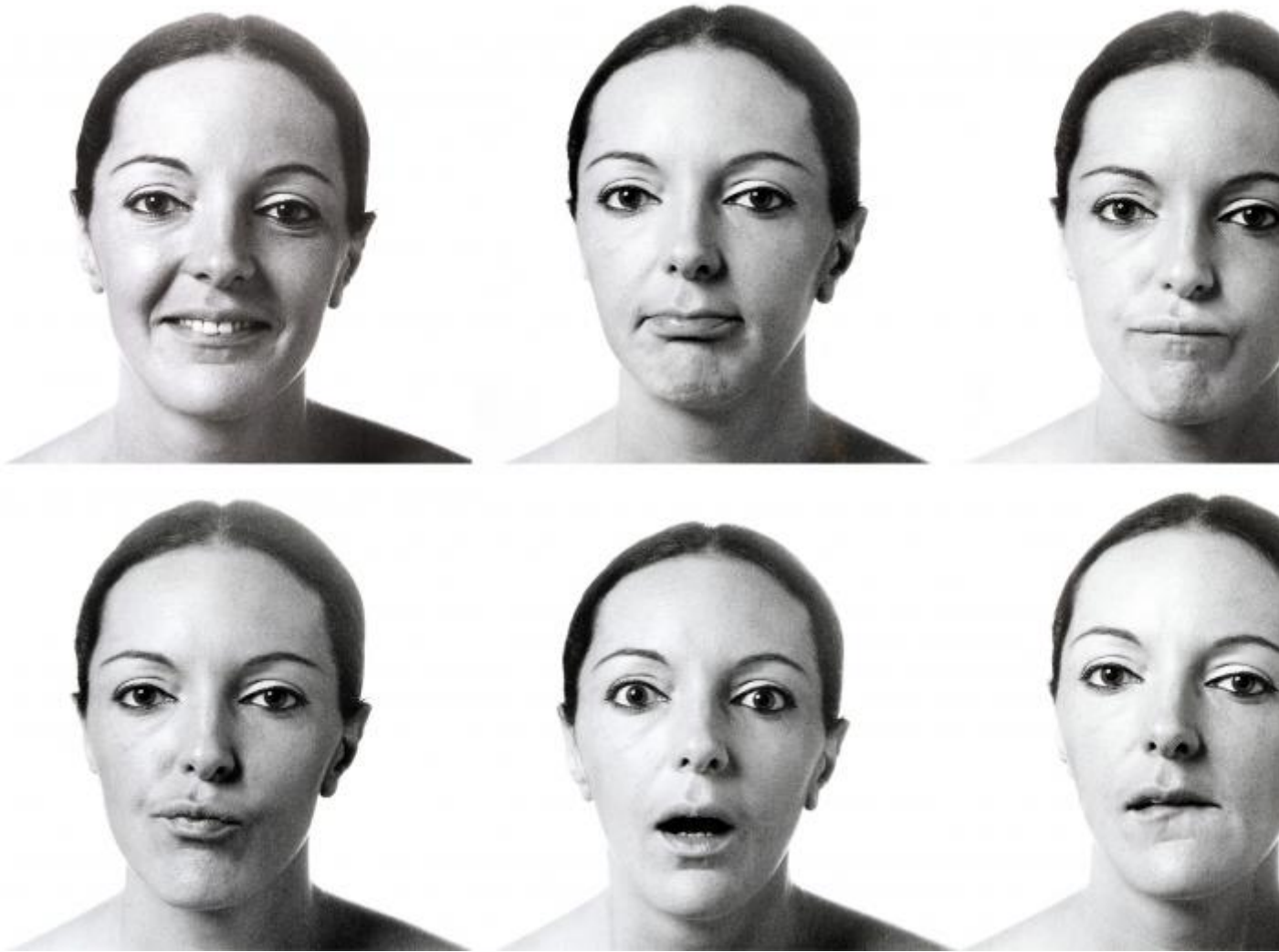
Ketty La Rocca, Senza titolo, libro d'artista, 1974 (particolare) © Archivio Ketty La Rocca | Michelangelo Vasta.

La fotografia è declinata in varie direzioni nel percorso di La Rocca: assume carattere documentativo, per quanto riguarda le immagini che registrano le performance dell'artista; performativo, quando l'artista si ritrae a letto con una sua scultura a forma di "J" iniziando a sviscerare quelle dinamiche del rapporto io-tu che tanta importanza avranno poi nella sua poetica; espressivo, sicuramente incarnando i risultati più interessanti da un punto di vista prettamente fotografico, in quanto La Rocca va a toccare con mano e disegnare letteralmente il meccanismo della visione e della comunicazione con l'altro, sentendo necessaria una radicale semplificazione del linguaggio per regredire al gesto primario del contatto, delle mani che toccano, indicano, cercano qualcuno di estraneo da sé.