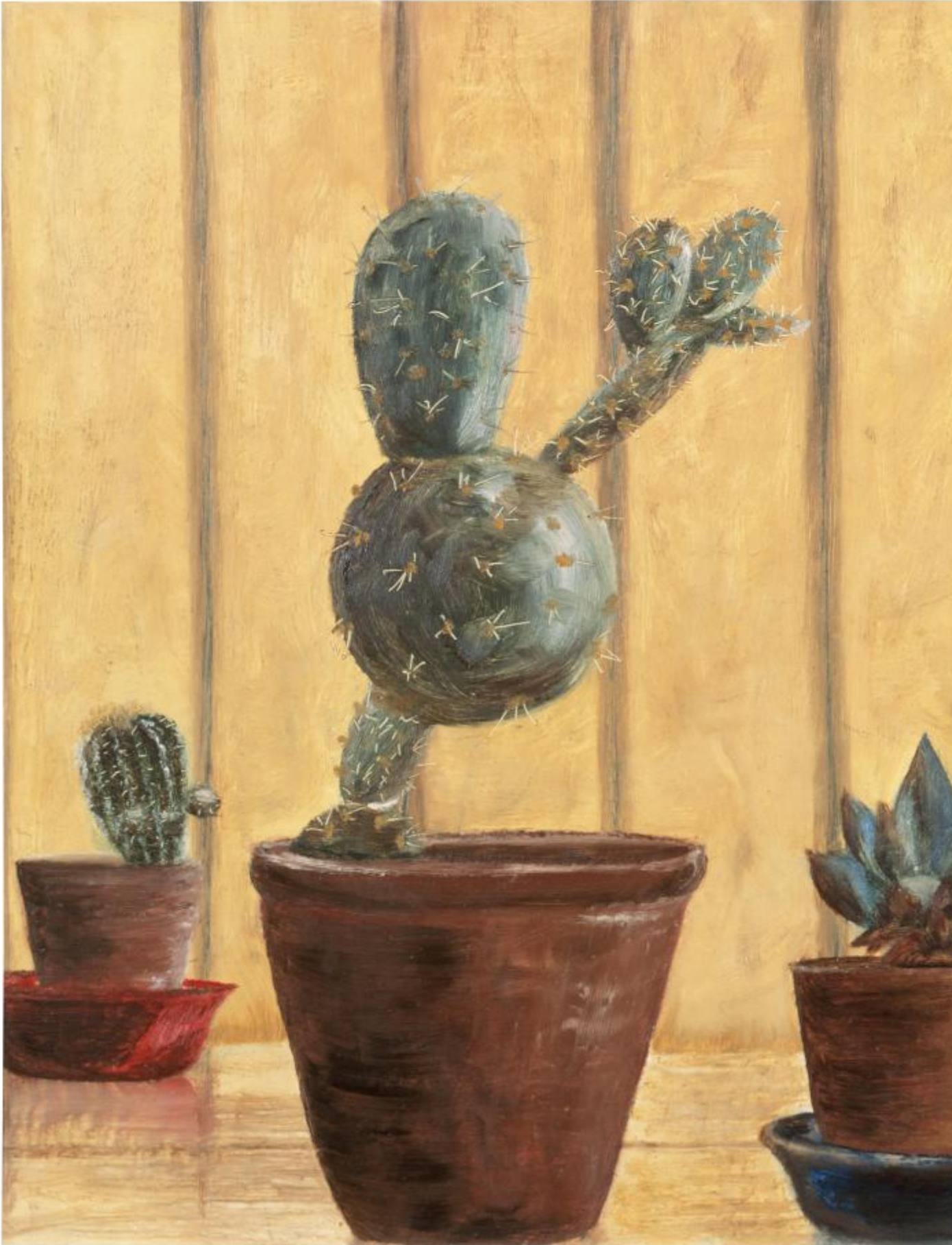
Sean Scully, Cactus, 1964, olio su tela, 33 × 27,9 cm, collezione privata