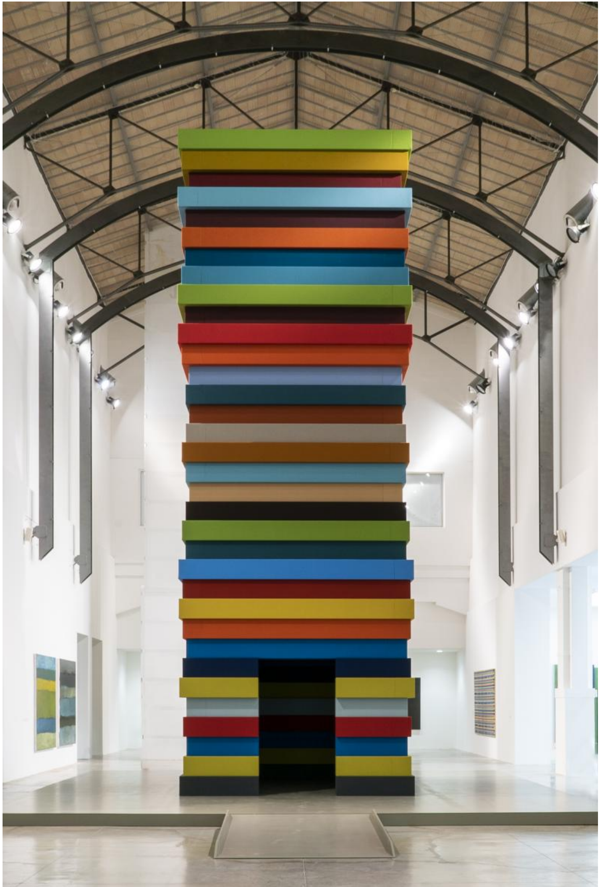
A Wound in a Dance with Love, Veduta di allestimento, MAMbo - Museo d'Arte Moderna di Bologna, 2022, Foto Ornella De Carlo.

La mostra riesce nel suo complesso a fornire allo spettatore un compendio efficace dei caratteri centrali dell'arte di Scully, delle diverse polarità che la sua