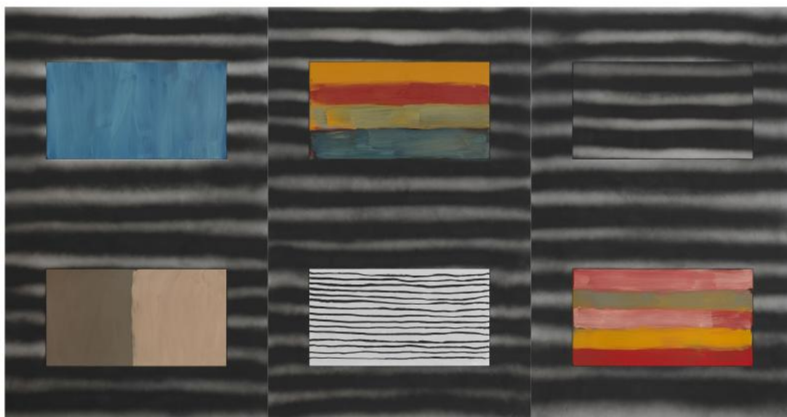
Sean Scully, Uninsideout, 2018-2020, olio, acrilico e pastello a olio su alluminio, 299,7 × 571,5 cm, Collezione Museum of Fine Arts - Hungarian National Gallery, Budapest

Una ricerca astratta in grado di dare corpo a suggestioni visive e a numerosi riferimenti – si può citare anche la serie Landline , con le sue straordinarie allusioni a motivi paesaggistici – passa anche da un lavoro peculiare sul ruolo del supporto. Due gli elementi fondamentali ad alimentare la tensione tra bidimensionalità dell'opera e la sua natura di oggetto: la pittura su alluminio, caratteristica relativamente recente nella produzione di Scully, e gli inserti. Elementi sia strutturali che linguistici, gli inserti sono senza dubbio una delle soluzioni più riconoscibili ed efficaci all'interno del vasto repertorio dell'artista irlandese.