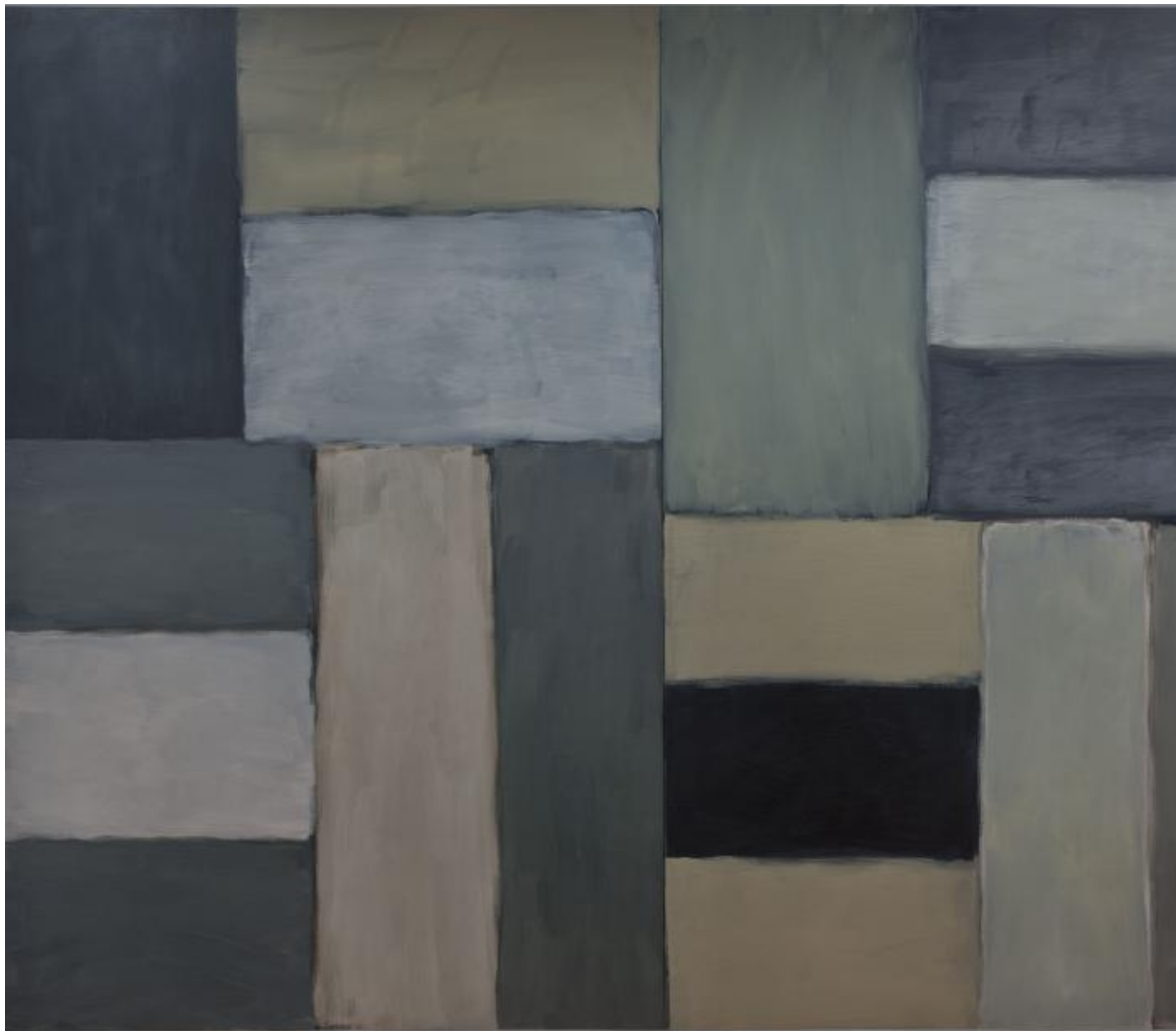
Sean Scully, Wall of Light Tundra , olio su lino, 280 × 356 cm, inv. CRT/497, proprietà della Fondazione per l'Arte Moderna e Contemporanea, CRT - in comodato presso la GAM - Galleria Civica d'Arte Moderna e Contemporanea di Torino. Su concessione della Fondazione Torino Musei. Foto di Studio Fotografico Gonella 2012.

È il genere di tensione dialettica che investe la serie Wall of Light , tra le più importanti dell'artista, dove emblematici muri di colore si presentano allo spettatore, ad un tempo, come esercizi formali e cromatici di giustapposizione di toni e modulazione della luce, e come margini, soglie di insospettabile concretezza data dall'impasto pittorico. Lavori che certo nulla hanno a che vedere con una presunta esigenza rappresentativa, quanto invece, ancora, con il superamento della griglia modernista realizzato a partire da essa, attraverso una parziale reintroduzione di un referente, unita al tentativo di annullare parte di quella tensione trascendente tipica della grande pittura e che rimane, comunque, percepibile anche nell'opera di Scully stesso.