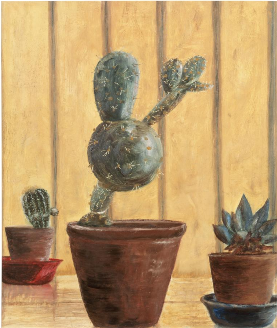
Sean Scully, Cactus, 1964, olio su tela, 33 x 27,9 cm, collezione privata © Sean Scully, immagine courtesy dell'artista.

Fino a questo punto può essere sacrosanto sostenere che il contributo dato da Sean Scully all'arte degli ultimi cinque decenni sia da ascrivere alla sua capacità di innovare la pittura astratta, affermazione senz'altro veritiera. Tuttavia, il merito forse maggiore della mostra bolognese è quello di avere offerto allo spettatore anche uno sguardo sulle polarità estreme - sia temporalmente che pittoricamente - del lavoro dell'artista.