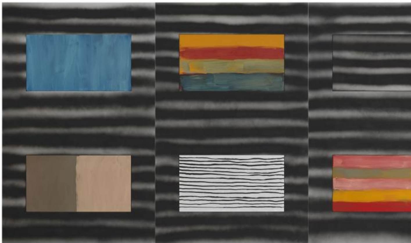
Sean Scully, Uninsideout , 2018–2020, olio, acrilico e pastello a olio su alluminio, 299,7 × 571,5 cm, Collezione Museum of Fine Arts – Hungarian National Gallery, Budapest © Sean Scully. Immagine courtesy dell'artista, foto di Gunter Lepkowski.

Una ricerca astratta in grado di dare corpo a suggestioni visive e a numerosi riferimenti – si può citare anche la serie Landline , con le sue straordinarie allusioni a motivi paesaggistici – passa anche da un lavoro peculiare sul ruolo del supporto. Due gli elementi fondamentali ad alimentare la tensione tra bidimensionalità dell'opera e la sua natura di oggetto: la pittura su alluminio, caratteristica relativamente recente nella produzione di Scully, e gli inserti. Elementi sia strutturali che linguistici, gli inserti sono senza dubbio una delle soluzioni più riconoscibili ed efficaci all'interno del vasto repertorio dell'artista irlandese.