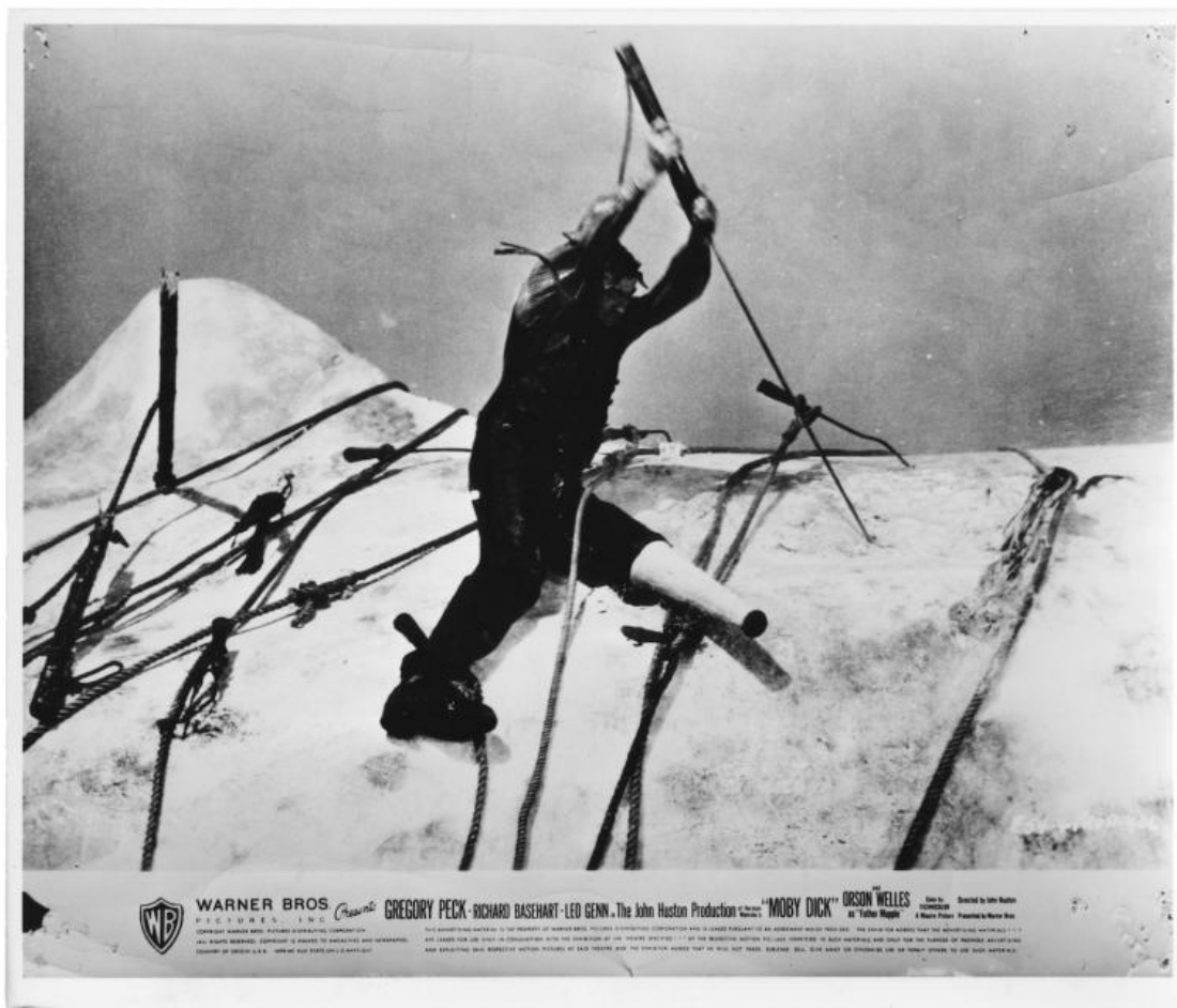
Poster promozionale del film Moby Dick, la balena bianca, regia di John Huston, 1956.

Eppure tutto quello che sono ora, quello che tutti noi siamo è passato attraverso la sua carne. Non è solo metafora!