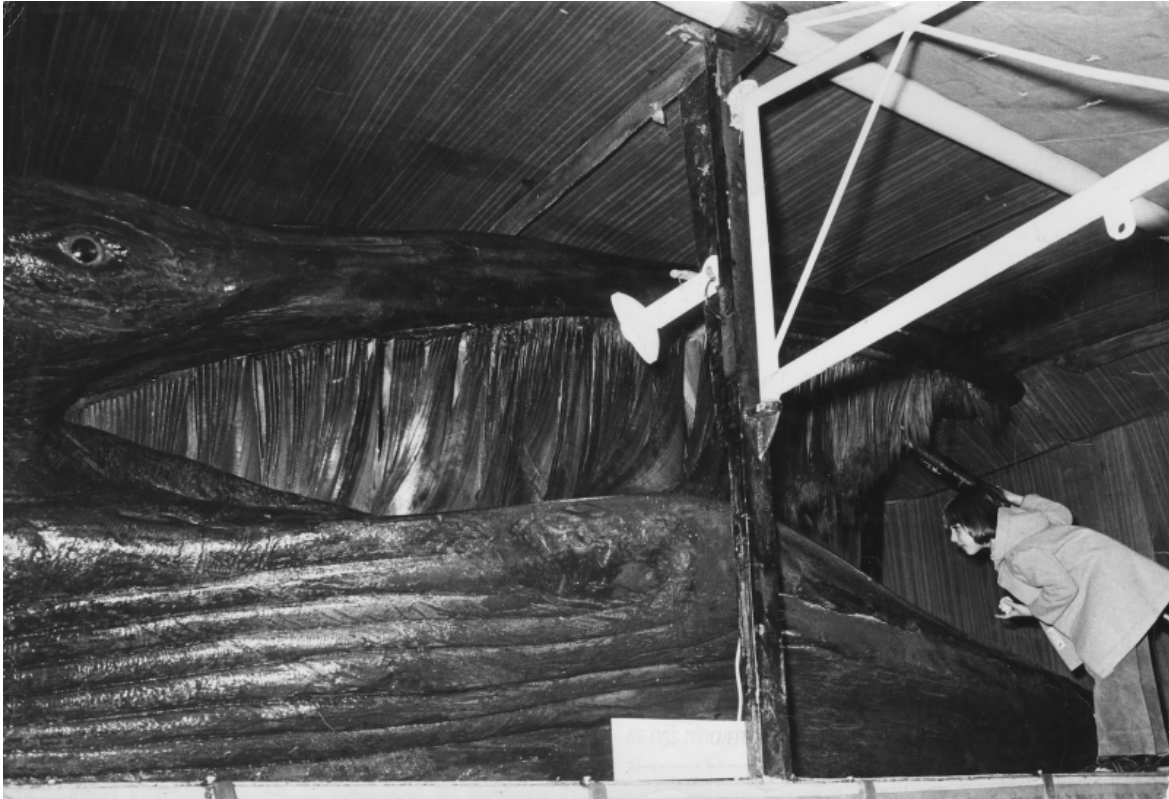
Scatto della tappa del viaggio della balena Goliath (1959-1977): una Balenottera comune di 22 metri, cacciata e imbalsamata nel 1955.

Perché una possibilità di salvezza, se mai potrà essere, passa attraverso “un’immaginazione basata sulla scienza che consenta di comprendere meglio il mondo sensoriale delle altre specie e di valutare la vera estensione del mutamento ambientale da prospettive alternative alla nostra”, senza lasciarsi schiacciare dalla paura per la perdita esponenziale di biodiversità in atto.