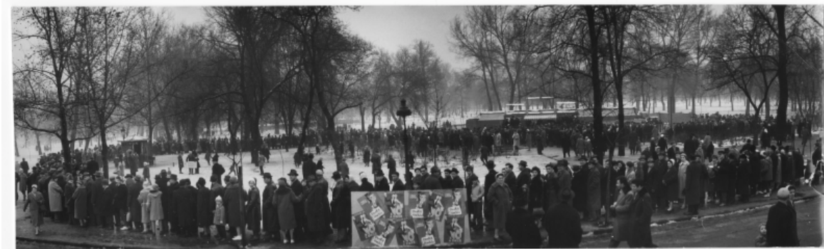
Scatto della tappa del viaggio della balena Goliath (1959-1977): una Balenottera comune di 22 metri, cacciata e imbalsamata nel 1955.

Un essere troppo grande per morire facilmente (anche a causa del suo sistema nervoso centrale così vasto le cui parti si spengono solo un po' alla volta), destinato a soffocare sotto il suo stesso peso, "a bruciare" sotto lo strato di grasso che serve da protezione nei mari più gelidi. Quando non è possibile issarne il corpo e portarlo a largo, perché affondi naturalmente, o lo si smembra e seppellisce, lo si brucia come rifiuto tossico oppure, se la carcassa si è incagliata tra le rocce, si usa dell'esplosivo. Un fuoco d'artificio di carne, grasso, ossa. E non solo, probabilmente: frammenti di microplastiche e materiali di scarto di ogni tipo, ciabatte infradito, vasetti di yogurt, una serra volata in mare da chissà dove, grovigli mostruosi di reti e galleggianti.