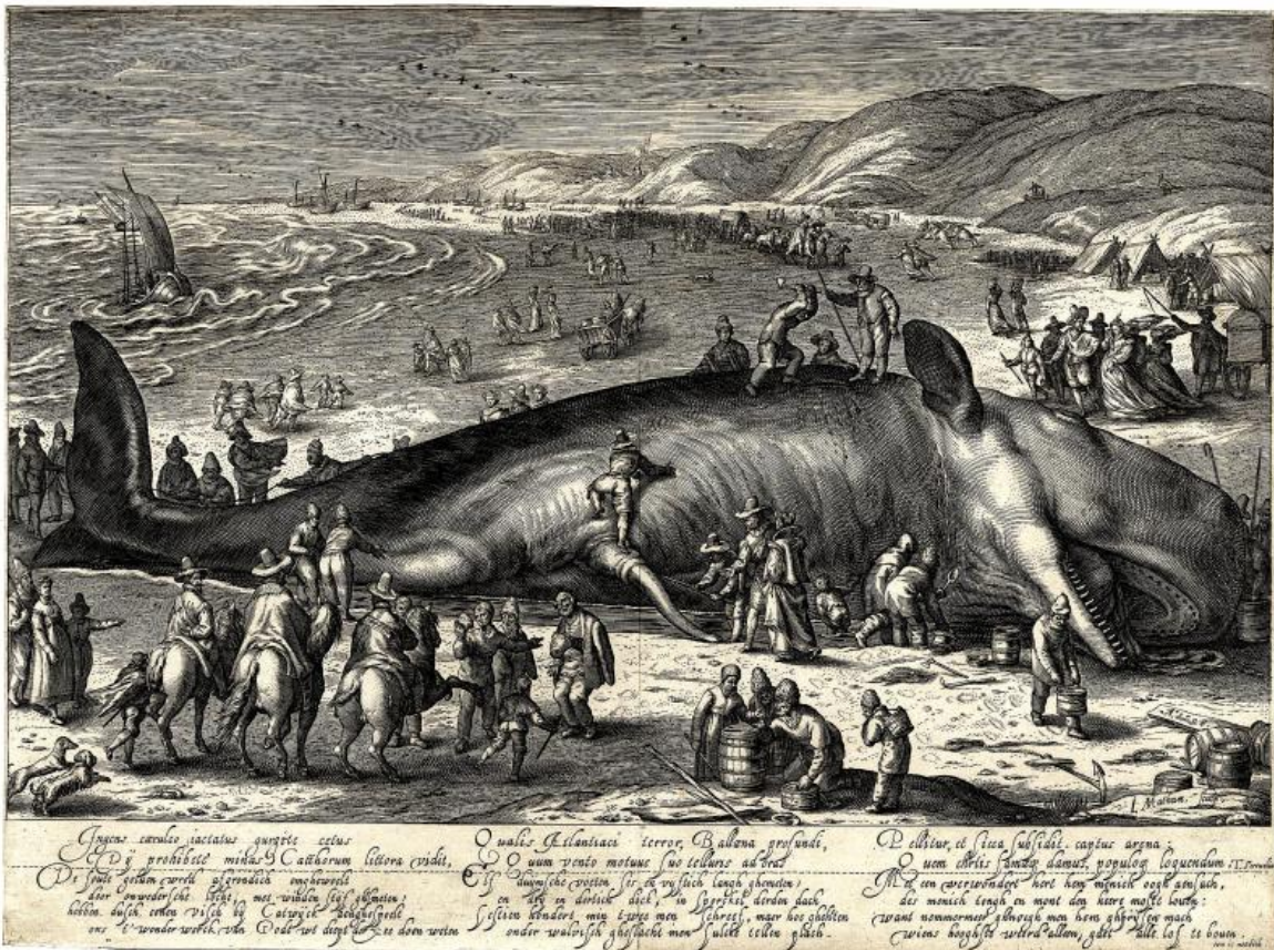
Jacob Matham after Hendrick Goltzius, The Beached Sperm Whale near Berkhey, 1598, 318 x 428 mm, Engraving, Atlas Van Stolk, Rotterdam.