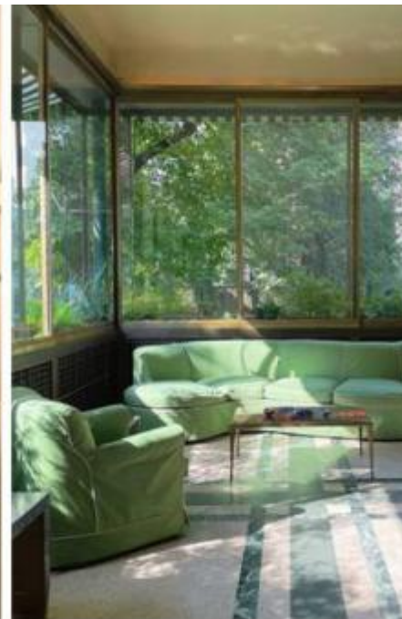
Tomaso Buzzi, risistemazione degli arredi di Villa Necchi Campiglio a Milano, effettuata a partire dal 1938. A sinistra, il Fumoir, a destra il Giardino d'Inverno.