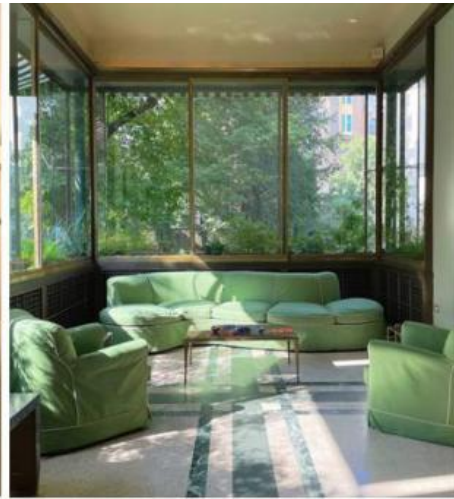
Tomaso Buzzi, sistemazione degli arredi di Villa Necchi Campiglio a Milano, effettuata a partire dal 1938. A sinistra, il Fumoir, a destra il Giardino d'Inverno.