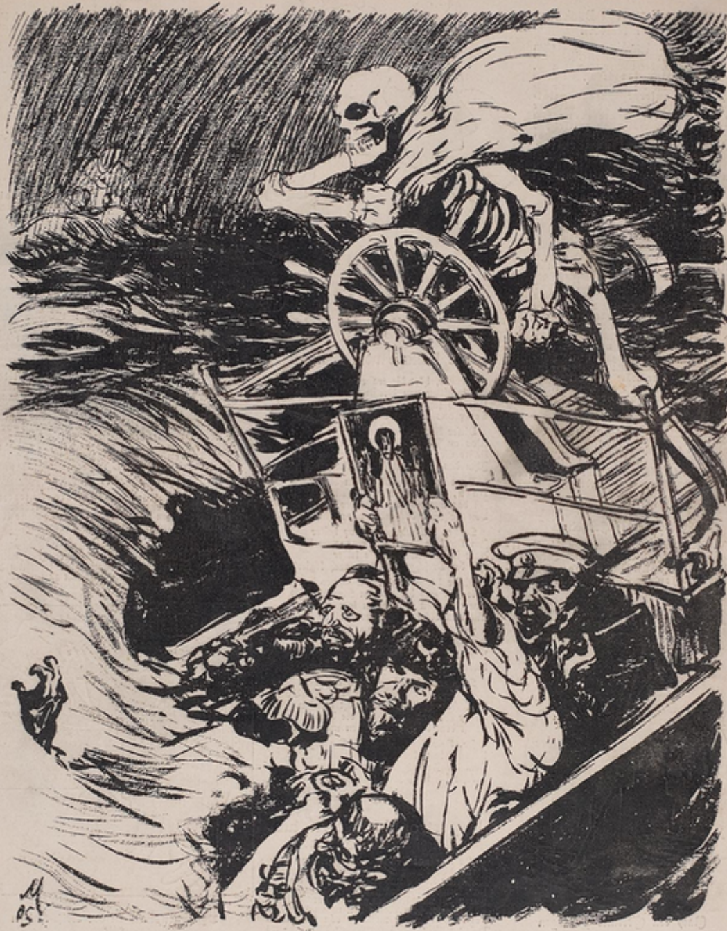
Das russische Staatschiff