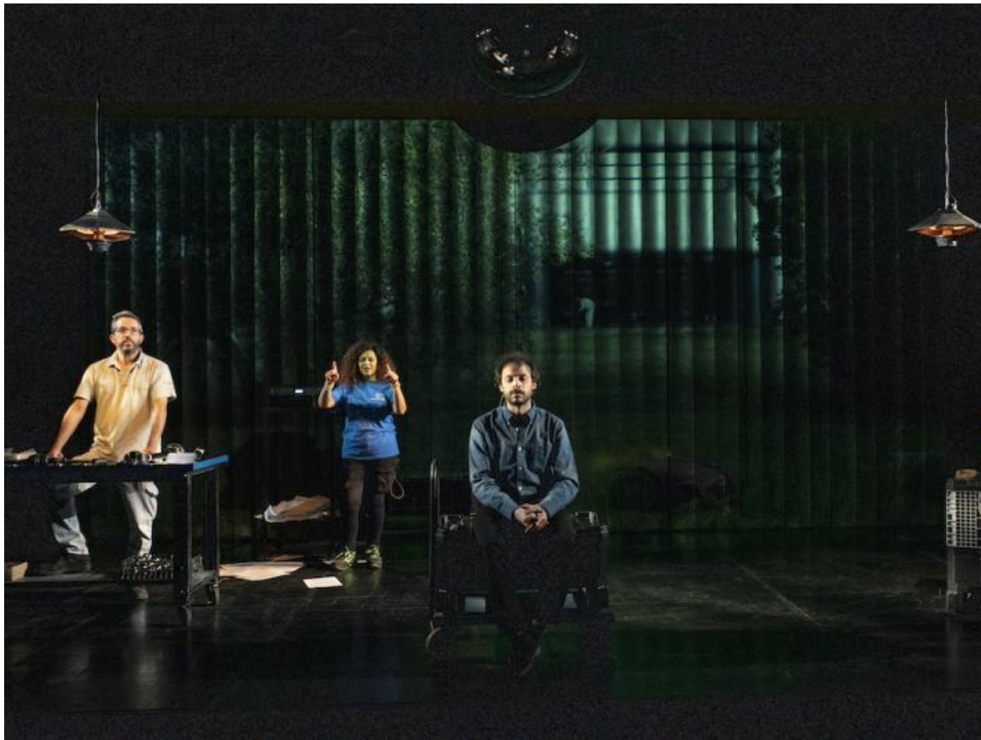
Il Capitale, di Kepler-452