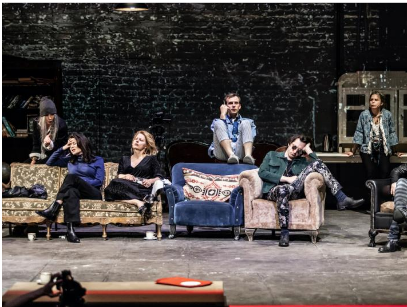
Imagine , di Krystian Lupa, foto NK.

Se comincio dalla fine, cioè da Imagine di Krystian Lupa, è perché l'ultimo spettacolo andato in scena a Vie Festival mi è parso un manifesto perfetto, un ordinato compendio dei sentimenti che pervadono quasi tutte le opere ospitate nell'edizione 2022 della rassegna internazionale organizzata da Ert Fondazione nei suoi teatri emiliani. Uno specchio abbastanza fedele di quel che si vede sui maggiori palcoscenici internazionali, beninteso. Come stiamo? Persi, sconcertati, soli, arrabbiati, impotenti. In ogni caso male, incagliati dentro un mondo che pare completamente fuor di sesto. Un paradigma di senso, di spirito, di umore.