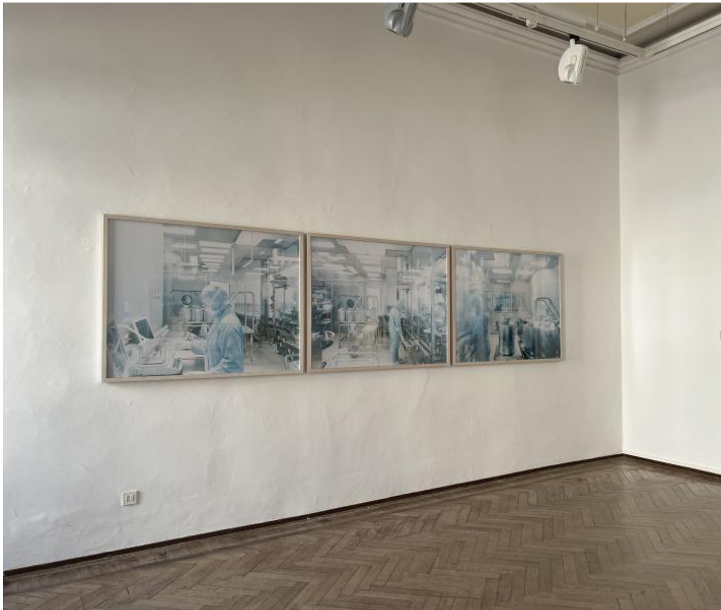
Walter Niedermayr, Raumfolgen 238 , 2007

SC: Walter, nel tuo percorso hai fotografato spazi naturali alterati dall'intervento umano e molti luoghi chiusi, laboratori, caveaux di banche, ospedali, prigioni. Marina, tu hai invece lavorato sulla città, sugli interni quotidiani e sulle relazioni interpersonali, sempre osservati con uno sguardo attento ai dettagli rimossi, non visti. Per entrambi è evidente una forte carica critica nei confronti delle istituzioni e dell'ordine apparente del mondo. In qualche modo l'orto del carcere a Venezia è un luogo emblematico per voi. Mi chiedo, nel suo insieme questo progetto contiene un intento politico, liberatorio, utopico, o piuttosto è concentrato sul tempo e lo spazio interiore, quello delle detenute e il vostro?