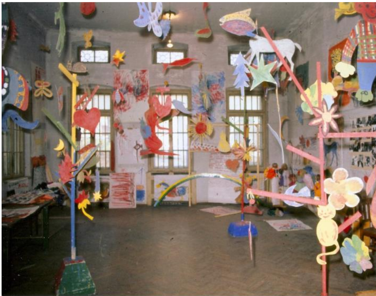
Foto Scabia Manifesto 4, Laboratorio P Ospedale psichiatrico di Trieste, 1973.

Marco, essendo una meravigliosa creatura dell'immaginario, è abituato a dialogare con gli umani: una prima preghiera la indirizzò al presidente dell'Amministrazione provinciale di Trieste nel 1972, quando era ancora un animale di carne e ossa e incombeva su di lui la minaccia di essere macellato. Chiedeva un dignitoso "pensionamento" nella struttura per "meriti lavorativi". E lo ottenne. In cambio i pazienti si impegnavano a pagare per il suo mantenimento.