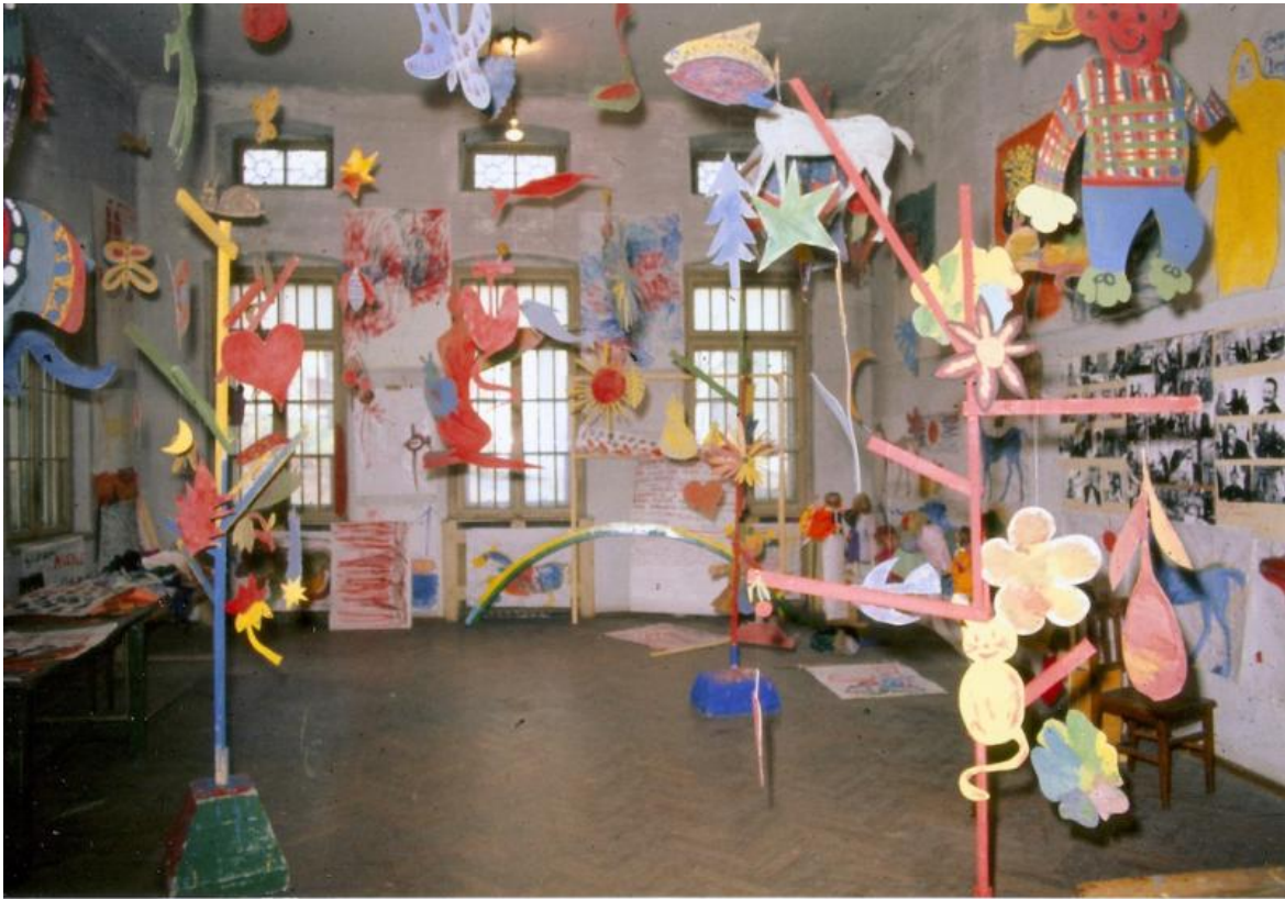
Foto Scabia Manifesto 4, Laboratorio P Ospedale psichiatrico di Trieste, 1973.

Marco, essendo una meravigliosa creatura dell'immaginario, è abituato a dialogare con gli umani: una prima preghiera la indirizzò al presidente dell'Amministrazione provinciale di Trieste nel 1972, quando era ancora un animale di carne e ossa e incombeva su di lui la minaccia di essere macellato. Chiedeva un dignitoso "pensionamento" nella struttura per "meriti lavorativi". E lo ottenne. In cambio i pazienti si impegnavano a pagare per il suo mantenimento.