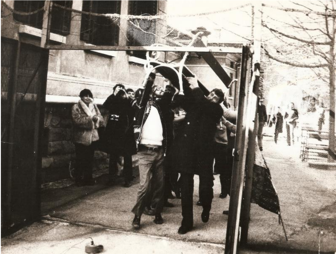
Foto Scabia Manifesto 4, Laboratorio P Ospedale psichiatrico di Trieste, 1973.

Di quello che è successo si è parlato parecchio negli ultimi giorni, con articoli di giornale, con appelli pubblici. Il sindaco leghista di Muggia è colui che ha definito “un ingombro” la scultura. E in parte non possiamo che dargli ragione: le icone, le immagini profonde, gli archetipi hanno il compito di ingombrarci la coscienza, di rovistarci dentro, di aprire le dimensioni più segrete dell’Io e della socialità.