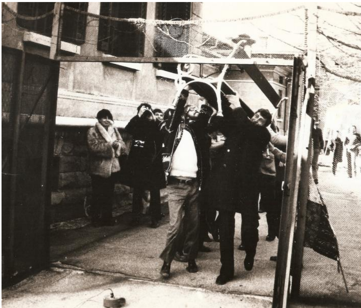
Foto Scabia Manifesto 4, Laboratorio P Ospedale psichiatrico di Trieste, 1973.

Di quello che è successo si è parlato parecchio negli ultimi giorni, con articoli di giornale, con appelli pubblici. Il sindaco leghista di Muggia è colui che ha definito “un ingombro” la scultura. E in parte non possiamo che dargli ragione: le icone, le immagini profonde, gli archetipi hanno il compito di ingombrarci la coscienza, di rovistarci dentro, di aprire le dimensioni più segrete dell’Io e della socialità.