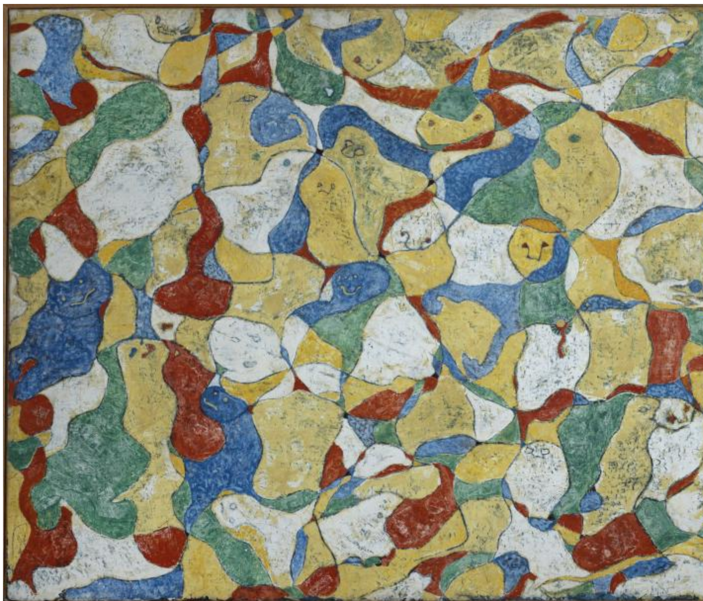
La festa a Seillans, 1964.

Ma Ernst aveva compreso che ad essere in gioco era un vero e proprio cambio di passo, di sensibilità, un pensiero visivo e un sentire inediti, che non potevano e non possono essere ridotti all'immaginazione e al simbolismo, alla malinconia e all'erotismo. Bisognava porsi "oltre", "al di là", appunto. Dada aveva segnato il punto di passaggio, la rimessa in discussione di ogni fondamento presunto e la riconsiderazione del rapporto tra gli opposti e di nozioni come quelle di caso e di creatività, ma occorreva attuare una vera e propria "transvalutazione", come pensatori quali Schopenhauer, Nietzsche e Freud avevano indicato, aggiornata e realizzata in termini ulteriormente contemporanei.