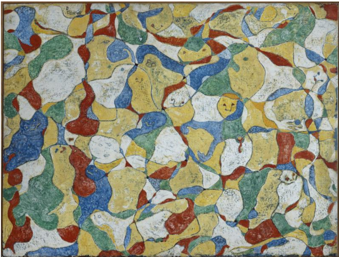
La festa a Seillans, 1964.

Perché insisteva tanto nel parlare di “oltre la pittura” – come intitola il suo testo più importante, riportato anche in catalogo – e nel negare la figura dell’autore e del genio? L’esatto contrario di Salvador Dalì, in realtà ultimo arrivato nel gruppo, ma che proprio con quel suo atteggiamento attirava un’attenzione che nessun altro riscuoteva. A volte Ernst era affascinante al massimo, con le sue invenzioni come gli accostamenti nei collage, incongrui e misteriosi ma suggestivi e iconici, specie all’inizio con gli indimenticabili Elefante Célèbes o Santa Cecilia o appunto Edipo Re , e anche con i frottage e grattage più elaborati, come la Toilette della Sposa e gli incredibili paesaggi dell’ Europa dopo la pioggia . Ma poi diventava sconcertante con collage indecifrabili, frottage apparentemente facili e casuali, uccelli moltiplicati, figure scarabocchiate, paesaggi abbozzati, “mosche non euclidee”... Non andava a suo scapito quel ribadire ad ogni occasione che lui non era che uno “spettatore” del venire alla luce dell’immagine?