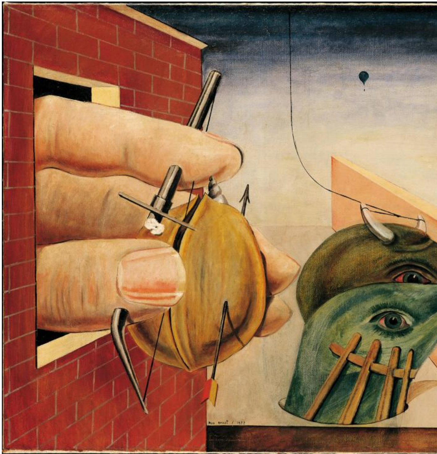
Oedipus Rex, 1922.

Bisogna affrontare in questo modo un artista surrealista, tanto più l'artista surrealista per eccellenza – checché ne dica Salvador Dalì e nonostante i litigi fino all'espulsione dal gruppo da parte dello stesso Breton. È ormai una leggenda l'arrivo della cassa con i primi collage, 1921, che saranno esposti alla galleria Au Sans Pareil, dando il via alla ricerca di una teoria che diventi quella del passaggio dal Dadaismo al Surrealismo. Con quali ingredienti e tonalità? Lo si coglie subito all'entrata della mostra a Palazzo Reale: già sulla soglia d'ingresso ci si presenta di fronte Oedipus Rex . È uno dei capolavori dell'anno seguente, 1922, quando Ernst ha già capito dove andare: il collage non è una tecnica, è una forma del pensiero, l'incontro di elementi incongrui che creano legami di senso ed effetti di meraviglia, di senso "metafisico", come ha appreso da de Chirico, e di meraviglia trasfigurativa del reale, cioè surreale, "convulsiva", secondo la formula di Breton.