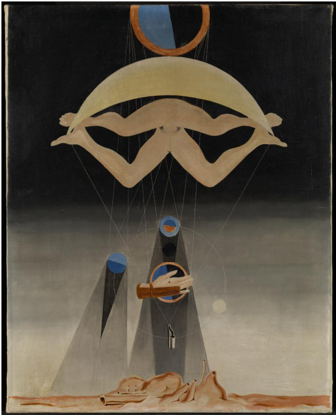
Gli uomini non ne sapranno nulla, 1923 .

Entriamo dunque con questo spirito nella mostra e nel mondo di Ernst, così vario in realtà da aver messo a disagio a lungo i critici e il mercato, eppure così coerente e conseguente da non aver fatto esitare un attimo l'artista sulla sua strada. La varietà non piace al mercato, eppure non è segno di grande creatività? È la ragione stessa del tardo riconoscimento arrivato a Ernst dopo decenni in cui, pur esponendo ed essendo già famoso, non vendeva un quadro. Si veda la sua autobiografia, peraltro appena pubblicata dall'editore Abscondita, Note per una biografia - scritta in terza persona - con tutte le illustrazioni dell'originale, parte delle quali troviamo qui in mostra. E lo dice a chiare lettere il suo maggiore