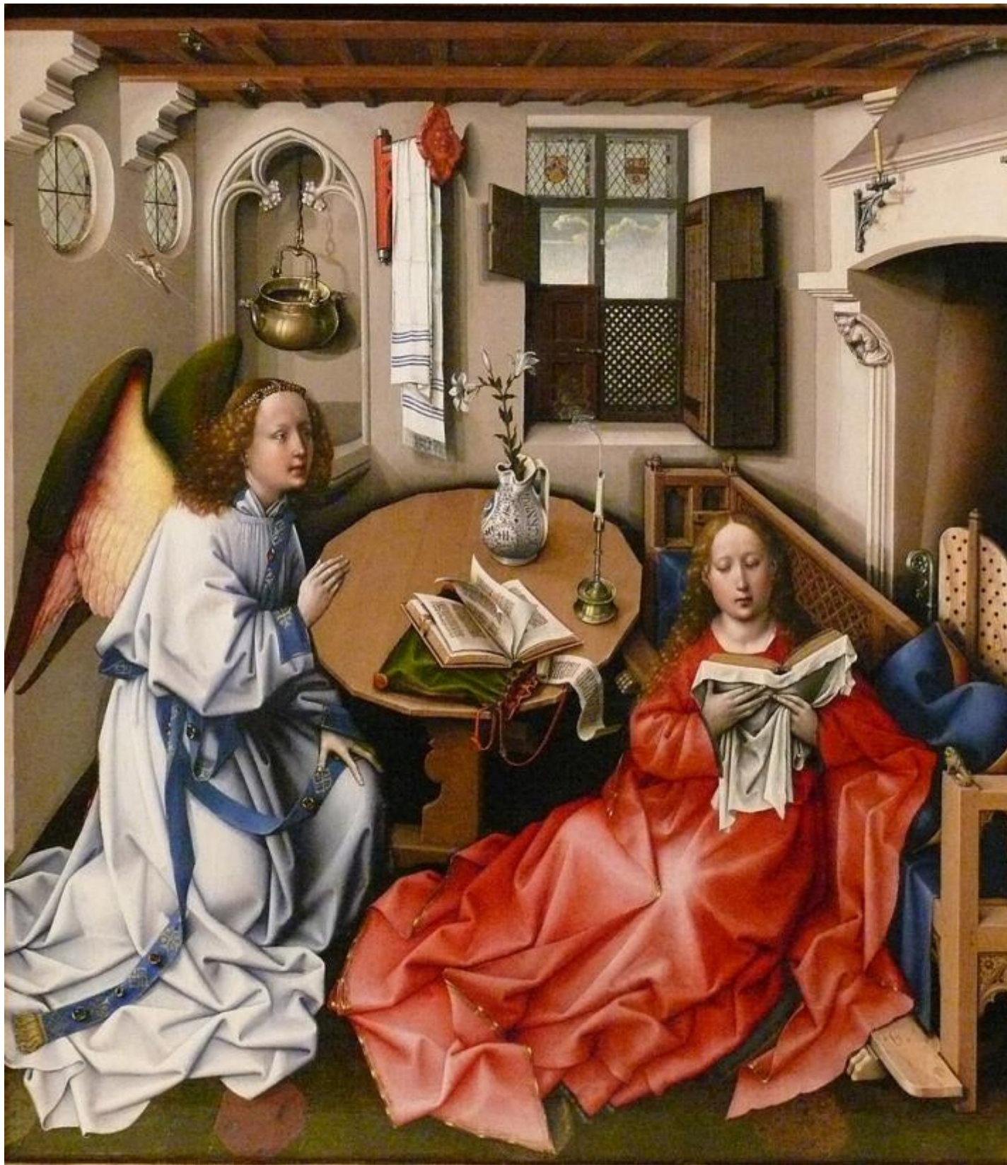
Robert Campin e aiuto, Annunciazione del Trittico Mérode, c. 1430. New York, Metropolitan Museum of Art.

“Amate ciò che non udirete mai due volte”: se parlare è un gesto, ne deriva il ruolo primario della voce umana, che realizza sempre un “incessante rinnovamento di vita”. Jousse arriva a chiedersi se “ci sarà una resurrezione della voce così come ci sarà una resurrezione della carne”.