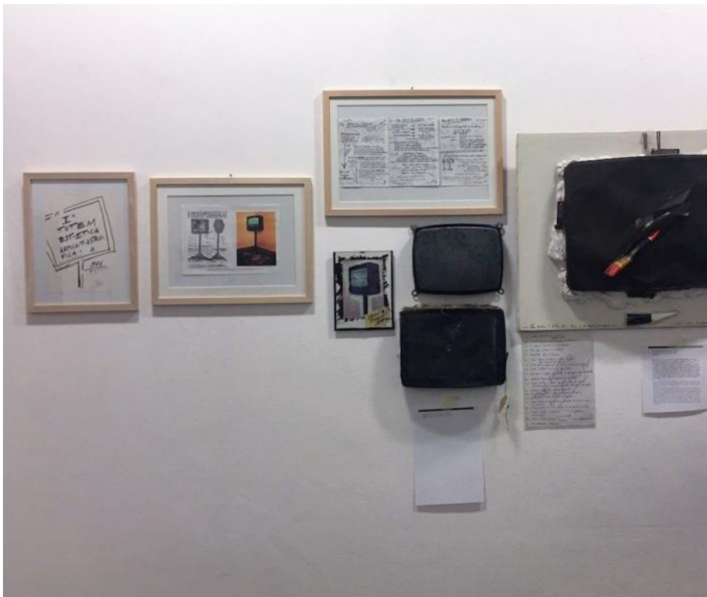
La sequenza del Totem Estetica Cata-stro-fica e la tv squarciata dal pennello al Festival di Narni il 10 dicembre 1986, giorno del suo trentesimo compleanno, ph. V. Albini.

Siamo investiti dall'energia di quell'ormai lontano mondo tecnomilitante e di quell'arte mediattivista che ha tentato di scavalcare domini, economie e culture negli anni Novanta e Duemila, creando pratiche artiviste dal basso e firmando manifesti a cui Verde credeva profondamente, facendosi portavoce di slogan hacker che erano il suo lasciapassare per il mondo: tutta la tecnologia al popolo, condividere saperi tecnologici. Che la lotta era a far vincere le idee e non le tecnologie era chiaro a quegli artisti artivisti che avevano creato addirittura la prima televisione interattiva dentro un centro sociale a Milano e poi al Festival di Santarcangelo.