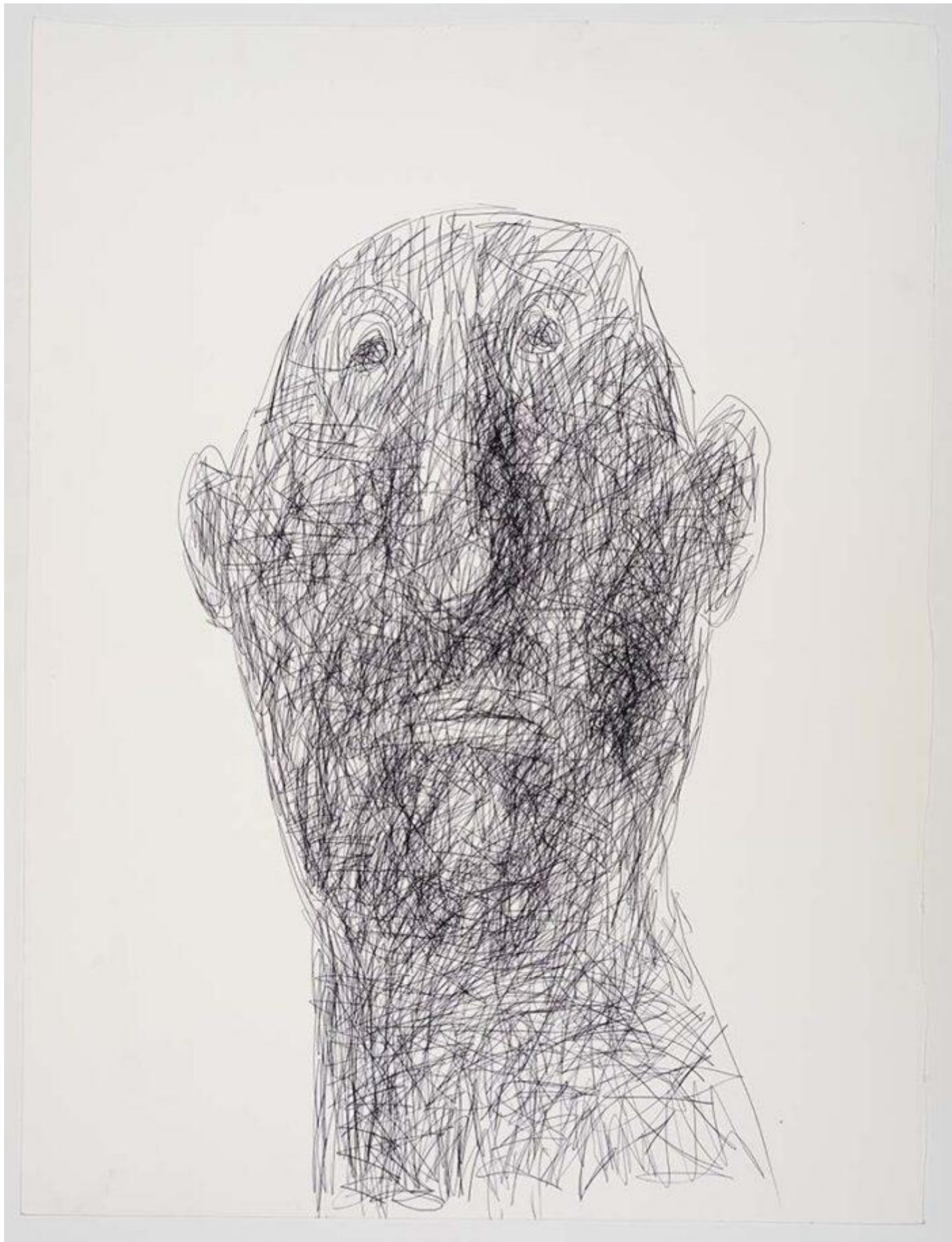
Biro Head, 2022.

La parte finale del saggio è interamente dedicata al lavoro artistico di Blake, al suo impegno quotidiano nello studio inesauribile di tecniche, forme, figure, al servizio di un immaginario che ha al centro la figura umana e