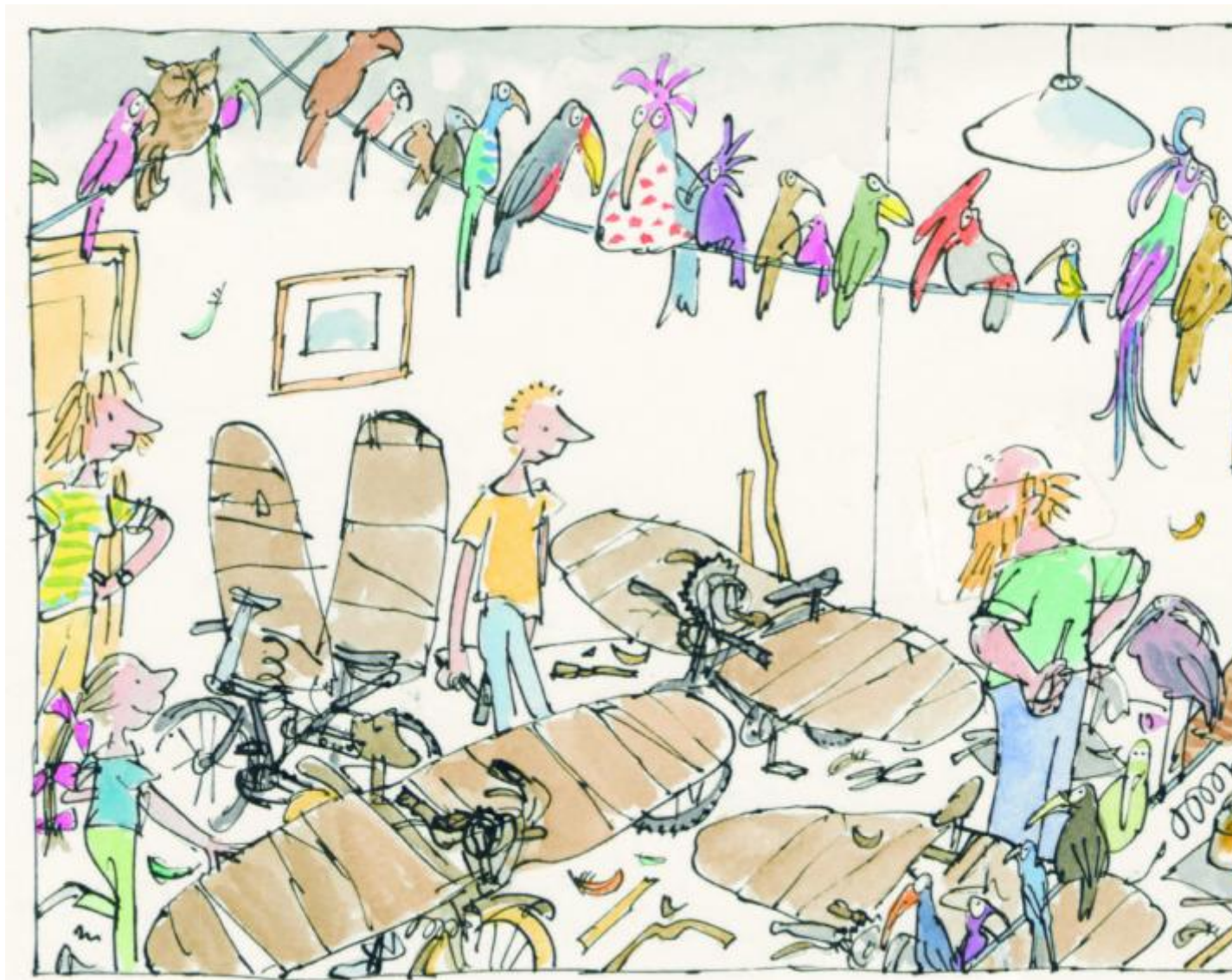
Su nel cielo con gli uccelli, 1995.