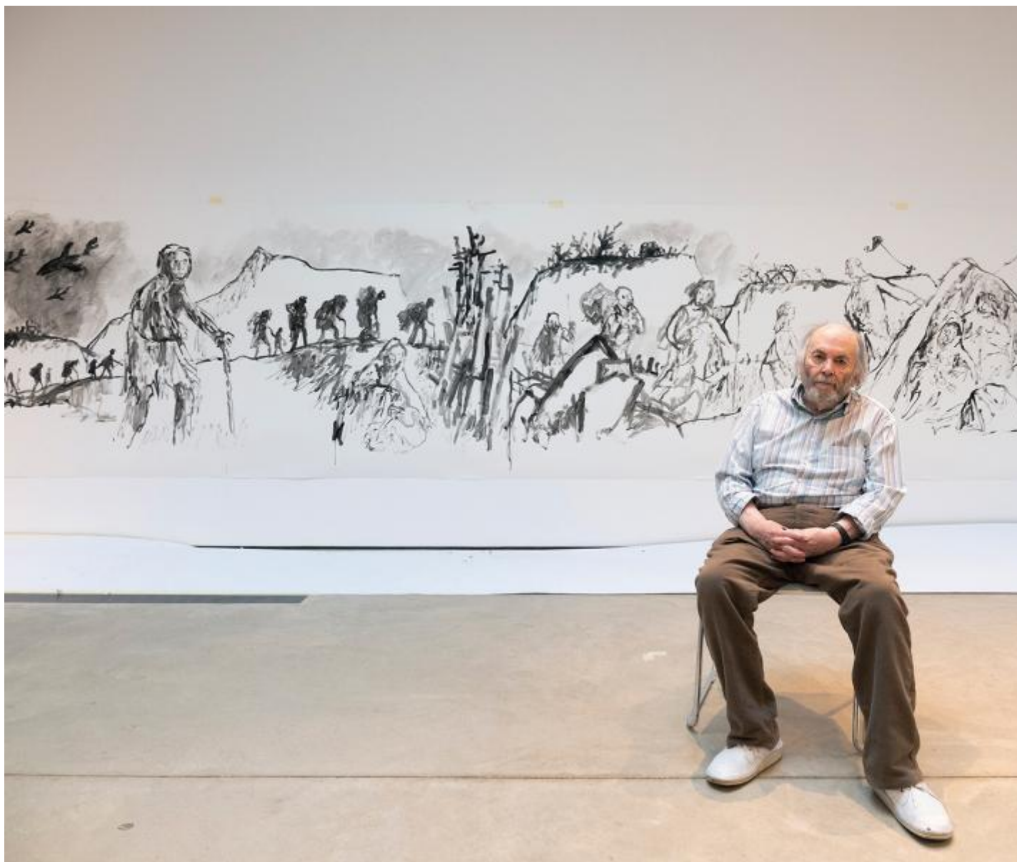
The Taxi Driver, 2020.

Aspetti meno conosciuti, ma molto interessanti dell'opera di Blake documentati dal volume sono i numerosi interventi di pittura murale eseguiti in spazi pubblici, come Università, musei di fama internazionale, per esempio la National Gallery o il Petit Palais, in occasione di esposizioni in cui la grande pittura è stata commentata e resa è più avvicinabile a un pubblico di famiglie e bambini dai meravigliosi personaggi dell'artista. O come il grande murale dipinto per la Hastings Contemporary, The Taxi Driver , dedicato al tema dei migranti e dei rifugiati. Numerosi e commoventi anche gli interventi progettati per ospedali, in particolare reparti pediatrici e maternità, case di cura per anziani, centri per la salute mentale e i disturbi alimentari, nei quali la qualità immaginativa di Blake si rivela anzitutto nella scelta dei soggetti e nella delicatezza della rappresentazione: una galleria di figure umanissime di tutte le età che suggeriscono a chi le osservi sentimenti di affetto, solidarietà, rispetto e, al contempo, il desiderio di essere, per chi soffre, fonte di diletto e fiducia, meraviglia e speranza.