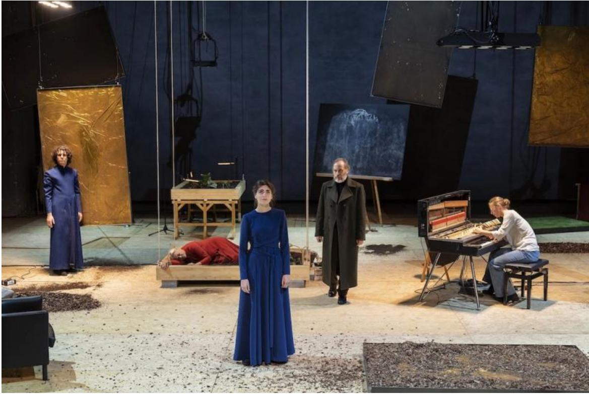
Processo Galileo.

Altra remissione quella di Galileo Galilei, che si arrende all'Inquisizione e abiura. Ripercorre il caso dello scienziato, riportandolo ai temi del rapporto tra scienza, tecnologia, natura e esistenza umana, uno spettacolo firmato da due registi e due drammaturghi, con ampi stralci da opere dello stesso Galilei nel prologo. Processo Galileo , con la direzione di Carmelo Rifici e Andrea De Rosa, produzione Lac di Lugano, Ert e Teatro Piemonte Europa, visto allo Storch di Modena, si ispira nell'impianto di Daniele Spanò a Brecht, con pedane disseminate nello spazio scenico, lavagne pendenti per dimostrazioni e calcoli, plafoniere a led che rendono chiara l'azione (con ombreggiature, sempre a cura di Pasquale Mari, che avanzano a mano a mano che si punta il dito contro le derive della scienza).