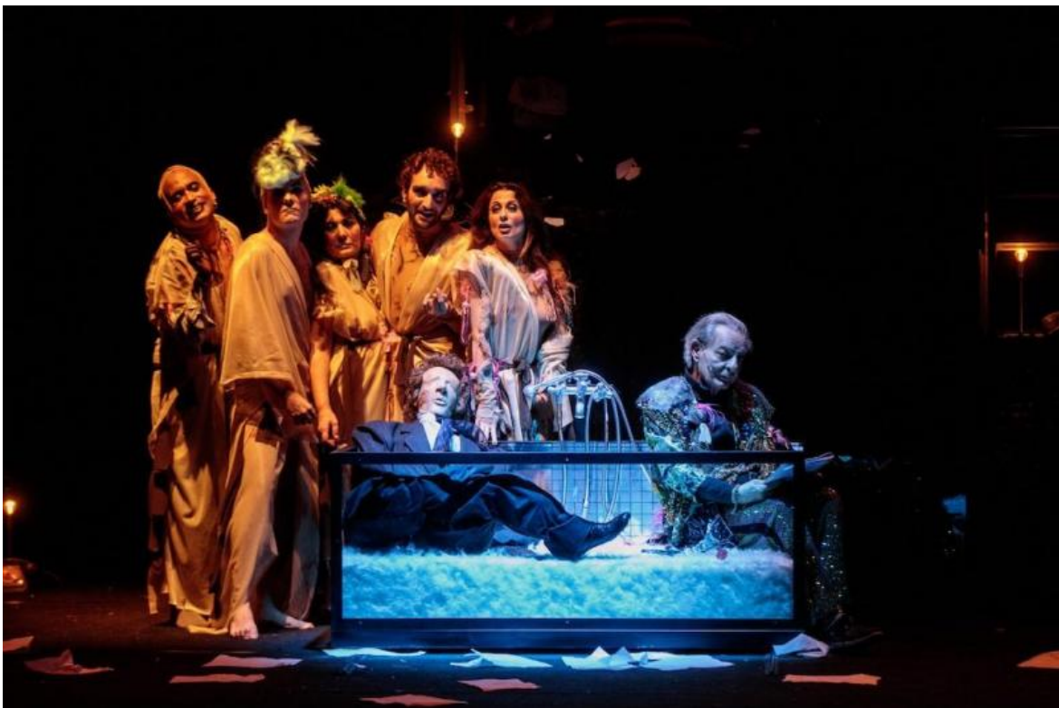
Libidine violenta , ph. Pepe Russo.

Il finale trascina nei problemi della scienza con la scrittura ritmica, insieme cantante e sincopata, melodiosa e incrinata da continue, interne fratture, di Fabrizio Sinisi, una delle migliori penne per la scena. Per esempio, in questi versi (la sua migliore scrittura è in versi), affidati al carisma (dubbioso) di Galileo-Lazzareschi: "Davanti ai nostri occhi non succede niente. / Gli eventi sono nascosti / giù, nel profondo, / al di là dell'apparenza: è lì / che accadono gli eventi / ma voi non li vedete / se voi non imparate a intender la lingua. / L'elettrone, come un demone o un dio, / appare e scompare, / ovunque, in ogni luogo, / lampeggia nelle cose / circondato dal vuoto / come un'apparizione: (...)".