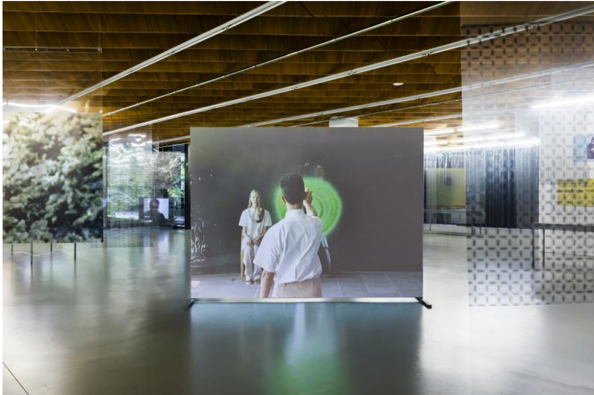
«Space as Matrix», gta exhibitions, 2022.

In mostra un lungo video mostra il processo alla base del progetto per il centro Jagonari. Nato dall'iniziativa di gruppo di donne del Bangladesh dell'East End londinese per la creazione di un luogo per la conoscenza e la ricerca dell'identità femminile, Jagonari (letteralmente Alzatevi donne) era stato concepito da Matrix insieme alle sue fondatrici come uno spazio ibrido, laico, in cui donne di fedi e culture asiatiche diverse potessero incontrarsi. Jagonari forniva corsi di formazione, sostegno legale ed emotivo contro la violenza domestica, aiuto per la cura dei figli, oltre al fatto di essere anche solo un punto di incontro per tutte le donne asiatiche. Jagonari è stato il primo progetto di Matrix e ha rappresentato un'esperienza seminale per il collettivo.