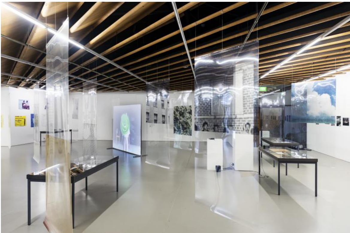
«Space as Matrix», gta exhibitions, 2022.

Collegare, comprendere la complessità dei differenti livelli di relazioni sociali che concorrono simultaneamente a definire lo spazio è l'oggetto di una piccola, ma importante mostra, che ha aperto da alcuni giorni al Politecnico di Zurigo a cura di Niels Olsen, Fredi Fischli e Geraldine Tedder (gta exhibitions) intitolata "Space as Matrix", spazio come matrice, dove il concetto di matrice è pervasivo, e incrocia il lavoro di diversi architetti e artisti che hanno indagato e contestato la gerarchizzazione dello spazio e le relazioni che ne derivano.