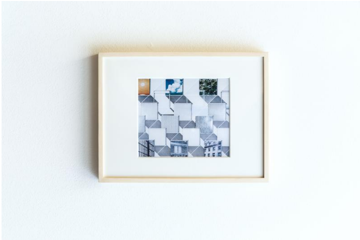
«Space as Matrix», gta exhibitions, 2022.

Ancora oggi, il 4 maggio di ogni anno, anniversario della morte di Altab Ali, convergono nel parco centinaia di leader della comunità, attivisti e militanti antirazzisti in solidarietà contro il razzismo e l'estremismo nell'East End.