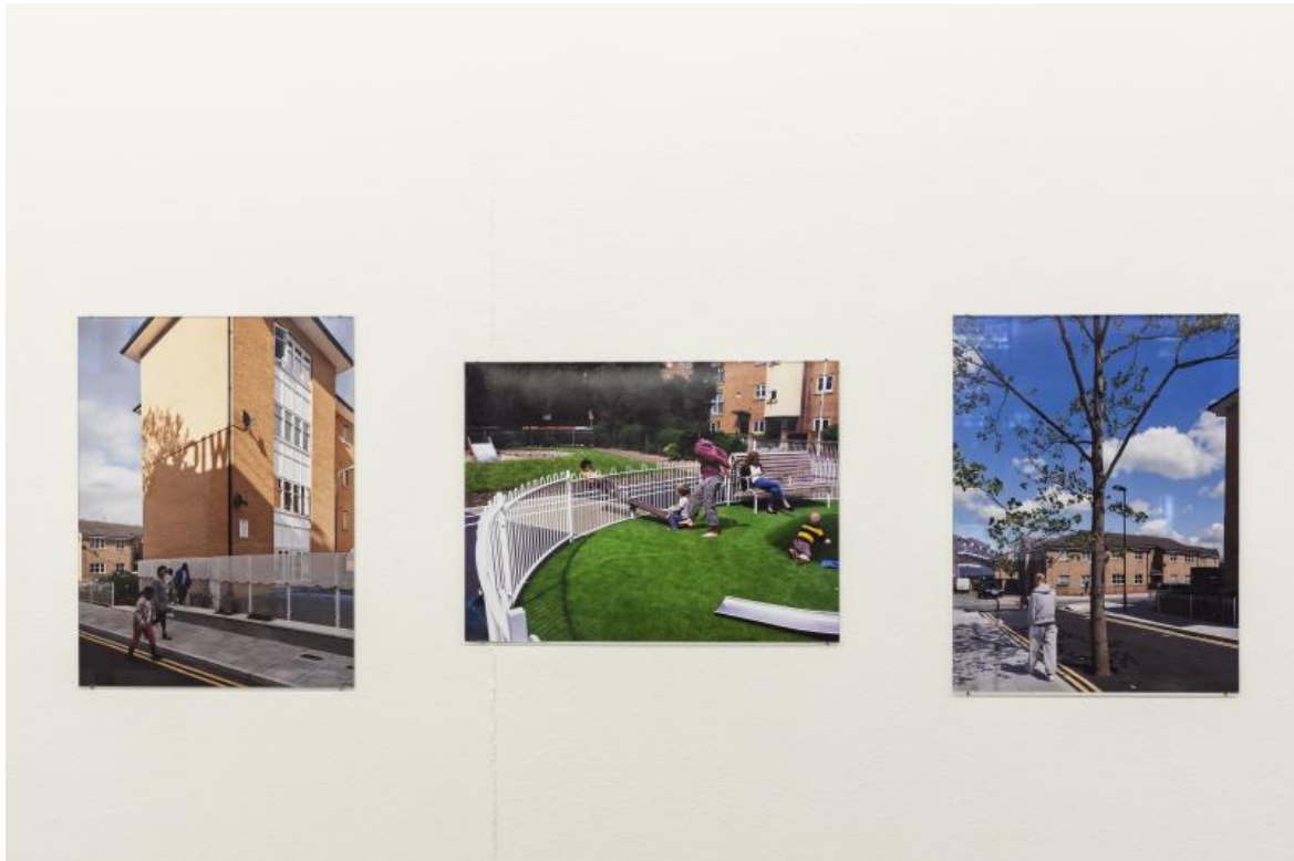
«Space as Matrix», gta exhibitions, 2022.

La casa, ad esempio, è una delle più potenti forme simboliche che conosciamo. Essa incarna l'idea dell'abitare, cioè tutti quei valori e quelle gerarchie che regolano le modalità di relazione all'interno del nucleo familiare, e tra esso e l'esterno. I soggetti che regolano l'idea di casa perpetuano e rafforzano attraverso le forme, l'immagine e la struttura della casa stessa, e quella che Torre chiama l'ideologia.