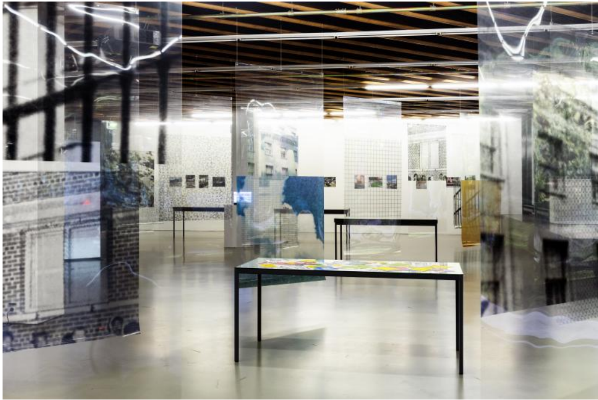
«Space as Matrix», gta exhibitions, 2022.

A metà degli anni Novanta l'attività di Matrix si esaurisce con le conseguenze del Thatcherismo, che aveva tagliato quei sussidi alla base della loro attività. È solo un anno dopo il suo scioglimento nel 1994, che nasce muf, uno studio a metà tra la pratica artistica e architettonica che nelle sue stesse parole "crea spazi per più di un soggetto (fragile) alla volta", e che "deliberatamente descrive il proprio lavoro lasciando un certo grado di vaghezza, di ambiguità, un'apertura che dia la possibilità a ognuno di poterlo leggere in modo differente e complementare".