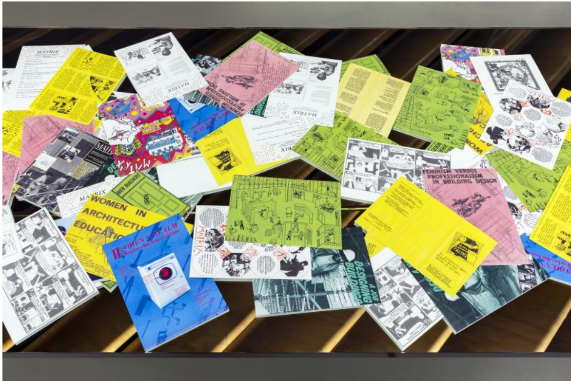
«Space as Matrix», gta exhibitions, 2022.

coloro che normalmente sono esclusi dai processi decisionali, o dalle ideologie dominanti: donne in contesti patriarcali, bambini negli spazi pubblici, migranti. Architetture che tengono conto di una società plurale, in cui i fenomeni sono correlati, e hanno bisogno di essere compresi nella correlazione con cui si manifestano, che mettono in discussione la relazione che esiste tra lo spazio e le persone che lo abitano, e sottolineano l'importanza degli spazi stessi nelle dinamiche relazionali tra gli individui.